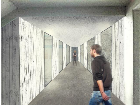
Mynd 3. Hugmynd - inni í tengigangi milli húsa