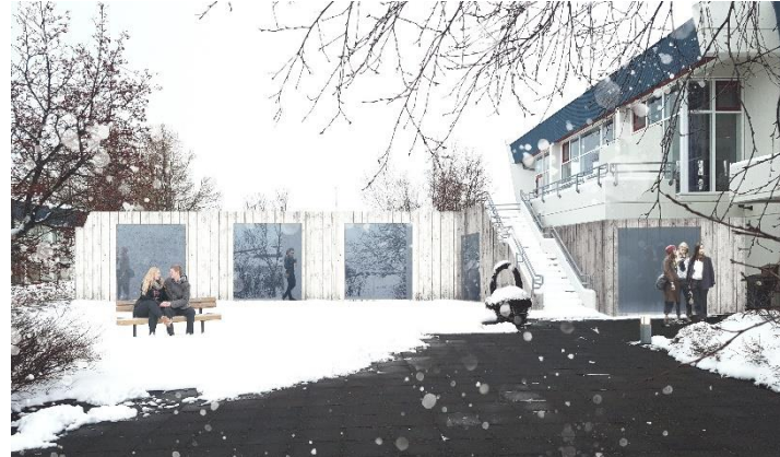
Mynd 4. Hugmynd – tengigangur séður frá stétt milli húsa

Stjórnendur skólans leggja til við Framkvæmdasýslu ríkisins að lögð verði vinna við hönnun tengigangs milli heimavistar og kennsluhúss ME.