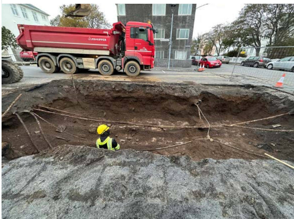
Mynd 4: Mynd af framkvæmdasvæði þegar greftri var að mestu lokið, horft til vesturs.