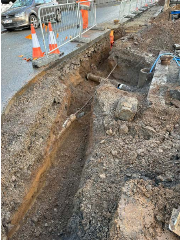
Mynd 6: Mynd tekin þegar búið var að grafa frá frárennislögnum, horft í norðaustur.