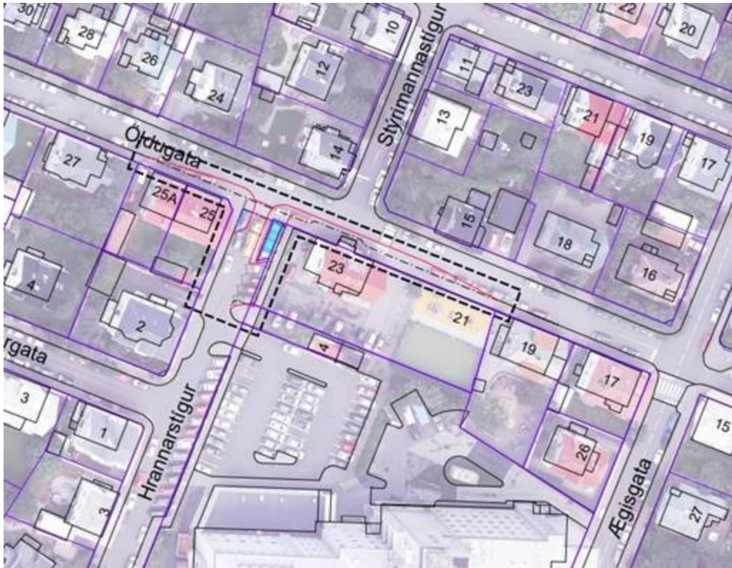
Mynd 2. Kort af rannsóknarsvæðinu. Svarta brotalínan sýnir framkvæmdasvæðið

að rétt norðvestan við skólahúsið, þar sem í dag er norðausturendi Hrannarstígs við gatnamót Öldugötu. Ekki er vitað hvaða hlutverki þessi hús hafa þjónað.