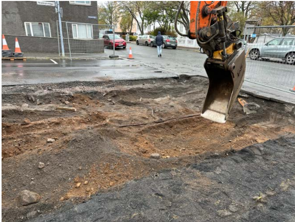
Mynd 3: Framkvæmdasvæði eftir að búíð var að fjarlægja malbik og mókstur hafinn. Horft til norðvesturs.