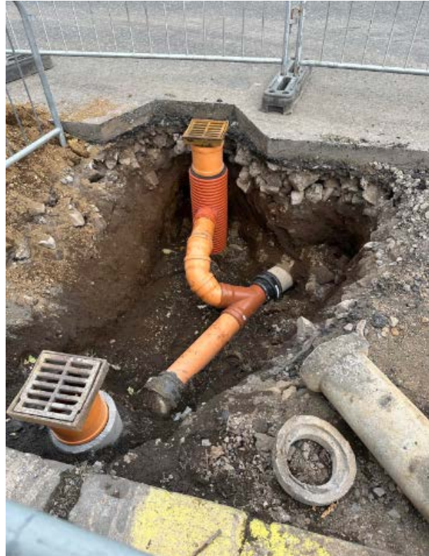
Mynd 5: Mynd eftir að greftri í kringum frárennislagnir er lokið, horft í norður.

Þann 9. október var farið grafa niður til þess að skipta út fráveitulögnum í Öldugötu sjálfri. Þar var aðeins grafið um 1 m niður og aðeins þar sem átti að skipta um lagnir, þ.e. frá ristinni sjálfri og í u.þ.b. 1-1,5m í norður út frá henni. Engar mannvistarleifar komu í ljós við þá framkvæmd, og alls staðar var um jarðvegsskipt efni að ræða.