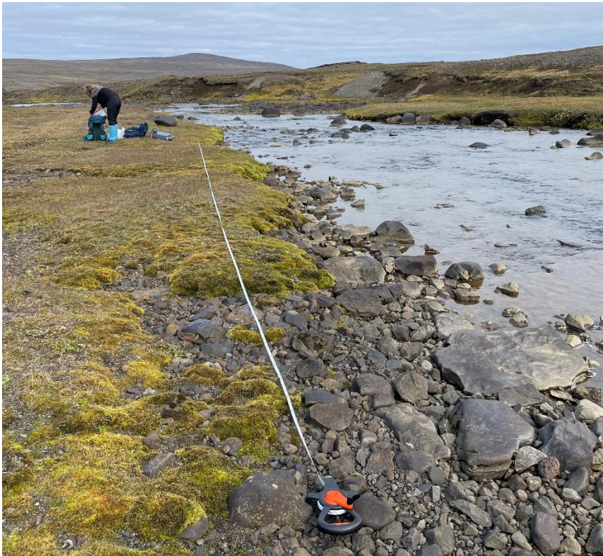
2. mynd. Blaðgrænumælingar undirbúnar á viðmiðunarstöð í Glúmsstaðadalsá (GLU3).

Mælingar á blaðgrænu a voru framkvæmdar á staðnum á steinum í árfaveginum, með BenthosTorch flúrmæli (bbe Moldaenke ® ), sem gefur heildarmagn blaðgrænu a ( \mu\text{g cm}^{-2} ). Mælirinn sendir frá sér ljós og er endurkast þess af mismunandi bylgjulengdum notað til útreikninga á magni blaðgrænu a . Nákvæmni mælinga á blaðgrænu með flúrmælinum er upp á 0,1 \mu\text{g Chl-}a \text{ cm}^{-2} (bbe-moldaenke, 2023). Mælirinn skiptir mældri blaðgrænu a upp í þrjá hópa út frá endurkasti af mismunandi bylgjulengdum, í grænþörungum, kísilþörungum og blá-bakteríum. Afmarkað var 15 m svæði meðfram árfarveginum þar sem mælingar fóru fram á tilviljunarhnitum (2. mynd).