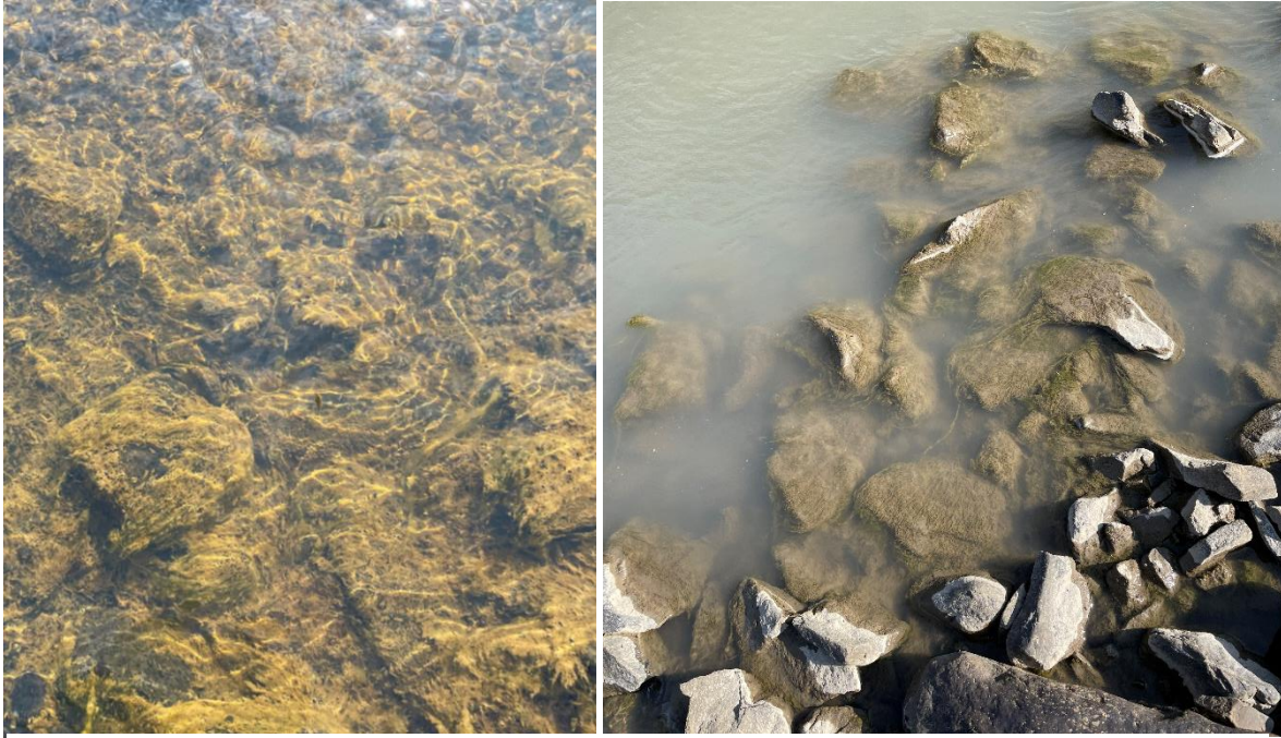
4. mynd. Þörungagróður og rýni á viðmiðunarstöð (GLU3) t.v. og á fyrstu stöð neðan leka (GLU1) t.h. í Glúmsstaðadalsá.

rýni milli stöðva og sást ekki til botns á fyrstu stöð neðan leka (GLU1) (4. mynd). Magn blaðgrænu a var nánast það sama á stöð neðan leka í Glúmsstaðadalsá (GLU2, 1,0 \mu\text{g}/\text{cm}^2 ) og á viðmiðunarstöðinni (GLU3, 1,2 \mu\text{g}/\text{cm}^2 ) en nokkuð hærra í Hrafnkelsá (HRA2) eða 2,0 \mu\text{g}/\text{cm}^2 . Samræmt vistfræðilegt gæðahlutfall (nEQR) fyrir blaðgrænu a var 1,0 eða mjög gott neðan leka í Glúmsstaðadalsá og á viðmiðunarstöð og 0,9 í Hrafnkelsá sem er einnig mjög gott ástand (Tafla 1).