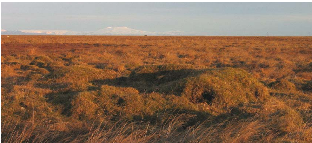
Mynd 6. ÁR-201:008 Kláðatóft