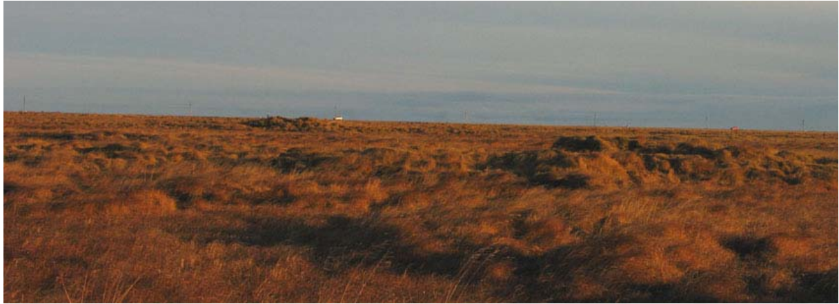
Mynd 5. Nabbatóft í forgrunni. Svartsel fjær.