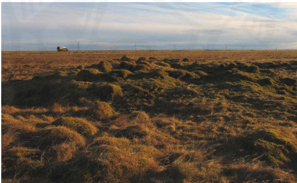
Mynd 4. ÁR-199:034 Hannesarhús, séð úr norðvestri.

Hannesarhús (ÁR-199:034) eru leifar beitarhúsa í Austurbæjarmýri. Sjást þar greinileg ummerki um byggingar, en mjög þýfðar. Minjarnar eru um 100 m vestan vegar, við norðurenda skurðar sem liggur frá Síberíu til norðurs og samhliða veginum.