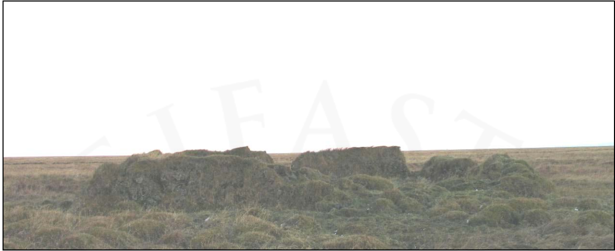
Mynd 3. tóft í Kaldaðarnesmýri

Ekki var kunnugt um neinar fornleifar í Kaldaðarnesmýri, en við vettvangsrannsókn fannst þar einn minjastaður, um 900 m NNV við Einbúa. Er það tóft (ÁR-219:049), frá síðari tímum, hlaðin úr torfi og hraungrjóti. Ekki er ljóst hvaða hlutverki hún hefur gegnt.