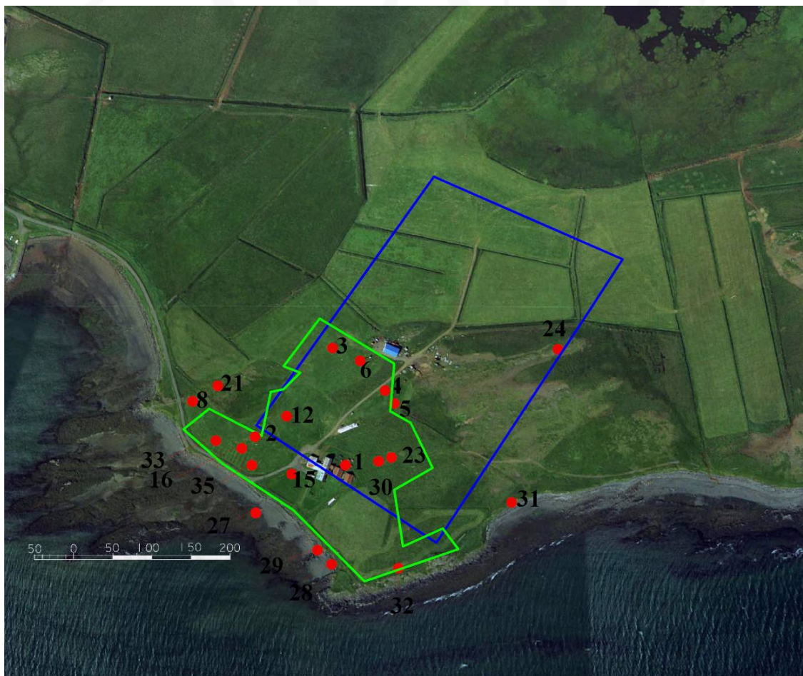
Mynd 1. Byggingareitur A. Fornleifar á Katanessi. Númerin vísa til fornleifaskrár Kataness. Ljósgræna línan sýnir mörk gamla túnsins um 1920. Ljósbláa línan sýnir fyrirhugaða staðsetningu verksmiðjunnar.

hann hafi ávallt staðið á sama stað. Á bæjarhólnum stendur steinsteypt íbúðarhús og gömul útihús. Ekki leikur vafi á að í bæjarhólnum eru miklar mannvistarleifar.