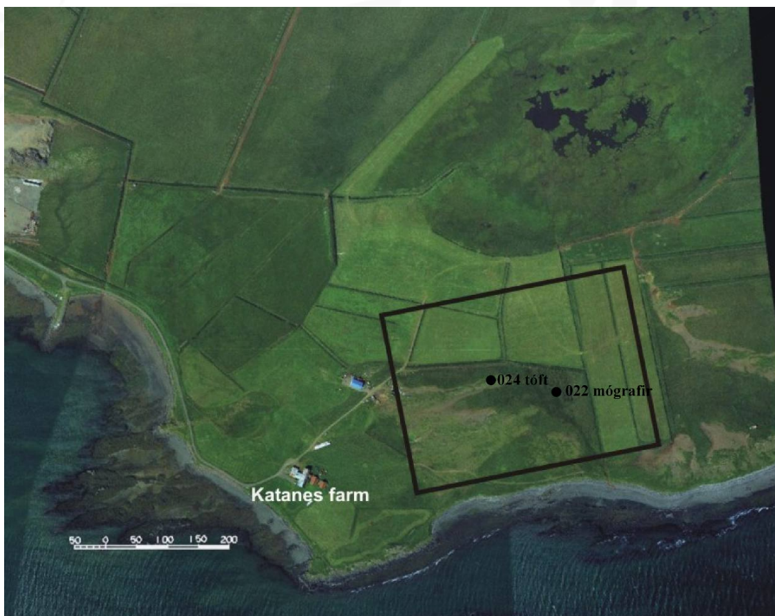
Mynd 2. Byggingareitur B. Númerin vísa til fornleifaskrár Katanes. Svarta línan afmarkar fyrirhugað framkvæmdasvæði.

Um mitt sumar 2003 var Fornleifastofnun Íslands tilkynnt að ákveðið hefði verið að kanna aðra möguleika á staðsetningu rafskautaverksmiðju í Katanesi. Nýjar hugmyndir gerðu ráð fyrir að verksmiðjan yrði reist austan Katanesstúns, Nær svæðið næstum að sjávarbakkanum