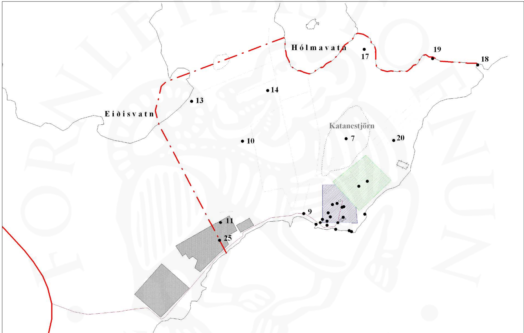
Yfirlit fornleifa í Katanesi. Skipulagsreitur A er blár, skipulagsreitur B grænn. Rauða línan táknar landamerki, númer vísa í fornleifaskrá. Gráu reitirnir sýna núverandi verksmiðjur á Grundartanga.