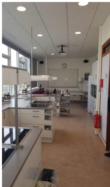
Mynd 7 Eldhús fyrir kennslu í heimilisfræði