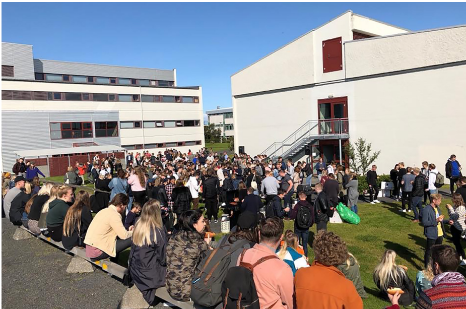
Mynd 4: Grillveisla á nýnemadögum.

gengur í rauntíma. Kennari getur þá séð hvaða efni nemendur hafa náð tökum á og hvaða efni þarf að fara betur í. Við val á efnistöku um upprifjunarnámskeiðsins var stuðst við niðurstöður stöðumatans undanfarin ár og var megináhersla lögð á algebru og fallahugtakið ásamt nokkrum öðrum lykilhugtökum.