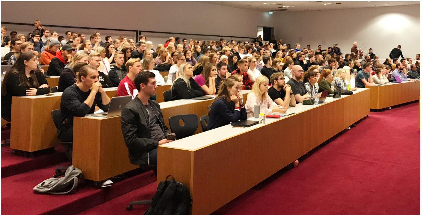
Mynd 3: Vinnustofa í tölvunarfræði.