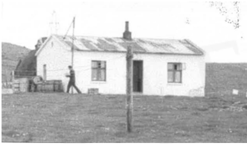
Garður, GogG, 75

Upphafleg notkun: Íbúð Núverandi notkun: