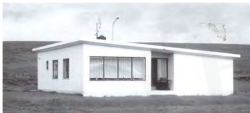
Eiðar, GogG, 72

Upphafleg notkun: Íbúð Núverandi notkun: