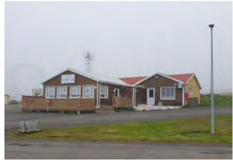
Verslunarhúsin með viðbyggingu 2022