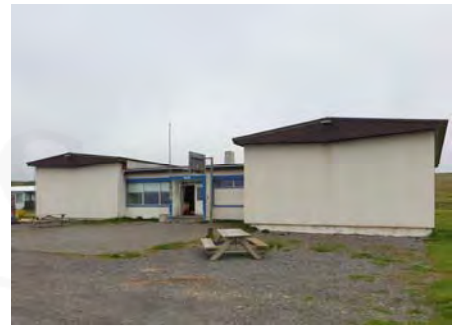
Félagsheimilið Múli, GogG, 509