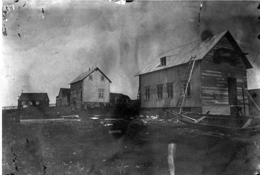
Mynd 2: Ljósmynd HEB-1499 frá Minjasafninu á Akureyri. Miðgarðakirkja er lengst til vinstri á mynd, þá gömlu bæjarhúsin, skólinn og því næst (og lengst til hægri) yngri bæjarhús í Miðgarði sem var byggt 1905 og er nú er elsta uppistandandi hús eyjunnar

Í úttektunum er öllum húsum sem tilheyrðu viðkomandi jörð lýst og stærðir þeirra og ástand tilgreint. Farið hefur verið yfir eftirfarandi úttektir jarða í Grímsey: