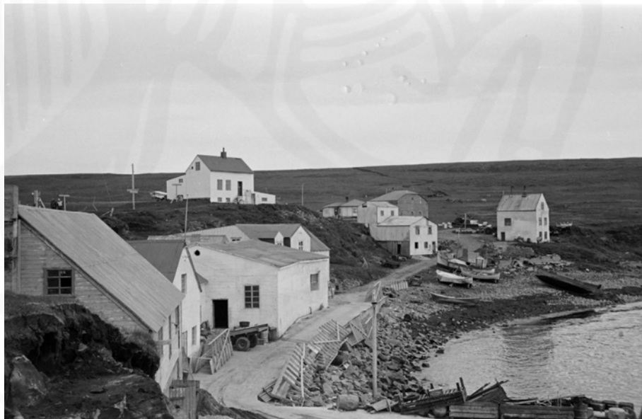
Mynd 2: Horft yfir hafnarsvæðið í Grímsey

uppskrifta var árið 2022 útbúinn heimildagrunnur fyrir standandi hús í Grímsey. Aðeins var unnin grunnvinna en útbúin færsla fyrir öll standandi íbúðarhús í eyjunni og einnig þau þjónustu- og iðnaðarhús sem eru