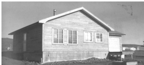
Sætún, GogG, 201