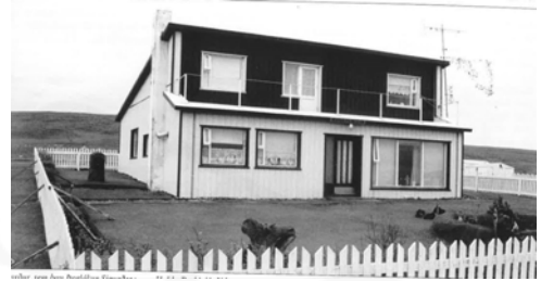
Garður 1961, GogG, 77