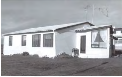
Bjarg, GogG, 50

Upphafleg notkun: Íbúð Núverandi notkun: