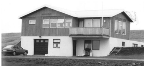
Gerðuberg, GogG, 79

Upphafleg notkun: Íbúð Núverandi notkun: