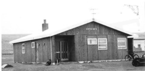
Eyvík, GogG, 74