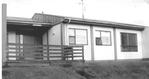
Sæborg, GogG, 200

Upphafleg notkun: Íbúð Núverandi notkun: