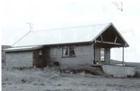
Lundur, GogG, 112

Upphafleg notkun: Íbúð Núverandi notkun: