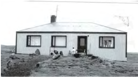
Ytri-Grenivík, GogG, 92

Upphafleg notkun: Íbúð Núverandi notkun: Íbúð