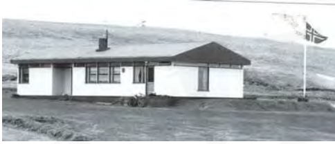
Hella, GogG, 104

Upphafleg notkun: Íbúð Núverandi notkun: