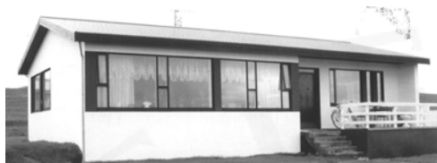
Tröð, GogG, 202

Upphafleg notkun: Íbúð Núverandi notkun: