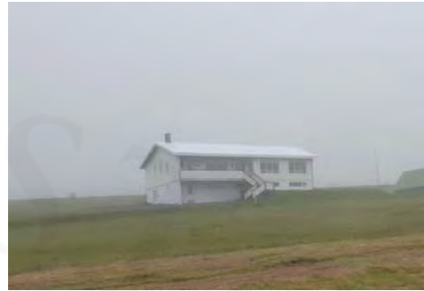
Höfði, GogG, 109