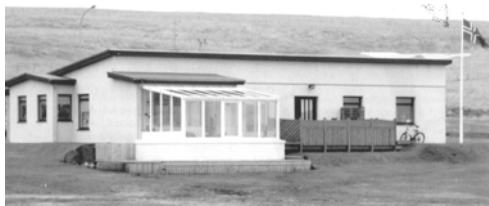
Sólbrekka, GogG, 178

Upphafleg notkun: Íbúð Núverandi notkun: