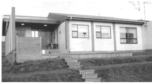
Skuld, GogG, 170