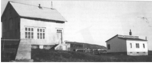
Skólahúsið og Miðgarðar, GogG, 385

Upphafleg notkun: Íbúð Núverandi notkun: