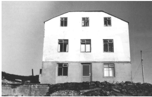
Sólberg, GogG, 172

Upphafleg notkun: Íbúð Núverandi notkun: