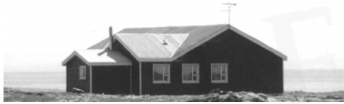
Borgir, GogG, 63

Upphafleg notkun: Íbúð Núverandi notkun: