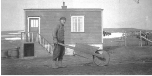
Sandgerði 1940, GogG, 137