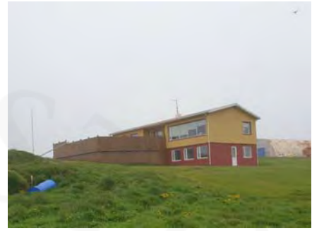
Neðri-Sandvík (III), GogG, 161

Gerð húss: Upphafleg Núverandi Helstu breytingar: Hönnuðir breytinga: Byggingarefni: Útveggir: Þakgerð: Þakklæðning: Undirstaða: Útlit: