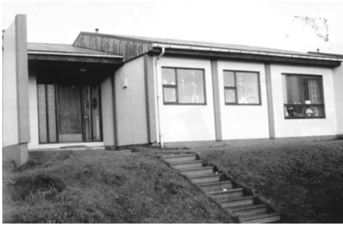
Miðhús, GogG, 125