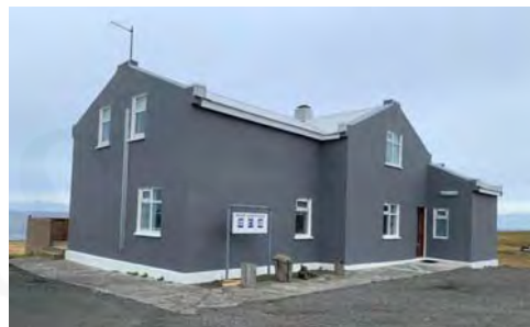
Básar, GogG, 48