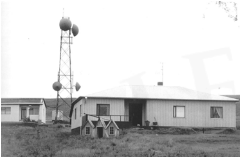
Nýja-Sjáláland, GogG, 131

Upphafleg notkun: Íbúð Núverandi notkun: