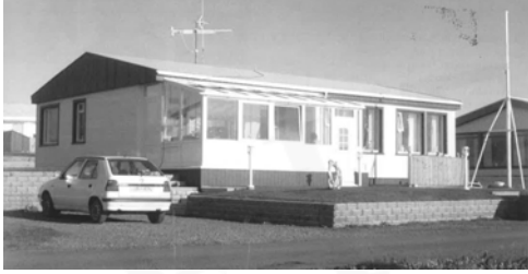
Grund, GogG, 99