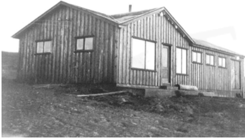
Verslunarhús KEA 1958, GogG, 319

Upphafleg notkun: Íbúð Núverandi notkun: