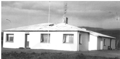
Sveinsstaðir, GogG, 192

Upphafleg notkun: Íbúð Núverandi notkun: