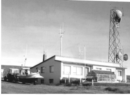
Miðtún, GogG, 128