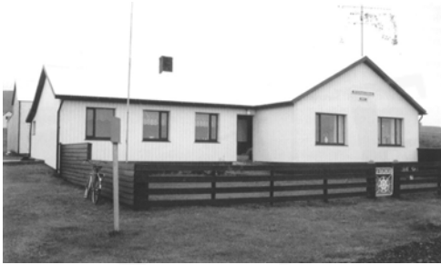
Sveinagarðar, GogG, 187

Upphafleg notkun: Íbúð Núverandi notkun: