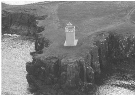
Grímseyjarviti, GogG, 210