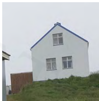
Sjálанд, G g G, 167