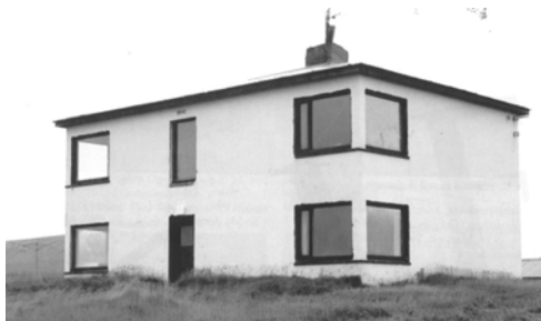
Sigtún, GogG, 162

Upphafleg notkun: Íbúð Núverandi notkun: Íbúð