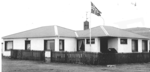
Sveintún, GogG, 197