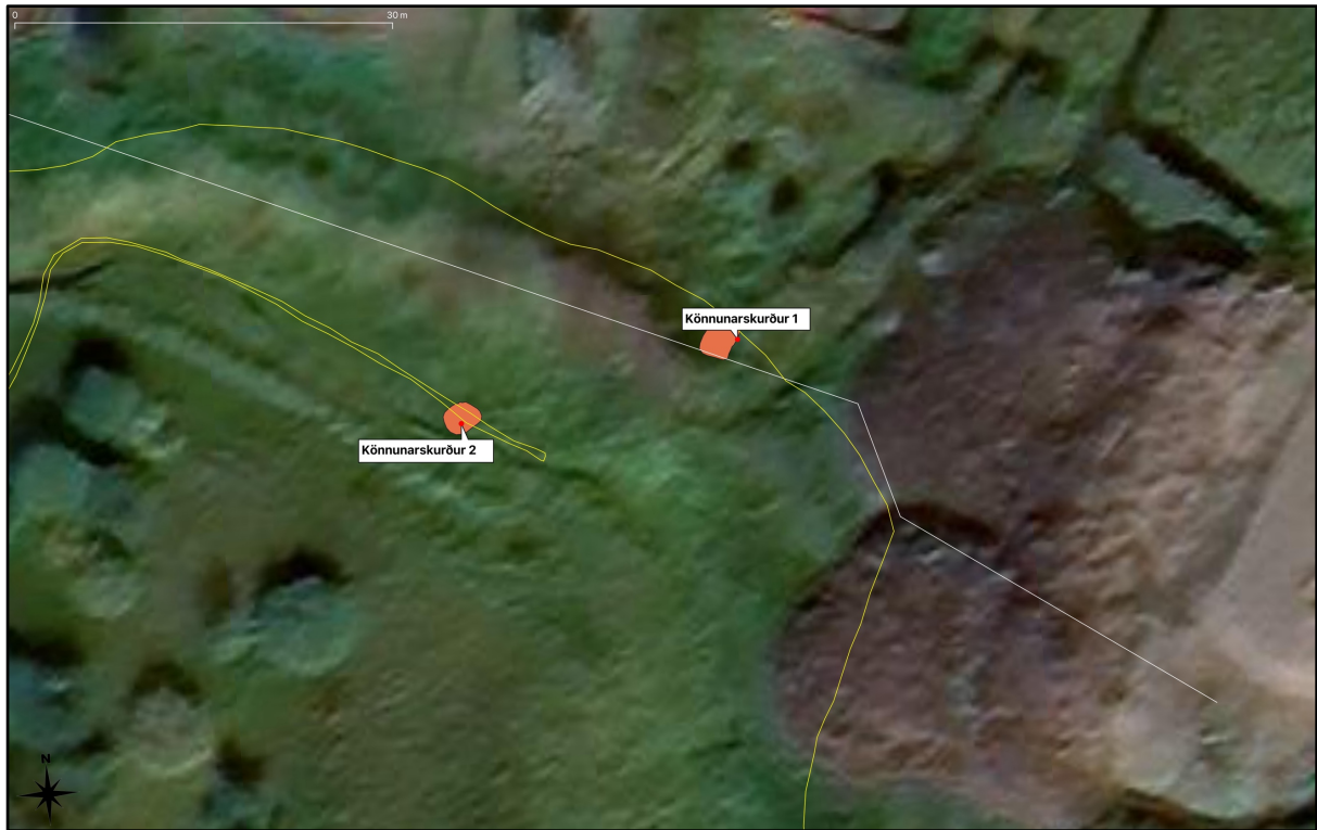
Mynd 1. Hér má sjá merka inn staðsetningu könnunarskurða hjá Garðarstjörn, Seyðisfirði, Múlapingi m.v. uppmældar fornleifar (gulmerktar) og línulögn (hvítmerкта).