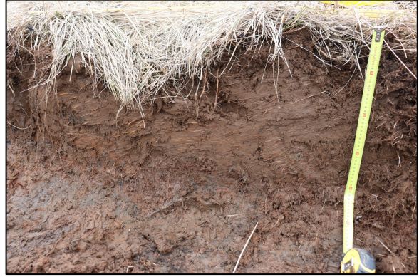
Mynd 4. V-snið í könnunarskurði 2.

Til að meta hvort mannvirkið Garðarstjörn væri um 20 m lengra til vesturs var tekinn lítill og um 40 cm djúpur könnunarskurður, nr. 2 í skráðar minjar, en engin ummerki fannst þar heldur um manngerðan strúktúr, sjá mynd 4. Engir forngripir fundust við rannsóknina. Skurðir voru mældur inn í Isnet hnitum og mæligögnum skilað til Minjastofnunar Íslands.