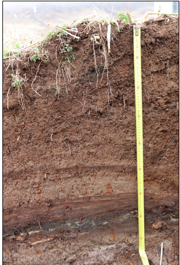
Mynd 3. V-snið í könnunarskurði 1.

Þar sem heimildir bentu til að minjar væru á hluta svæðisins taldist nauðsynlegt að kanna og meta aldur minja áður en framkvæmdir hæfust. Tekinn var könnunarskurður nr. 1 í nyrsta hluta Garðarstjarnar þar sem lögn var talin skera skráðar minjar. Grafið var niður um 85 cm frá yfirborði. Engin hleðsla eða ummerki um mannvirkið Garðarstjörn fannst í könnunarskurði 1, einungis plast og rusl frá 20. og 21. öldinni. Á mynd 3 má sjá vestsnið í könnunarskurði 1. Þar sjást neðst mjög greinileg gjóskulög V-1160/H-1158 og slitrur af V-1477 gjósku en hvorki vísbendingar um mannvirkið Garðarstjörn né forna mannvist.