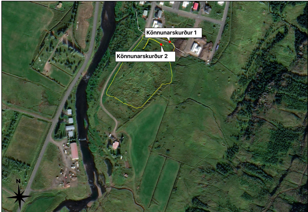
Mynd 2. Yfirlitsmynd yfir Garðarstjörn og framkvæmdasvæðið á Seyðisfirði. Garðarstjörn sýnd með gulu og línulögn með hvítu.