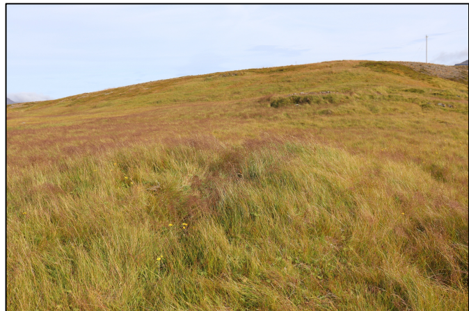
Mynd 2. Horft til suðausturs hjá þúst 2795-15.

2795-15. Þúst. Austan við Eyrarár, í um 220 m fjarlægð suðaustan við íbúðarhúsið að Eyri eru græn og sléttuð tún. Á túninu eru ummerki um búsetu, m.a. þúst sem gæti verið af sléttaðri tóft. Umrótað svæði þústarinnar er á um 5x9 m svæði sem liggur A-V, það stendur um 0,5 m hærra en svæðið umhverfis og skartar háu og grænu grasi. Hlutverk og aldur óþekkt. Ingigerður Jónsdóttir, f.