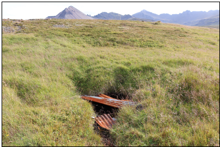
Mynd 7. Vatnsból, horft til suðurs hjá 2795-19.

Tóft 2795-20 og mógrafir 2795-21 eru utan þess viðbótarskráningarsvæðis sem er hér til umfjöllunar.