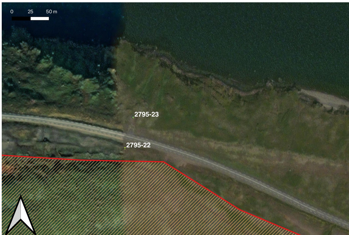
Mynd 8. Yfirlitsmynd af afstöðu minja 2795-22 og 2795-23 til skráningarsvæðisins sem er afmarkað með rauðu og gulu.

2795-22. Hleðsla. Í um 18 m fjarlægð norðan við skógræktarsvæðið að Eyri og í um 12 m fjarlægð sunnan við veg er hægt að greina fremur ógreinilega 0,7x3 m hleðslu 10 steina í einni umröð sem liggja A-V. Aldur og hlutverk hleðslunnar eru óþekkt. Hleðsla 2795-22 er í um 18 m fjarlægð utan og norðan við skógræktarsvæðisins og telst því ekki í hættu.