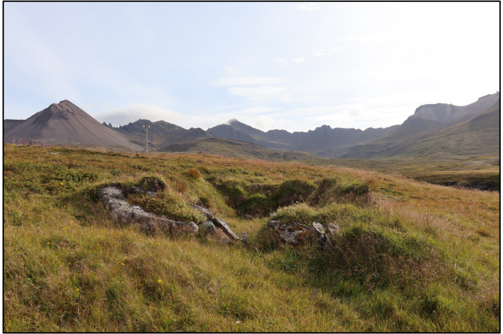
Mynd 6. Horft til suðurs hjá tóft 2795-18.

Minjar 2795-19 eru innan skógræktarsvæðisins og því þarf að gæta að varðveislu þeirra.