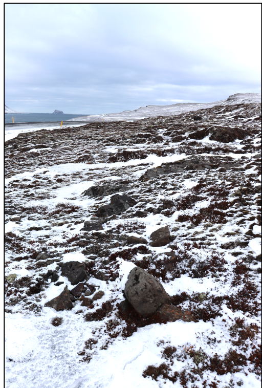
Mynd 9. Horft til austurs yfir hleðslu 2795-22.

2795-22. Hleðsla. Í um 18 m fjarlægð norðan við skógræktarsvæðið að Eyri og í um 12 m fjarlægð sunnan við veg er hægt að greina fremur ógreinilega 0,7x3 m hleðslu 10 steina í einni umröð sem liggja A-V. Aldur og hlutverk hleðslunnar eru óþekkt. Hleðsla 2795-22 er í um 18 m fjarlægð utan og norðan við skógræktarsvæðisins og telst því ekki í hættu.