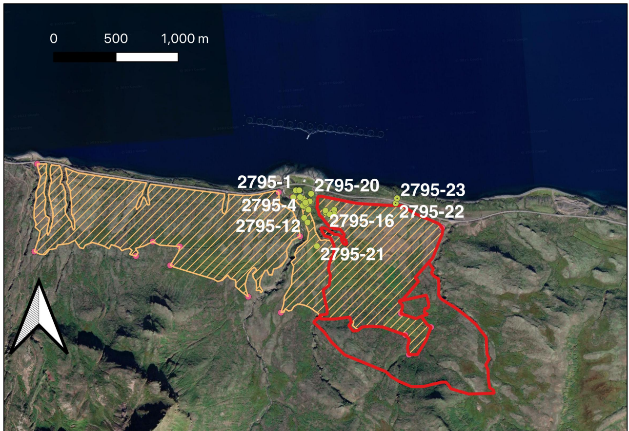
Mynd 11. Yfirlit yfir skráningarsvæðið 2023 sem er merkt inn með rauðum fláka. Allt innan fláka með gulum skáröndum var skráð 2022. Engar minjar fundust innan rauðmerkta svæðisins til suðausturs (ekki skárendur).

Tóft 2795-23 er í um 56 m fjarlægð norðan við mörk skógræktarsvæðisins og telst því ekki í hættu.