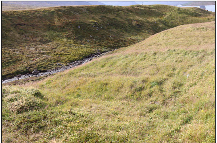
Mynd 5. Horft til norðvesturs hjá tóft 2795-17.

Minjar 2795-17 eru innan skógræktarsvæðisins og því þarf að gæta að varðveislu þeirra.