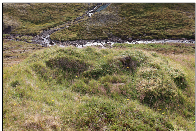
Mynd 3. Horft til vesturs hjá tóft 2795-16.

2795-16. Tóft. Austan við Eyrarár, á Eyrarhaga, í um 230 m fjarlægð suðaustan við íbúðarhúsið að Eyri er lítil, hálf sporöskjulaga tóft yst og suðvestast á grænu túni, þvermál um 3,7 m. Liggur SA-NV. Breidd veggja um 1 m. Hæð veggja um 0,6 m. Hugsanlega er um kvíar að ræða sem lýst er í örnefnaskrá: „Milli Eyraráa neðst er Eyrartún. Þar voru áður Kvíar,...“.