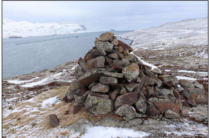
Mynd 10. Varða 2795-23. Horft til austurs.

2795-23. Varða. Í um 56 m fjarlægð norðan við skógræktarsvæðið að Eyri og í um 20 m fjarlægð norðan við veg er hægt að greina vörðu sem er um 2,6 m að þvermáli, með 10 umröðum steina og er um 1,7 m að hæð. Í Örnefnaskrá getur um Vörðuholt. 12