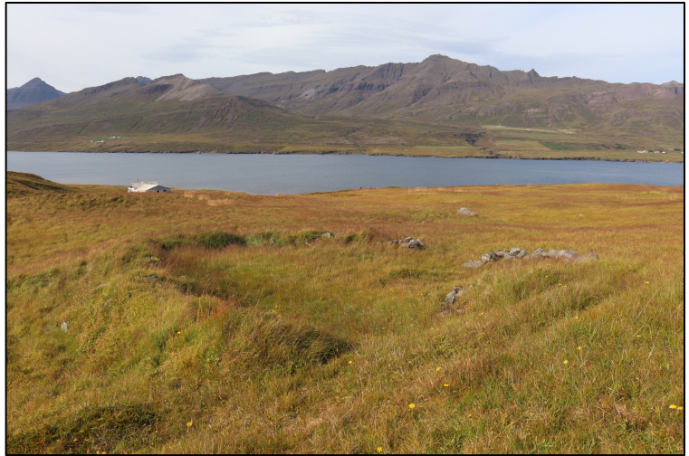
Mynd 4. Horft til norðausturs hjá tóft 2795-17.

2795-17. Stekkur. Í Eyrarhaga, í um 260 m fjarlægð norðaustan við íbúðarhúsið að Eyri er stein- og torfhlaðin tóft. Heildarstærð tóftar 22x17 m. Tóftin liggur NA-SV, stærsta rýmið er steinhlaðið og sporöskjulaga, 11x7 m að innanmáli, inngangur til NA. Hæð veggja um 0,8 m og breidd veggja 1-2 m. Til SSV er lítið rými um 4x4 m að innanmáli, hæð veggja um 0,4 m, breidd veggja 1-2 m. Til SV er annað nánast ferhyrningslaga rými, 4x7 m að innanmáli, hæð veggja 0,2-0,3 m, veggir virðast úr torfhleðslum. Breidd veggja um 1,5 m. Að öllum líkindum er Stekk að ræða, sem þannig er lýst í örnefnaskrá: „Eyrarhagi er neðst við Selá inn að vörðu á Stekkamelum. Stekkur er innan við melana, rétt utan við á.“ 10