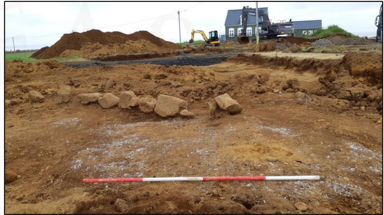
Mynd 3. Skeljalag og grjóthleðsla sunnan við Ráðagerði. Horft til norðurs.

steinum, og sunnan við hana var þykkt rusla- og skeljalag [003] með dýrabeinum, fiskibeinum, bláskeljum og blönduðu rusli (sjá mynd 4). Í jarðlaginu fundust einnig nokkur leirkerjabrot, glerbrot, járnkrókur og óþekkt járnstykki. Neðar í þessu jarðlagi voru aðeins skeljar, engir aðrir gripir. Jarðlagið var um 10-15 cm þykkt með gríðarmiklu magni af fremur heillegum bláskeljum. Lagið lá upp að gjóthleðslu [004] og virðast lagið og hleðslan vera nokkurn veginn samtíða.