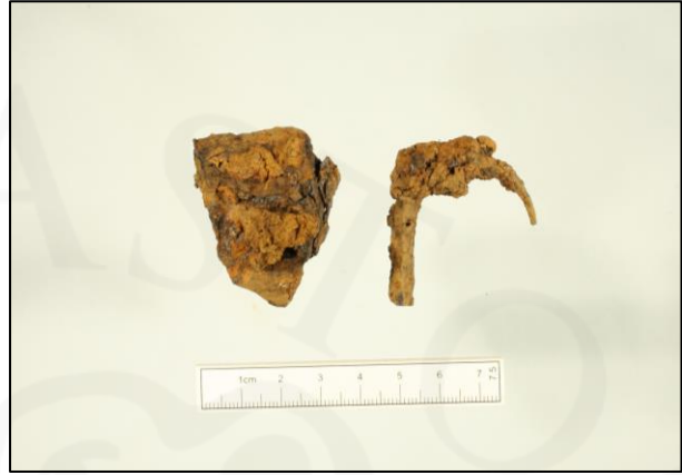
Mynd 7. Járn úr rusla- og skeljalagi [003]. Gripanúmer 2021-56-2.