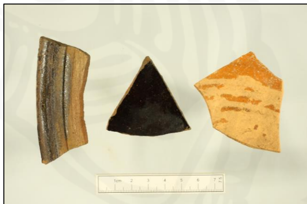
Mynd 5. Leirker í rusla- og skeljalagi [003]. Gripanúmer 2021-56-3.

Sýnishorn af þeim gripum sem fundust í skráðum jarðlögum á framkvæmdasvæðinu voru hirtir. Allt voru þetta gripir úr ruslalögum frá norðausturhluta svæðisins [002] næst bæjarstæðinu, eða úr rusla- og skeljalagi [003]. Þetta voru glerbrot (ýmist rúðugler eða úr ílátum og flöskum), leirkerabrot (ílát og múrsteinn), bútar úr járn (þar á meðal einhverskonar krókur), brýni, steinkol, ýmiskonar bein (fuglabein, stórgripabein, kindabein og hrossatennur).