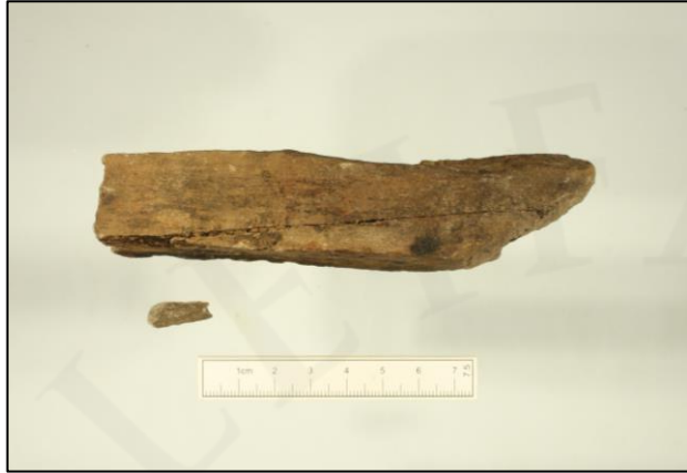
Mynd 6. Brýni úr ruslalagi [002], sem dreift var um túnið í Ráðagerði. Gripanúmer 2021-56-9.