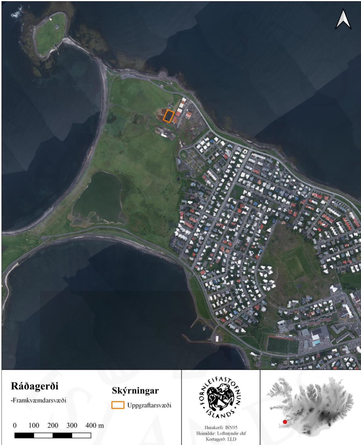
Mynd 1. Staðsetning nýju borholunnar við Ráðagerði á Seltjarnarnesi.