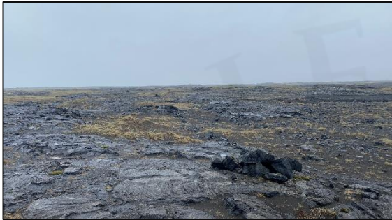
Varða 028_05, horft til VNV.