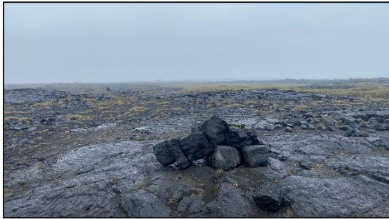
Varða 028_09, horft til VSV.