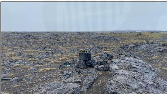
Varða 028_11, horft til suðurs.