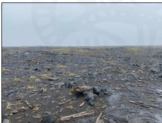
Varða 028_02, horft til norðurs.

Varða 02 er austast á svæðinu. Hún er nær alveg hrunin og er aðeins 0,2 m á hæð og 0,4 m á kant. Hún er hlaðin úr a.m.k. sex steinum en nokkur grjótdreif er umhverfis vörðunna og hefur einhver hluti þess sennilega tilheyrt henni áður. Í miðju vörðunni er nær fallin trjádrumbur.