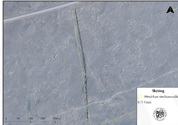
Til vinstri: Mynd af garði 117, horft til norðurs. Til hægri: Loftmynd af sama stað.