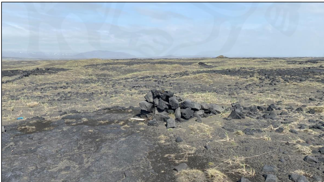
Varða 028_19, horft til norðurs.