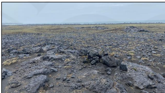
Varða 028_10, horft til austurs.