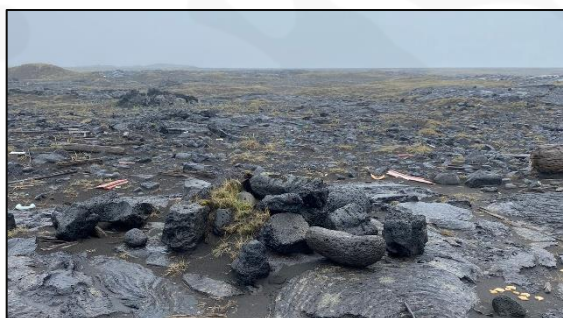
Varða 028_03, horft til norðurs.

Varða 03 er 20 m vestan við vörðu 02. Varðan er nær alveg fallin, hún er 0,2 m á hæð og aðeins neðsta umfarið sést. Varðan er 0,3 x 0,3 m að stærð og hlaðin úr 4-6 steinum.