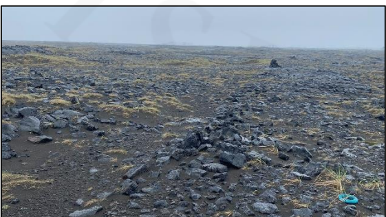
Varða 028_08, horft til SSV.