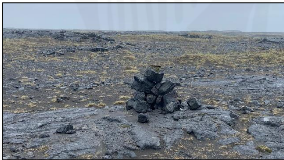
Varða 028_07, horft til VSV.