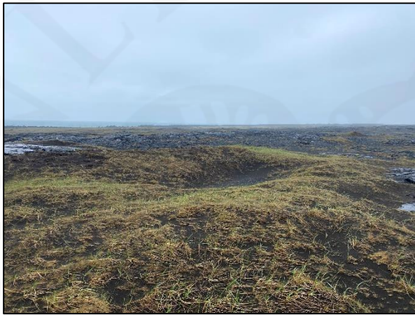
Mynd 1. Dæmi um hálfgróna sandöldu innan úttektarsvæðis, horft til vesturs.

Í ársbyrjun 2022 fór VSÓ Ráðgjöf, fyrir hönd Geo Salmo, þess á leit að Fornleifastofnun Íslands ses. tæki að sér skráningu fornleifa á um 85 ha svæði rétt vestan við Þorlákshöfn vegna fyrirætlana um uppbyggingu eldisstöðvar. Úttektarsvæðið er mitt á milli Suðurstrandarvegur 427 til norðurs og sjávar til suðurs (mynd 2, bls. 7). Úttektarsvæðið nær að götunni Laxabraut 19 til austurs en að landamerkjum jarðanna Þorlákshafnar (ÁR-548) og Nes í Selvogi (ÁR-549) til vesturs.