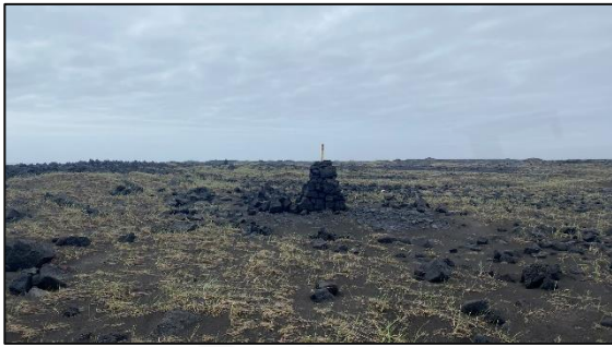
Varða 028_17, horft til VSV.

Varða 17 er tæpum 100 m VSV við vörðu 16. Varðan er 10 m utan við úttektarsvæðið árið 2022 en helgunarsvæði hennar (15 m) er innan þess og því var hún tekin með. Varðan er mjög stæðileg, 1,5 m á hæð og í henni miðri er plaströr. Varðan er 0,7 m í þvermál og hlaðin úr blöndu af smágrýti og stæðilegu grjóti. Grjótið nyrst á vörðunni er áberandi stærra en það sem er á suður helmingi hennar.