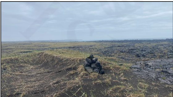
Varða 028_12, horft til suðurs.