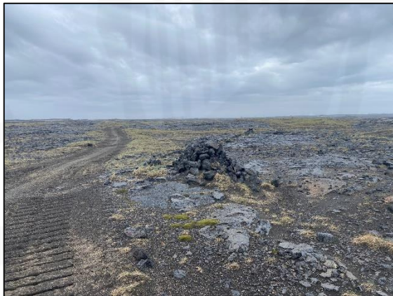
Varða 118, horft til norðausturs.

Varða er um 590 m ASA við vörðu 092 og 130 m norðan við vörðu ÁR-720:028_10. Varðan var skráð undir númerinu 1 í aðalskráningu Þorlákshafnar 2021. Varðan er sennilega á mörkum þess að teljast til fornleifa en fær að njóta vafans og því tekin með í þessa fornleifaskrá. Varðan er rétt sunnan við akfæran malarveg sem liggur um svæðið. Á þessum slóðum er fremur gróðursnautt þótt hér og þar sjáist í mosa og einkennist þetta svæði að sandorpnu hrauni.