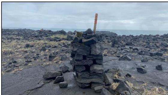
Varða 028_18, horft til suðausturs.

Varða 18 er rúmum 105 m VSV við vörðu 17. Varðan er 15 m utan við úttektarsvæðið árið 2022 en helgunarsvæði hennar (15 m) er innan þess og því var hún tekin með. Varðan er 1,2 m á hæð og 0,6 m á kant. Hún er vandlega hlaðin umhverfis tréspýtu úr stæðilegu grjóti en inn á milli má sjá í flatt hraungrýti. Mosi er á stórum hluta grjótsins og grjótdreif er til austurs og vesturs sem hefur líklega hrunið úr vörðunni.