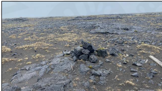
Varða 028_06, horft til VSV.