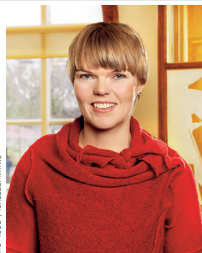
410 4000 | landsbankinn.is

... að Ábyrgðasjóður launa ábyrgist kröfur launamanna sem verða fyrir barðinu á gjaldþroti atvinnurekanda. Þær kröfur geta varðað vangoldin laun þriggja síðustu starfsmánaða, laun í uppsagnarfresti í allt að þrjú mánuði, áunnið orlof og bætur vegna vinnuslysa.