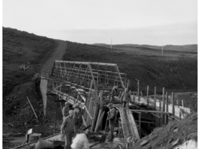
Í samgöngulausu landi þurfti margar hendur við vega- og brúagerð. Alþýðusambandið fór snemma að beita sér í kjaramálum þess hóps og samræma launakjör vegavinnnumanna.

Í kjarasamningum árið 1969 náðist samkomulag um að koma á fót lífeyrissjóðum á almennum vinnumarkaði. Þegar ASÍ samdi um lífeyrissjóðir fyrir almennt launafólk var ellilífeyrir almannatrygginga sem nemur 25% af dagvinnulaunum verkamanna. Á þeim árum var það algerlega ljóst að enginn gat séð sér farborða af slíkum greiðslum og voru eldri borgarar því háðir afkomendum sínum eða sveitarfélögum um framfærslu í ellinni. Lífeyrissjóðirnir eru grundvallaðir á hugsuninni um samtryggingu og samhjálp. Þeim er ætlað að tryggja félögum sínum, mökum og börnum, sómasamlega afkomu ef atvinnutekjur bregðast, vegna elli, örorku eða andláts. Réttur til lífeyris úr sjóðunum eykst eftir því sem meira og lengur er greitt til þeirra.