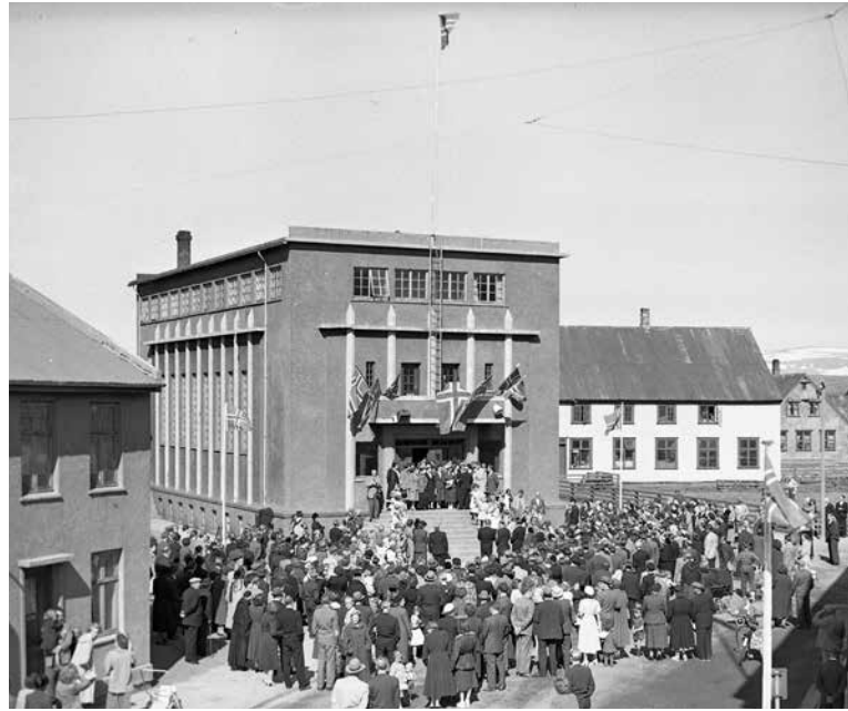
Alþýðuhúsið á Ísafirði, reist árið 1935, eitt glæsilegasta hús verkalýðshreyfingarinnar. Þessar byggingar voru tákn um styrk og stöðu hreyfingarinnar.