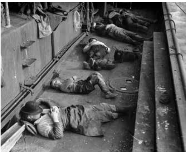
Hvildarstund um borð í togara um miðja 20. öld; ekki eru allir í áhöfninni háir í loftinu. Vökulögin frá 1921 takmörkuðu vinnutíma togarasjómannanna og voru með fyrstu stóru sigrum verkalýðshreyfingarinnar.

Vökulögin 1921 voru fyrsti stóri sigur hins unga Alþýðusambands. Fram að því voru engin takmörk fyrir því hversu lengi var hægt að láta fólk vinna. Dæmi voru um að sjómenn á togurum stæðu sólarhringum saman í aðgerð og að hásetar hafi dottið sofandi ofan í kösina með hníf í hendi eftir slíka þrælavinnu. Þetta vinnuálag gekk vitanlega mjög nærri líkamlegri heilsu manna enda entust þeir ekki nema örfá ár við slík störf. Sjómennirnir létu þetta yfir sig ganga vegna ótta við atvinnumissi. Vökulögin tryggðu 6 tíma lágmarkshvöld á sólarhring á togurum.