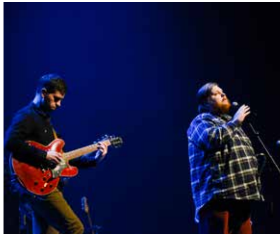
Hljómsveitin Valdimar tók nokkur af sínum þekktustu lögum.