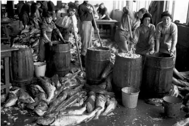
Barnavinna tíðkaðist á Íslandi langt fram eftir 20. öld. Í aflahrotum var unnið meðan stætt var, karlar, konur, börn og aldraðir. Verkalýðshreyfingin vann að því að takmarka vinnutíma barna.