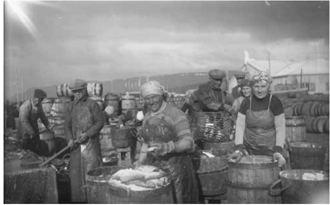
Fólk við fiskvinnslu á fyrri hluta síðustu aldar

Þau vita ekki að fjölskyldan missti allt sitt á fyrripart síðustu aldar þegar fjölskyldufaðirinn slasaðist við vinnu og var þá bara settur í land án launa og án trygginga. Fjölskyldan stóð bjargalaus eftir og hraktist úr lélegu húsnæði í enn lélegra. Þeim er mögulega ekki kunnugt um að afabroðir þeirra var dæmdur í 5 mánaða fangelsi fyrir þátttöku í Borðeyrardeilunni svokölluðu þar sem verkamenn börðust við lögreglu og hvítlíðasveit sem sett var lögreglu til aðstoðar.