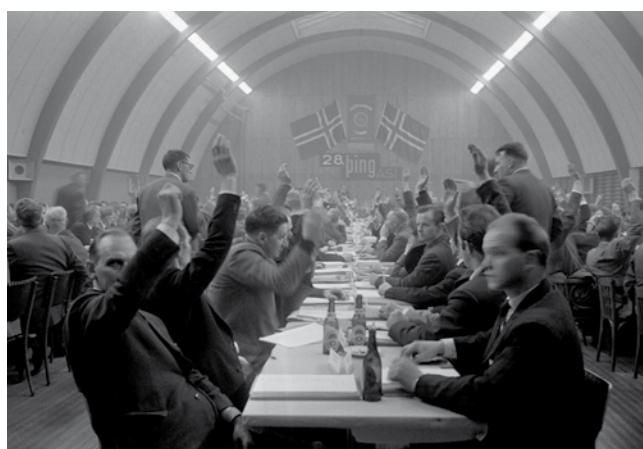
Frá 28. þingi Alþýðusambandsins árið 1962 í íþróttahúsi KR, þarna hittist fólk af öllu landinu, kynntist og gladdist. Á þingunum fór fram stefnumörkun og tekist var á um yfirráð í sambandinu.

Eftir harðvítugt sex vikna verkfall árið 1956 náðist sigur í gömlu baráttumáli verkalyðshreyfingarinnar um atvinnuleysisbætur. Frumvarp til laga um atvinnuleysisstryggingar hafði verið flutt á hverju þingi í 14 ár en allt af verið fellt eða svæft í nefnd. Sigur í þessu baráttumáli hefur haft mikil áhrif til langs tíma. Grunn atvinnuleysisbætur eru nú ríflega 200 þúsund á mánuði.