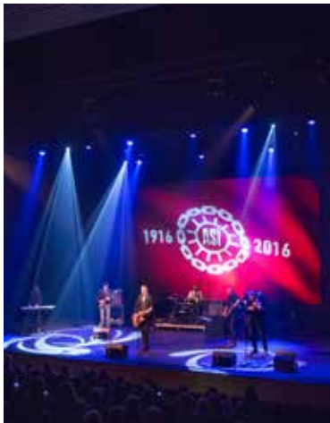
Hvannalds-bræður á heimavelli í Hofi.