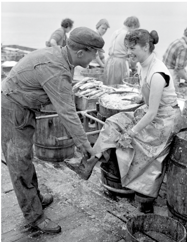
Sildarpeningur settur í stígvél sildarsöltunarstúlkú á Siglufirði eftir miðja 20. öld, til marks um afköst við söltunina og launin. Konur báru uppi fiskvinnslu í landi en laun þeirra voru lengi mun lægri en laun karla.