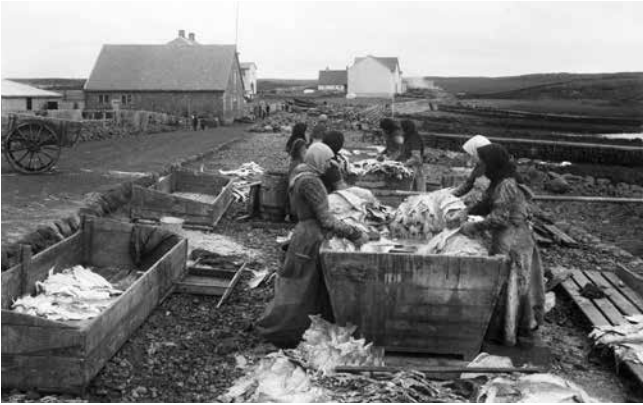
Konur við fiskþvott í Keflavík 1912

Það reyndust alltaf einhverjir almúgamenn tilbúnir til að slást við meðbræður sína í von um mola af borði auðmanna. Brauðmolahagfræðin er ekkert ný.