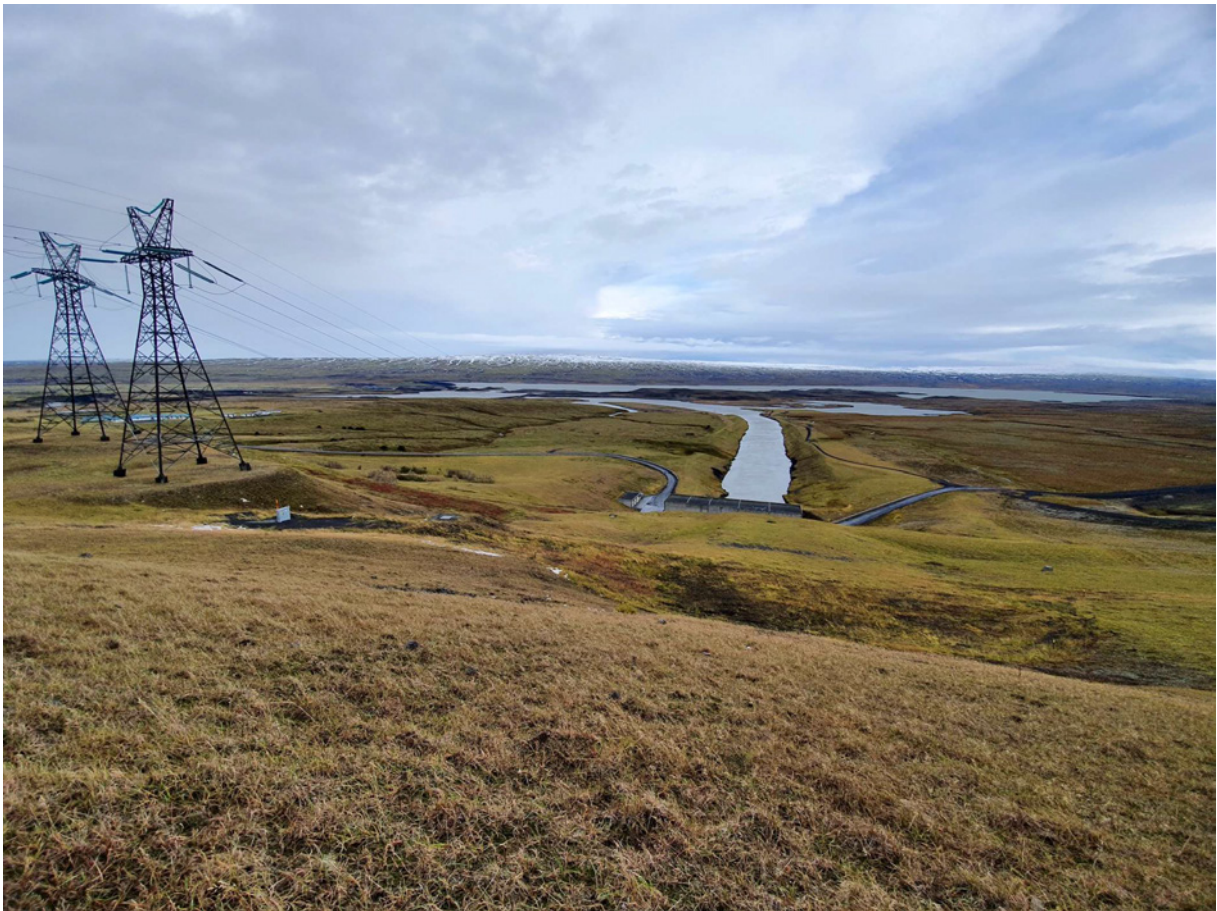
Nyrsti hluti úttektarsvæðis við Hrauneyjar, horfi til norðurs.

Hrauneyjafossstöð var reist á árunum 1977-1981 og er þriðja stærsta raforkuver landsins. Deiliskráningarsvæðið er um 4,3 km að lengd og breiðast tæpir 0,5 km, alls 83,3 ha að stærð. Norðurendi svæðisins er í Þóristungum, um 1,1 km norður af Hrauneyjarfossstöð, og liggur það til suðurs meðfram aðrennslisskurði frá Sporðöldulóni að Hrauneyjarfossstöð og áfram meðfram varnargarði sem afmarkar vesturhlið Hrauneyjarlóns.