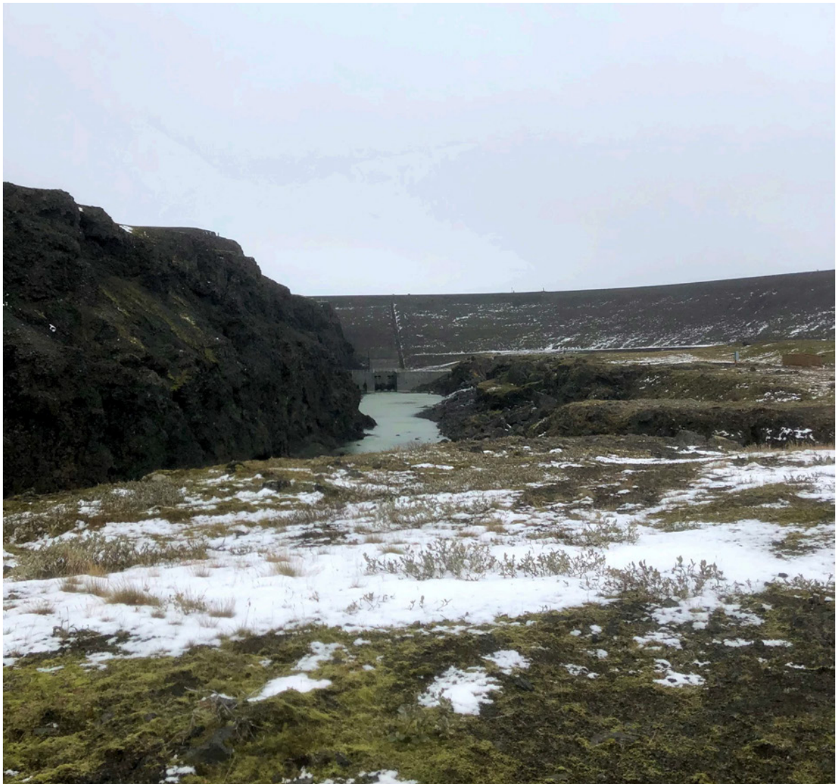
Suðurhluti úttektarsvæðis við Sigöldu, horft til norðausturs.

Sigöldustöð var reist á árunum 1973-77 og frárennisskurður tengir hana við Hrauneyjafosstöð. Deiliskráningarsvæðið er á milli Hrauneyjarlóns og Krókslóns. Það er rúmir 2,5 km á lengd og breiðast rúmir 1,1 km, alls 81,6 ha að stærð. Það liggur umhverfis Sigöldustöð og í suðvestur meðfram skurði í Krókslón en nær einnig yfir svæði við Tungnaá vestan við Krókslón sem afmarkað er með stíflum að sunnan og austan.