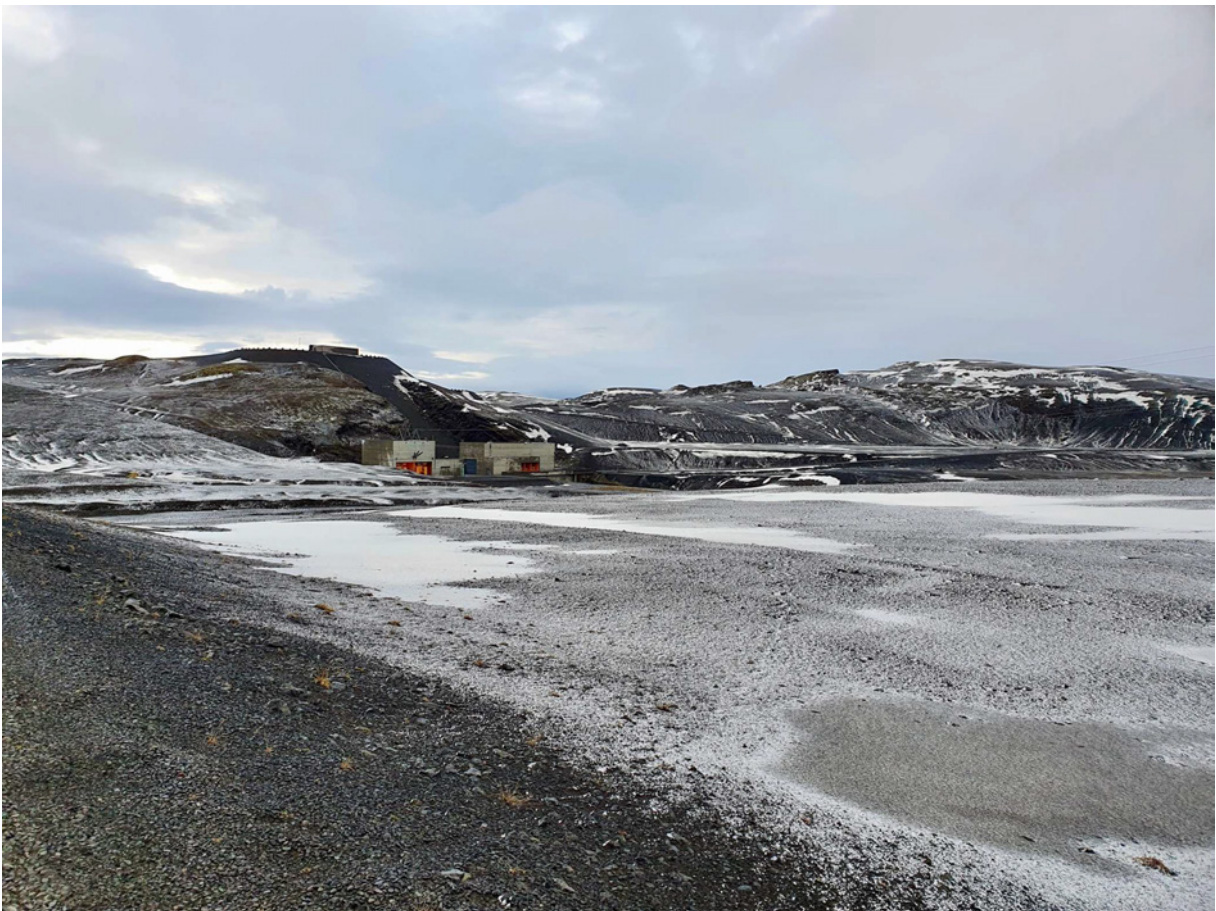
Vestasti hluti úttektarsvæðis við Vatnsfell, horft til suðurs.

Vatnsfellsstöð var reist á árunum 1999-2001 og nýtir fallið í veituskurði á milli Þórislóns og Krókslóns sem er uppistöðulón Sigöldustöðvar. Deiliskráningarsvæðið við Vatnsfell skiptist í tvennt. Annars vegar er um að ræða 29,2 ha svæði sem liggur fast vestan við Vatnsfellslón og umhverfis Vatnsfellsstöð. Það er um 1 km á lengd og 0,8 km á breidd. Hins vegar er 7 ha svæði, um 0,5 km langt og tæplega 0,3 km breitt, sem nær umhverfis mannvirki við Vatnsfellslón norðan við stöðina