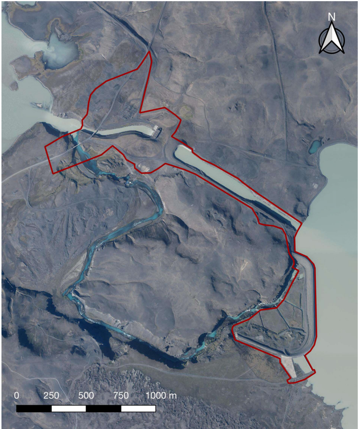
Úttekarsvæði við Sigöldu.