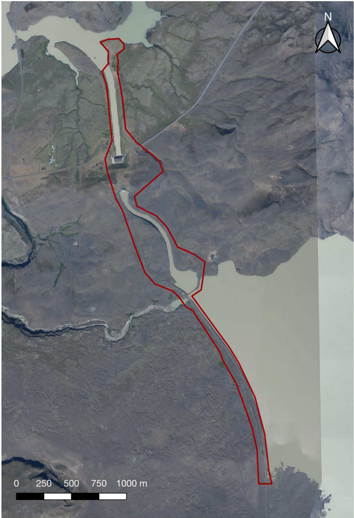
Úttektarsvæði við Hrauneyjafoss.