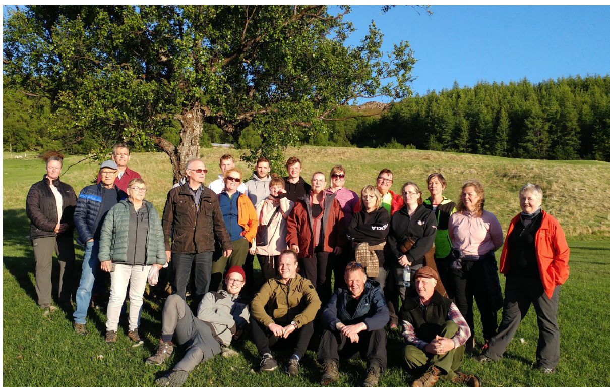
Kvöldganga í Ranaskógi.