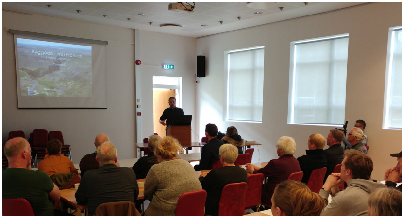
Kynningarfundur um byggðakjarna í Fljótsdal.

Samfélagsnefnd hefur formlega fundað átta sinnum á árinu, auk þess tekið þátt í tilfallandi verkefnum og fundum.