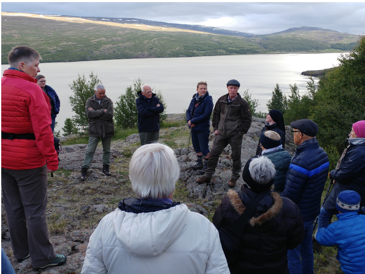
Skógarganga í Brekkugerði.

Fimmtudagskvöldgöngur. Verkefnastjóri skipulagði kvöldgöngur öll fimmtudagskvöld frá 18. júní til 20. ágúst, á svæði Upphéraðsklasans. Heimamenn tóku vel í verkefnið og tóku að sér fararstjórn. Lagt var af stað kl. 20:00 og gengið í 1 til 1,5 tíma. Um miðjan ágúst var lagt af stað kl. 19:30 þannig að göngu væri lokið fyrir myrkur. Að meðaltali tóku 17 þátt í hverri göngu og heildarfjöldi þátttakenda var 155 þetta sumar.