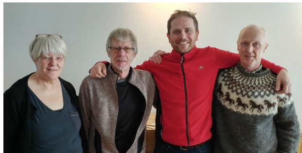
Samningsaðilar staðarvalsúttektarinnar.

„Við skipulag verði horft til þess að nýta landfræðilega eiginleika svæðisins og að aðlagja byggð að svæðinu. Hver og einn fái notið útsýnis eins og kostur er og sólar. Sérstök áhersla verði áfram á umhverfismál, sjálfbærni, vellíðan, félagslegt rými og miðlægan samfélagsgarð. Með þessum áherslum er verið að hugsa um sérstöðu kjarnans umfram annað þéttbýli.