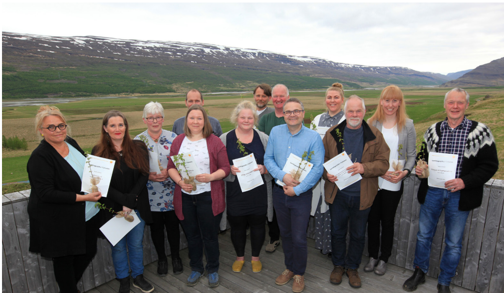
Fyrstu styrkþegar Samfélagssjóðs 2020.

Stefnt er að því að auglýsa eftir umsóknum í samfélagssjóðinn í upphafi hvers árs og að áherslur sjóðsins miðist við áhersluverkefni Samfélagsþings sem haldin verða að hausti. Líkt og fram hefur komið var þetta árið ekki hægt að halda Samfélagsþing með hefðbundnum hætti vegna samkomutakmarkana vegna Covid-19. Leitað var leiða til að bjóða öllum að leggja inn hugmyndir og tillögur í gegnum fésbókina og með tölvupósti. Einnig tók verkefnastjóri niður hugmyndir sem fóru manna á milli í umræðum eða á samfélagsmiðlum. Þannig var búinn áherslulisti verkefna fyrir árið 2021 sem kynntur var á sameiginlegum fundi Samfélagsnefndar og sveitarstjórnar í nóvember. Þar var sérstaklega horft til verkefna sem taka þurfti tillit til í fjárhagsáætlunargerð sveitarfélagsins fyrir næsta ár.