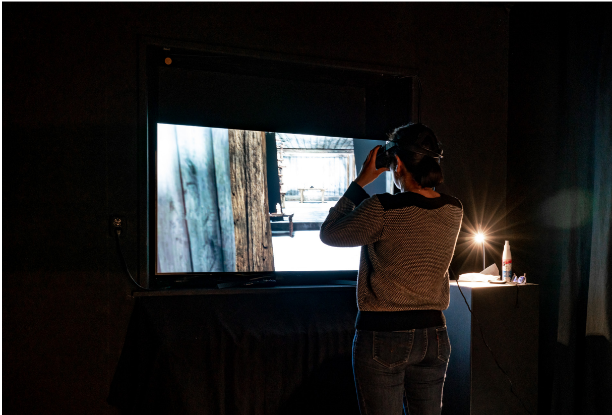
Á Skriðuklaustri er upplifun gesta aukin með nýtingu tæknilausna.

Áföngum hefur verið náð ekki síst með dugnaði frumkvöðla innan eftirfarandi fyrirtækja: Sauðagulls, en fyrirtækið var valið inn í viðskiptahraðalinn Til sjávar og sveita nú í haust. Óbyggðaseturs, er tók við rekstri Laugarfells sem styrkir enn frekar uppbyggingu ferðabjónustu fyrirtækisins á hálendinu. Gunnarsstofnunar með því að bæta upplifun fólks á minjum með því að nýta nýjar tæknilausnir í anda hugmyndafræði um „safn án veggja“, svokallað Cine verkefni (Connected Culture & Natural Heritage in the Northern Environment). Skógarafurða sem lagði enn frekari grunn að rekstrinum með föstum samningum og vörupróun. Með þessari upptalningu er aðeins verið að nefna þau fyrirtæki sem hafa dregið að sér mikla athygli án þess að gera lítið úr öðrum frumkvöðlum á svæðinu. Í því samhengi er vísað í yfirlit yfir styrkt verkefni Samfélagssjóðs Fljótsdals.