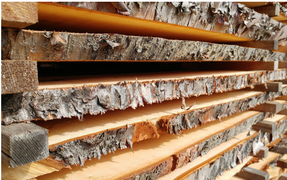
Fjölbreyttar afurðir eru unnar úr íslensku tímri í Fljótsdal, m.a. af Skógarafurðum.