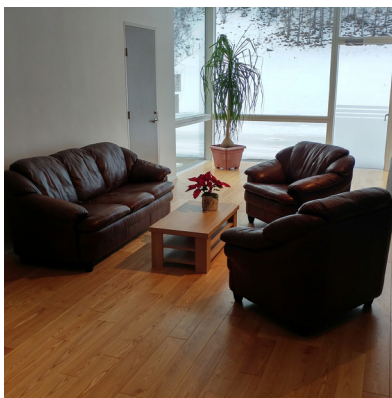
Notalegur setkrókur í Végarði og ávallt heitt á könnunni