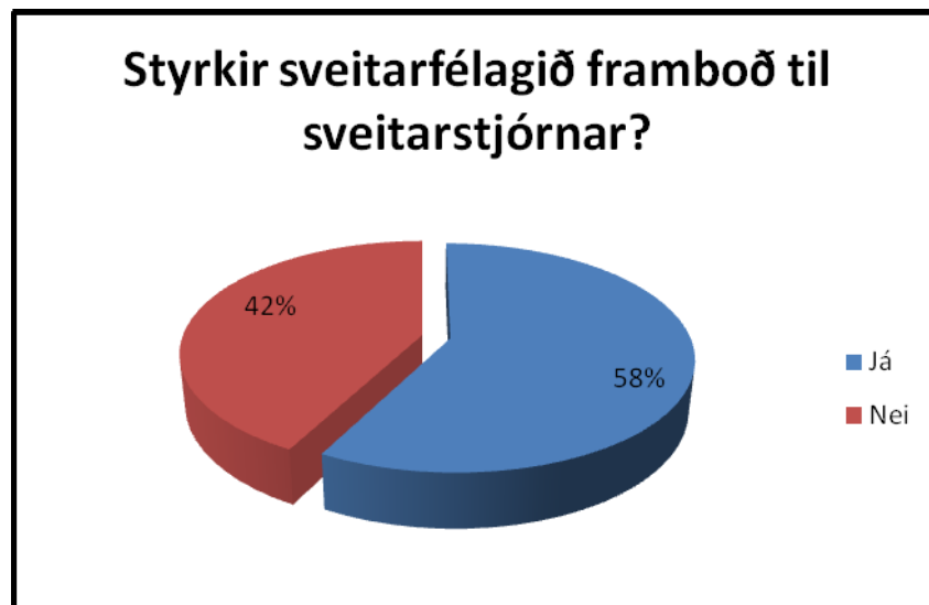
Mynd 1: Styrkir sveitarfélagið framboð til sveitarstjórnar?

Þau sveitarfélög sem svöruðu þessari spurningu neitandi sögðu einnig að það stæði ekki til að taka upp slíkt kerfi. Það á bæði við um þau sveitarfélög sem eru fámennari en 500 íbúar og þau sem hafa fleiri íbúa þrátt fyrir lagalega skyldu fjölmennari sveitarfélaganna til að styrkja stjórnálasamtök skv. 5 gr. laga nr. 162/2006.