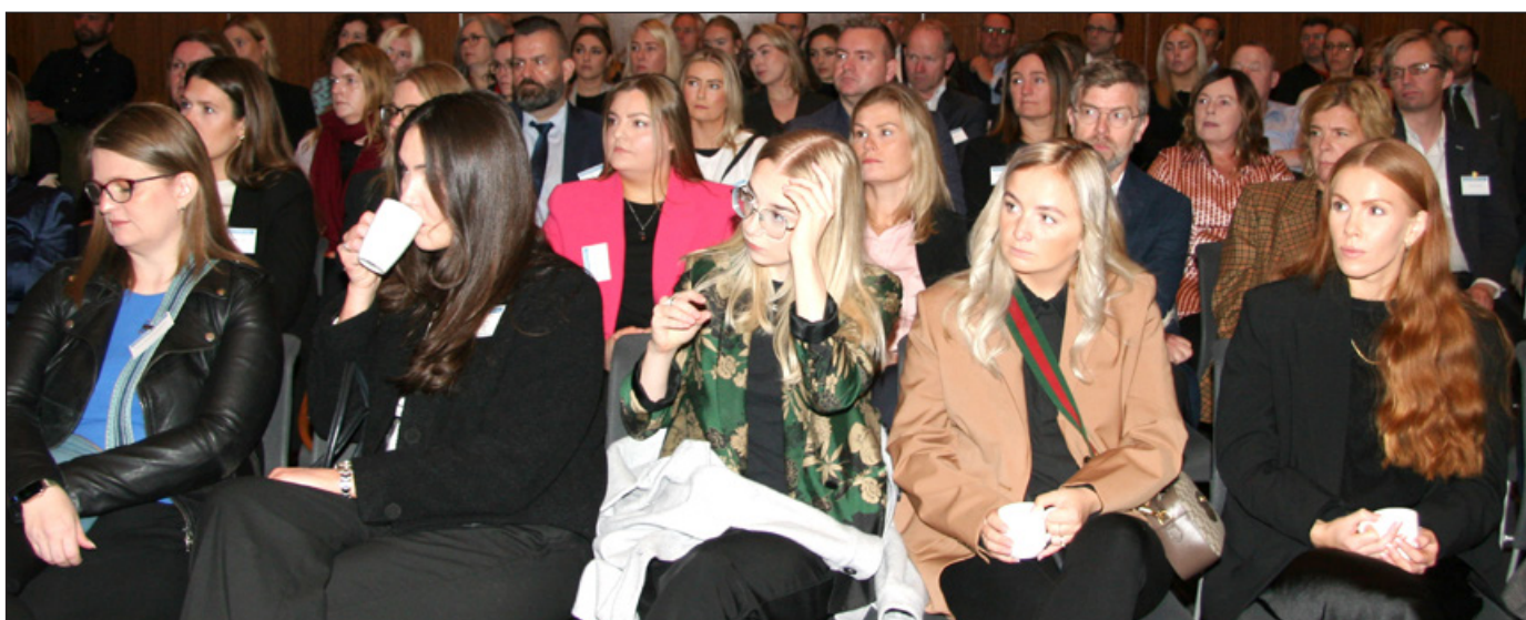
Mikill áhugi var á málstofum um opinber störf.

Ýmis lögfræðileg álitamál tengjast opinberum starfsmannarétti enda er starfsmannaréttur hins opinbera fræðigreinin sem reglulega reynir á í álitum Umboðsmanns Alþingis eða fyrir dómstólum.