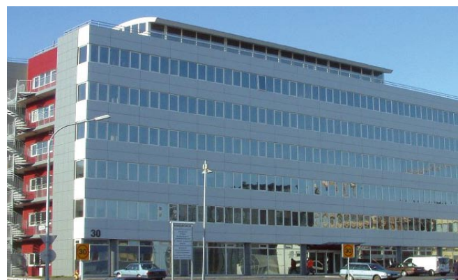
Skrifstofa Sambands íslenskra sveitarfélaga og samstarfsstofnana er á 5. hæð við Borgartún 30 í Reykjavík.

Starfsemi sambandsins er skipt upp í fimm svið, þ.e. hag-