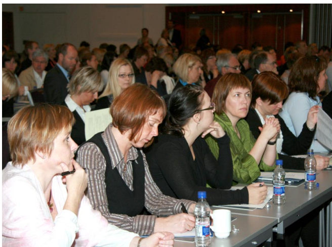
Frá ráðstefnu um flutning á málefnum fatlaðra sem haldin var í maí 2009.