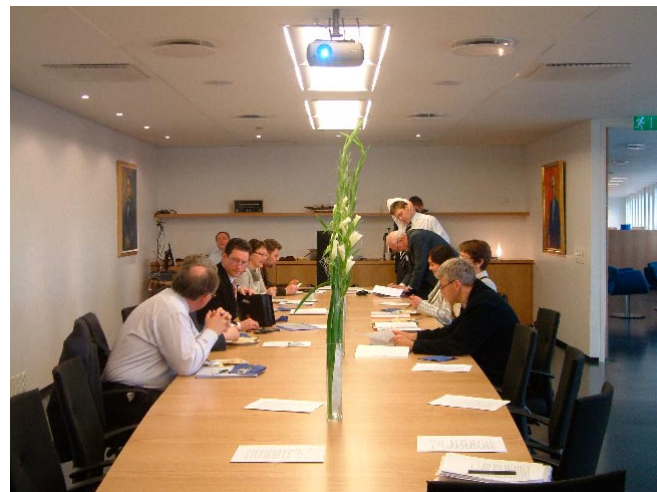
Fjógur fundarherbergi eru í húsnæði sambandsins. Myndin hér að ofan er úr Allsherjarbúð, sem er þeirra stærst, en þar fundar m.a. stjórn sambandsins.

Samkvæmt stefnumörkun landsþinga og stjórnar Sambands íslenskra sveitarfélaga eru starfandi fjórar fastanefndir á vegum sambandsins sem hafa það hlutverk að veita stjórn og starfsmönnum sambandsins ráðgjöf um ákveðna málaflokka sem sveitarfélögin sinna eða sambandið hefur á sinni könnu. Fastanefndirnar fjórar eru: