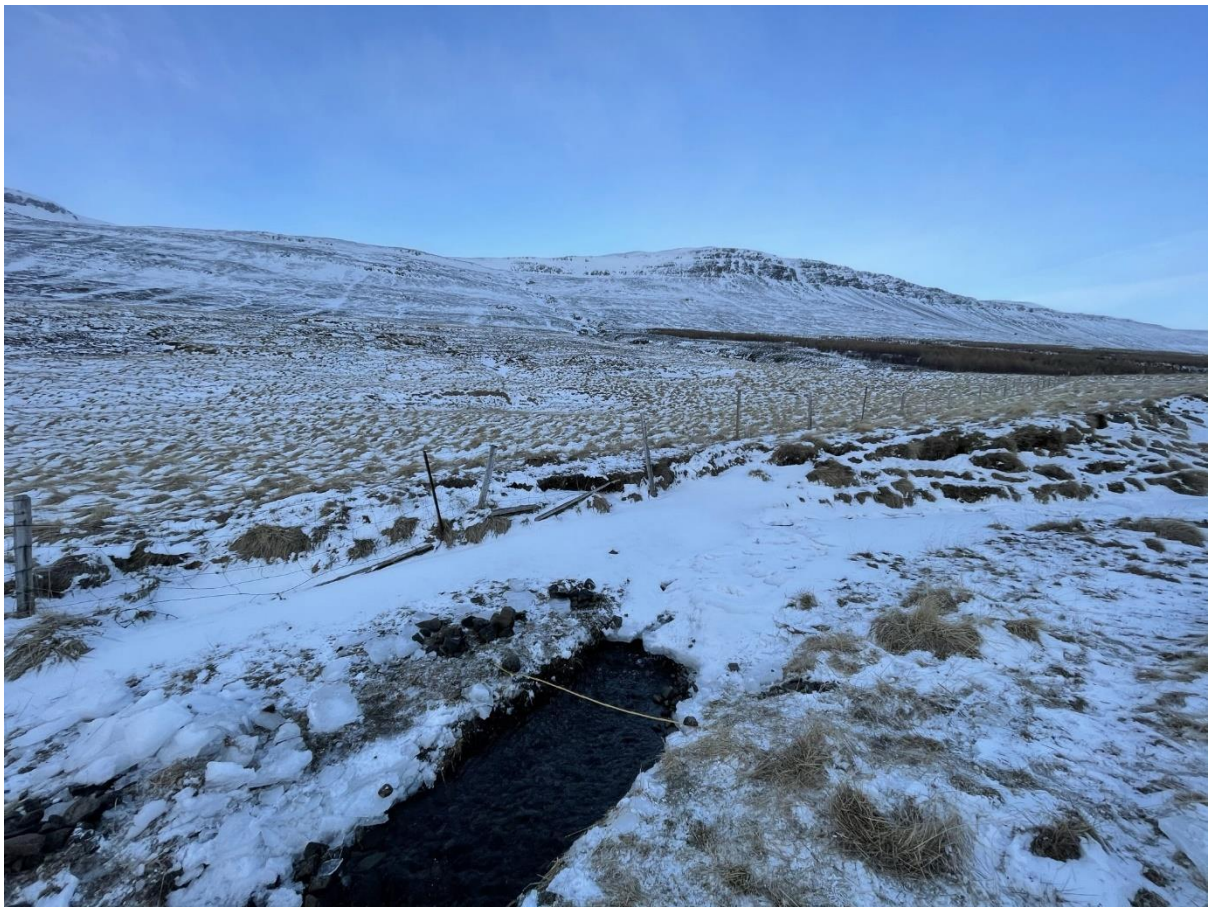
Mynd 2. Mælistaður í Gilá.

Þann 8. apríl 2021 var virkjunarsvæðið skoðað. Rennsli var mælt í Bakkalæk við veginn beint á mót Bakka. Á mynd 2 má sjá mælistað í Bakkalæk þar sem rennslið mældist um 15 l/s. Reiknað afrennsli samkvæmt mælingunni var meira en mátti búast við, nokkrar ástæður geta legið fyrir en sú helsta er að úrkoma var nokkrum dögum áður en mælingin var gerð. Mælt afrennsli var um 80% meira en það sem búast má við. Því var ákveðið að miða virkjað rennsli við mælt afrennsli. Tafla 1 sýnir nánar niðurstöður úr mælingu og helstu kennistærðir virkjunar.