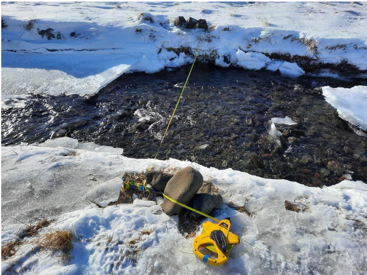
Mynd 2. Mælistaður í Stóralæk

Þann 10. apríl 2021 var virkjunarsvæðið skoðað. Rennsli var mælt 800 metrum frá hugsanlegu stíflustæði eða í 136 m y.s. Á mynd 2 má sjá mælistað Stóralæks þar sem rennslið mældist 97 l/s. Afrennsli mælingar var meira en mátti búast við, líklegast vegna þess að úrkoma var nokkrum dögum fyrir mælingu. Mælt afrennsli var um 180% meira en það sem búast má við. Því var ákveðið að miða virkjað rennsli við mælt afrennsli. Tafla 1 sýnir nánar niðurstöður úr mælingum og helstu kennistærðir virkjunar.