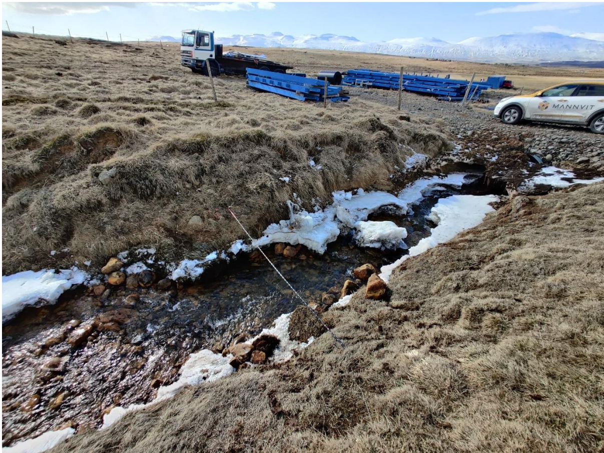
Mynd 2. Mælistaður í Bæjarlæk Dýrfinnustaða

Þann 9. apríl 2021 var virkjunarsvæðið skoðað. Rennsli var mælt 800 metrum vestan við Dýrfinnustaði. Á mynd 2 má sjá mælistað þar sem rennslið mældist um 44 l/s. Afrennsli mælingar var eins og mátti búast við. Því var ákveðið að miða virkjað rennsli við tvöfalt mælt lágafrennsli. Tafla 1 sýnir nánar niðurstöður úr mælingum ásamt helstu kennistærðir virkjunar.