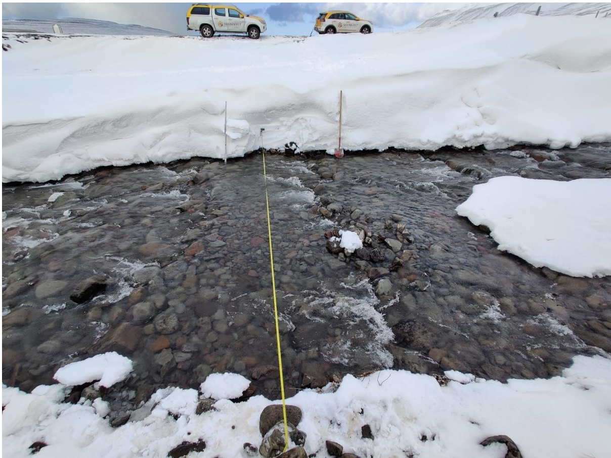
Mynd 2. Mælistaður í Skálá

Þann 9. apríl 2021 var virkjunarsvæðið skoðað. Rennsli var mælt við brúna yfir Skála á Sléttuhlíðarvegi. Á mynd 2 má sjá mælistaðinn þar sem rennslið mældist um 300 l/s. Afrennsli mælingar var meira en mátti búast við, líklega vegna úrkomu nokkrum dögum fyrir mælingu. Oft er lágrennslið í kring um 8 l/s/km 2 , en mælt afrennsli var um 250% meira en það sem búast má við. Því var ákveðið að miða virkjað rennsli við mælt afrennsli. Tafla 1 sýnir nánar niðurstöður úr mælingum ásamt helstu kennistærðir virkjunar.