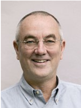
MYND 1 GUY CLAXTON.

Hugmyndafræðingur kenningarinnar um námskraftinn (learning power approach) er Guy Claxton (2018; 2002; Glaxton og Powell 2019), enskur sálfræðingur og menntunarfræðingur. Hugmyndafræðin er kynnt á heimasíðu samtakanna Building Learning Power (2022) og þangað er hægt að sækja ítarefni um námskraftinn bæði fyrir framhaldsskóla og grunnskóla.