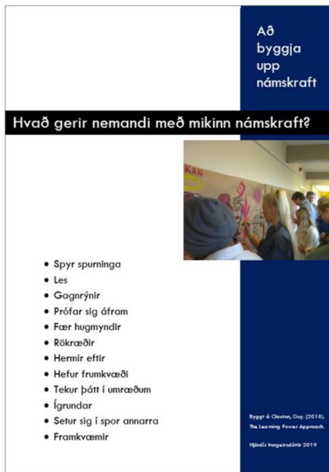
MYND 4-7 VEGGSPJÖLD UM NÁMSKRAFT NEMENDA.