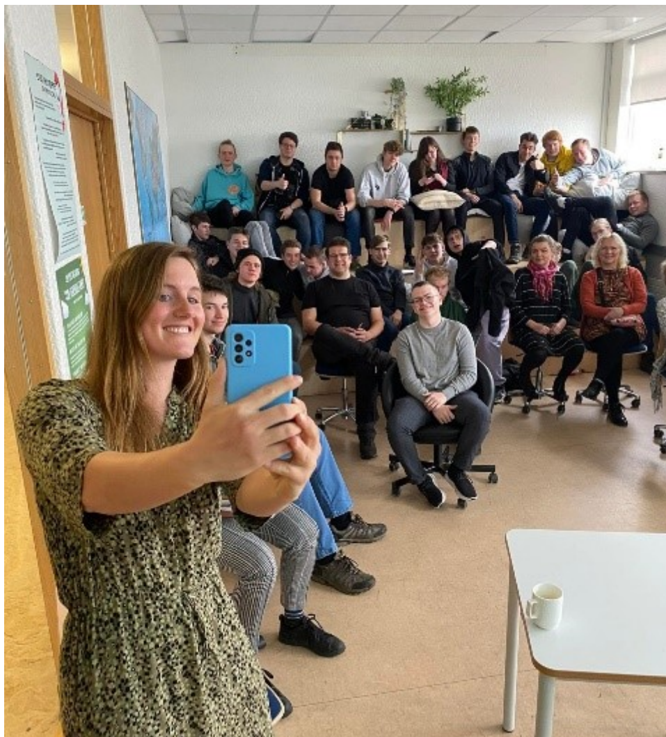
FRÁ VEL HEPPNAÐRI LOKAVERKEFNISSKYNNINGU.