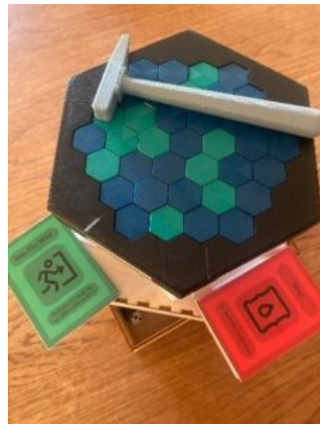
ÓLÍK VERKEFNI KALLA Á NÁMSMAT SEM STYÐUR VIÐ SKÖPUN OG FRUMKVÖÐLAHUGSUN.

Nemendur fá með þessu móti reglulega endurgjöf, í anda leiðsagnarnáms, allan námstímann til að miðla upplýsingum um efni, árangur og frammistöðu sem og að minna á námsmarkmiðin. Lögð er áhersla á að þessi endurgjöf sé jákvæð og uppbyggileg og til þess fallin að auka áhuga nemenda á viðfangsefninu og styrkja sjálfsmynd þeirra. Ekki má gleyma að nefna að í lokaverkefnum reynir mjög mikið á nemendur hvað varðar frumkvæði, hugmyndaauðgi, verkefnastjórn og hópvinnu og þetta eru þættir sem eru ávallt hluti af námsmatinu.