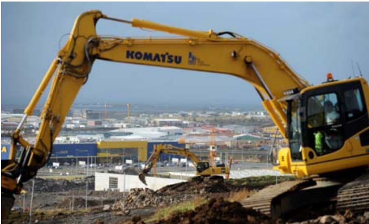
Nýskráningum vinnuvéla fjölgaði á árinu.

Er skemmst frá því að segja að í öllum 99 tilvikunum voru leiðbeiningar á íslensku ófullnægjandi eða þær skorti með öllu. Var dreifingaraðilum veittur frestur til að ráða bót á. Í tveimur tilvikum var markaðssetning véla bönnuð en auk þess að leiðbeiningar með vélunum væru ófullnægjandi voru vélarnar án viðeigandi merkinga og tilskilin gögn, þ.e. samræmisfirlýsingar, lágu ekki fyrir.