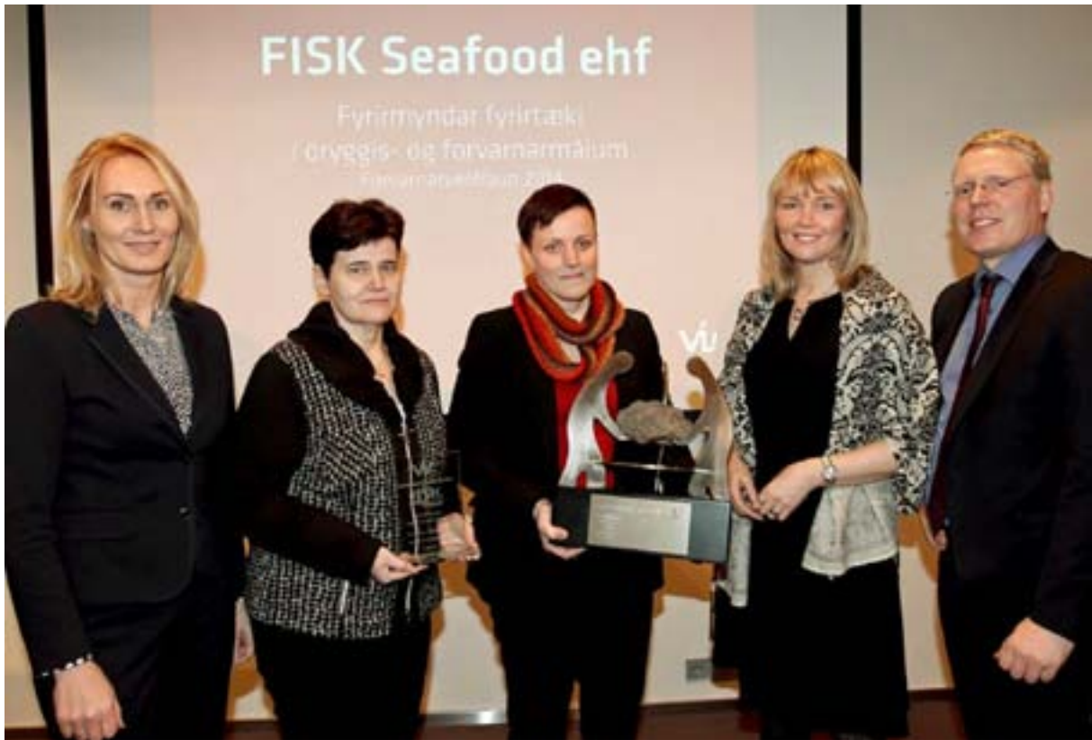
Myndin er frá verðlaunaafhendingunni þegar Fisk Seafood ehf fengu verðlaunin sem veitt voru í fimmta sinn.

Forvarnarverðlaunin eru veitt fyrir framúrskarandi og fyrirmyndar forvarnir. Þar er FISK Seafood ehf. í fremstu röð að mati viðskiptastjóra VÍS og forvarnaráðs. Fyrirtækið er gott dæmi um hve miklum árangri hægt er að ná í að efla forvarnir og öryggismál fyrirtækja þegar yfirstjórn sýnir þeim málaflokki raunverulegan og sýnilegan stuðning.