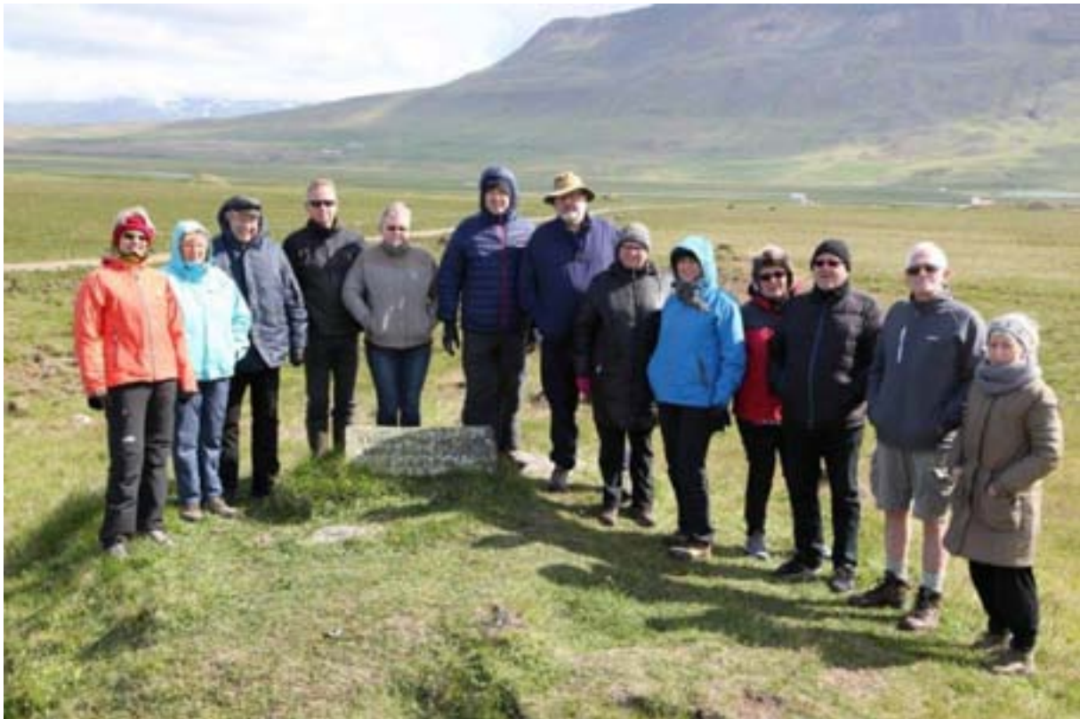
Nokkrir starfsmenn, bæði núverandi og fyrrverandi, ásamt mökum í árlegri jeppaferð Vinnueftirlitsins, en myndin er tekin á Vatnsnesi.

Starfsmenn Vinnueftirlitsins voru 63 í árslok 2014 en 64 árið áður. Unnin ársverk voru 65.6 á árinu 2014 en 66.7 í árslok 2013. Starfsmannavelta var 3,2% en 4.7% árið áður. 20 konur störfuðu hjá Vinnueftirlitinu í árslok 2014 og er það einni færri en 2013. 43 karlar störfuðu hjá stofnuninni í árslok 2014 og er það sami fjöldi og árið áður. Hlutfall eftirlitsmanna af heildarfjölda starfsmanna er 45% en var 43% árið áður. Hlutfall háskólamenntaðra er 41% af heild en var á fyrra ári 38%. Veikindadagar á hvern starfsmann voru 5,52 á árinu en 4,8 á hvern starfsmann vegna langtímaveikinda. Til samanburðar voru árið 2013 skráðir veikindadagar á hvern starfsmann 6,4 en 6,0 dagar voru vegna langtímaveikinda.