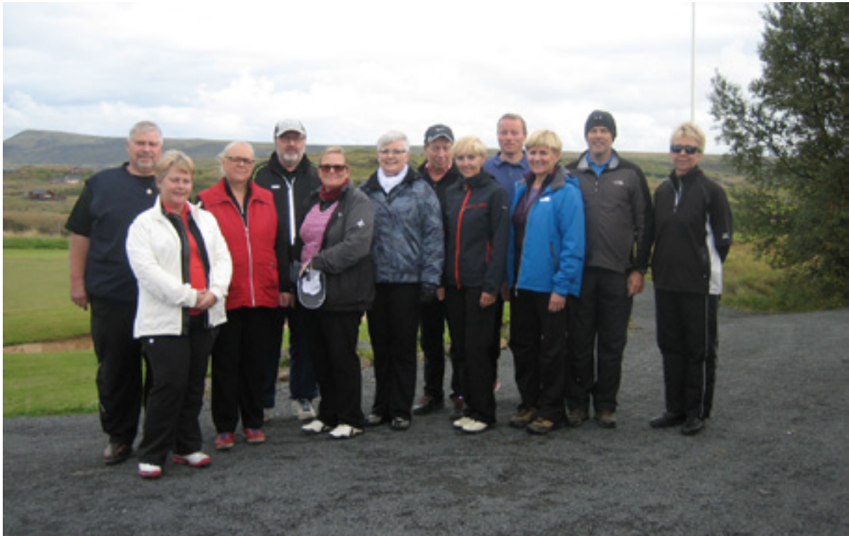
Hjá Vinnueftirlitinu er starfsræktur golfklúbburinn Golver. Á myndinni er hópur sem var að leggja af stað í spilamennsku á Kiðjabergsvelli í Grímsnesi.