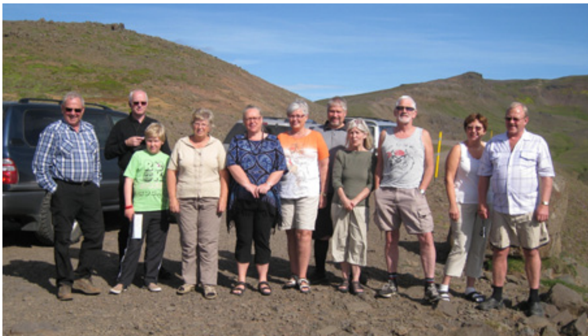
Starfsmenn Vinnueftirlitsins í árlegri ferð sinni um landið, tekið á Fljótsdalshéraði 2012