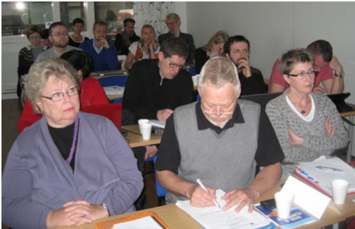
Myndin er tekin af námskeiði fyrir þjónustuaðila sem haldið var á árinu en 34 sóttu námskeiðið.

Þegar litið er á alvarleika þessara tilkynninga eftir atvinnugreinum þá sést stöðug fækkun beinbrota í byggingargeiranum. Þetta er þrátt fyrir að umsýsla hefur ekki minnkað á sl. fimm árum í geiranum. Í fiskiðnaði er ekki þessi þróun en á árinu beinbrotnuðu fleiri í þeim geira en áður. Þykir þetta benda til þess að fjölgun tilkynninga í fiskvinnslu megi þar af þ.a.l rekja til fleiri slysa. Síðustu tvö árin í opinberri stjórnarsýslu eru með því hæsta sem hefur gerst og undirstrikar það sem áður hefur verið sagt. Þá er fjöldi beinbrota í störfum sem falla undir opinbera þjónustu áfram viðvarandi há.