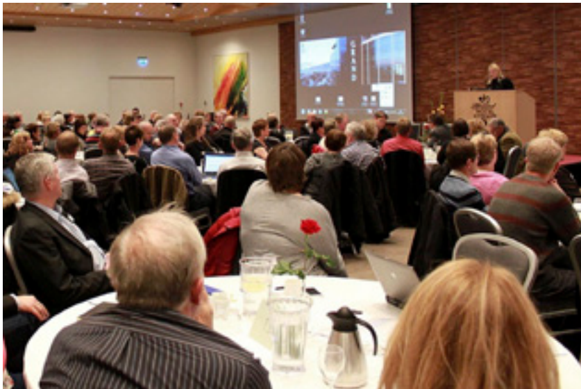
Eygló Harðardóttir félags- og húsnæðismálaráðherra ávarpar ráðstefnuna.

Að inngangserindum loknum hófst vinna við stefnumótunina í 18 vinnuhópum og fór þar fram markviss og lífleg umræða um hugmyndir til stefnumótunarinnar.