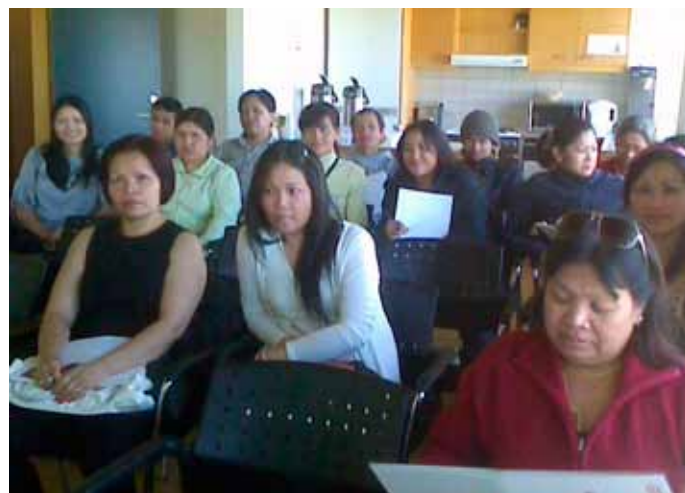
Myndin er tekin á vinnuverndarnámskeiði fyrir fiskvinnslufólk í Grindavík

Námskeið um vinnuverndarstarf í fiskvinnslufyrirtækjum eru í boði um land allt en þar er farið yfir helstu málaflokka vinnuverndar sem tengjast fiskvinnslufyrirtækjum svo sem almennt vinnuverndarstarf, vinnuslys, persónuhlífar, umgengni við vélar og tæki, hávaða og lýsingu, efni og efnanotkun, líkamsbeitingu, nýliðafræðslu, vinnu í kulda og margt fleira.