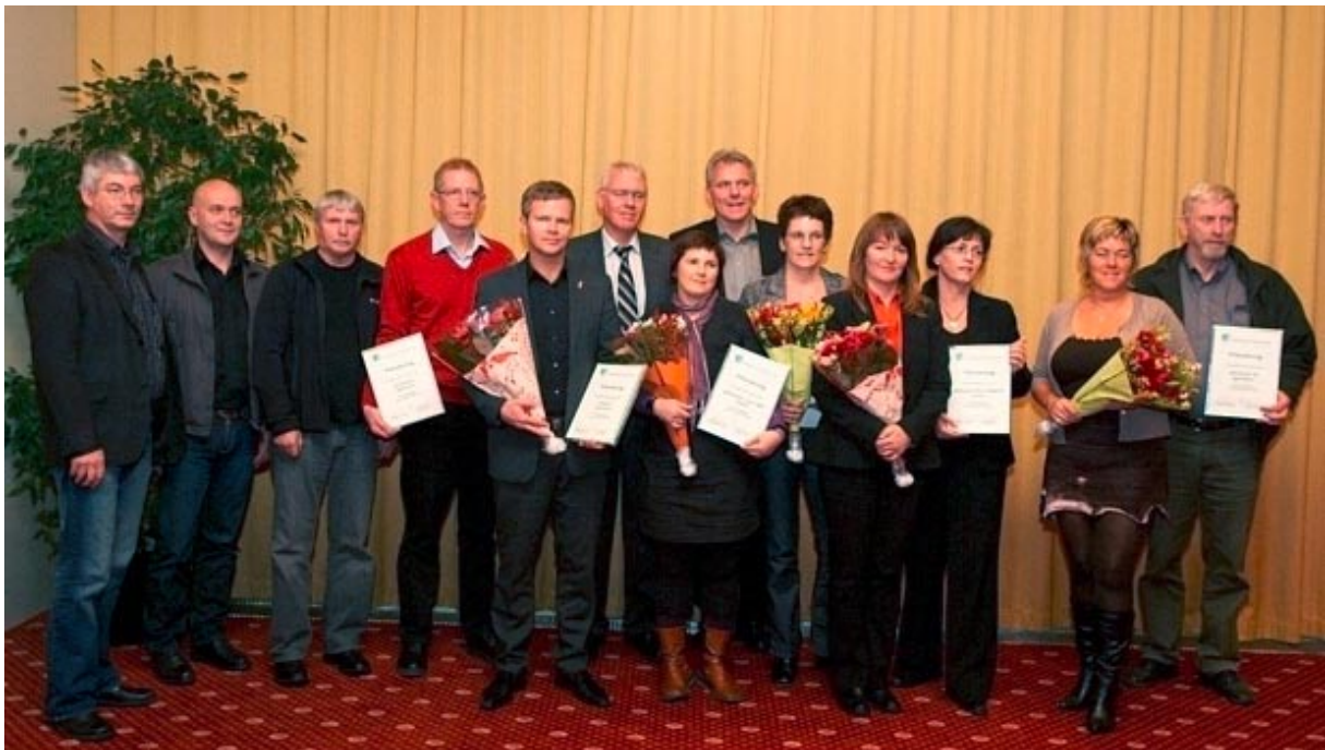
Fulltrúar fyrirmyndarfyrirtækja í vinnuvernd.

Ráðstefnan Bætt vinnuumhverfi – betra líf, áhættumat og forvarnir eru leiðin var haldin á Grand hóteli 21. október. Staðgengill Jóhönnu Sigurðardóttir félagsmálaráðherra, Hrannar B. Arnarsson, setti ráðstefnuna. Fyrirlesarar á ráðstefnunni voru sex talsins og var leitast við að hafa dagskrána sem fjölbreyttasta og þannig að hún tengdist áhættumati á vinnustöðum á sem víðtækastan hátt.