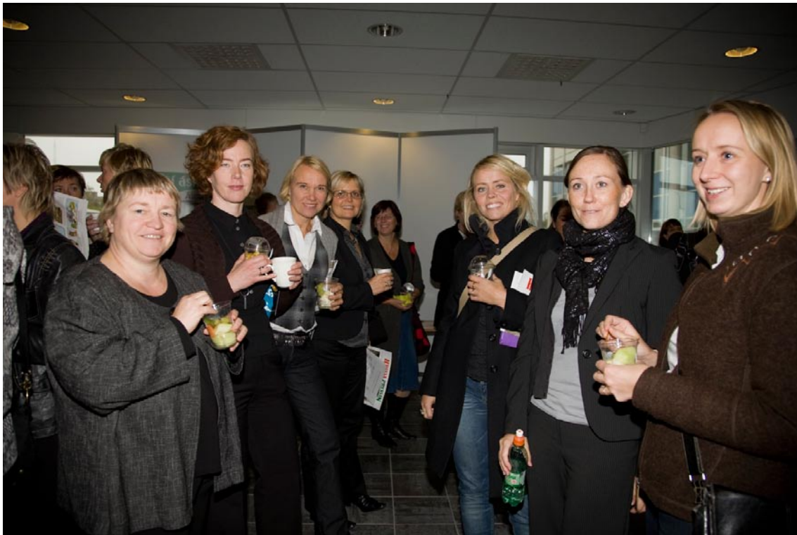
Ráðstefnugestir gæða sér á hollri hressingu milli fyrirlestra.

Ráðstefna um heilsueflingu á vinnustöðum var haldin þann 18. september 2008 í tengslum við verkefni Heil og sæl í vinnunni og Healthy Together . Vinnueftirlitið stóð að ráðstefnunni í samvinnu við Lýðheilsustöð og Háskólann í Reykjavík og var hún haldin í húsakynnum síðastnefndu stofnunarinnar. Áætlað er að 160–170 manns hafi sótt hana. Á ráðstefnunni voru flutt fjölmörg erindi þar sem sjónum var beint að ávinningi heilsueflingar á vinnustöðum í dag, m.a. út frá hagfræðilegum og samfélagslegum áhrifum ásamt því hvernig auka megi þekkingu á þessu sviði. Fyrir hádegi fluttu erlendir sérfræðingar erindi um málefni ráðstefnunnar. Eftir hádegi var fjallað um heilsueflingu á íslenskum vinnustöðum, ávörp flutt og haldin var vinnustofa með þátttöku ráðstefnugesta. Ráðstefnunni lauk með pallborðsumræðum.