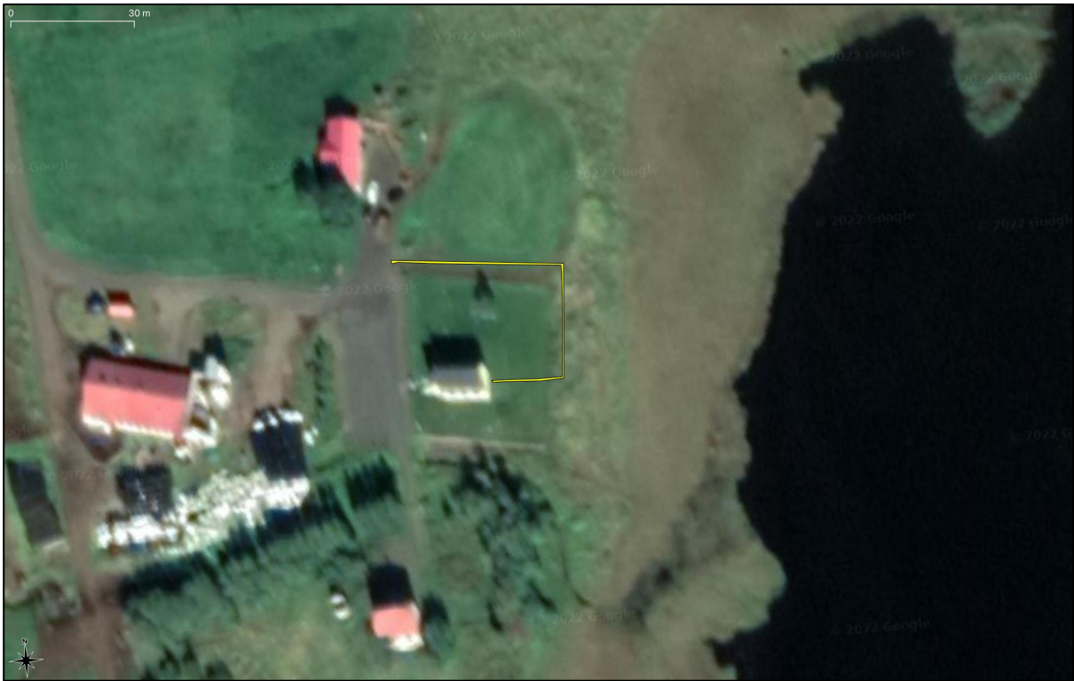
Mynd 4. Handgrafni skurðurinn austan og norðan við kirkjuna að Hjaltastað er hér merktur inn með gulu.