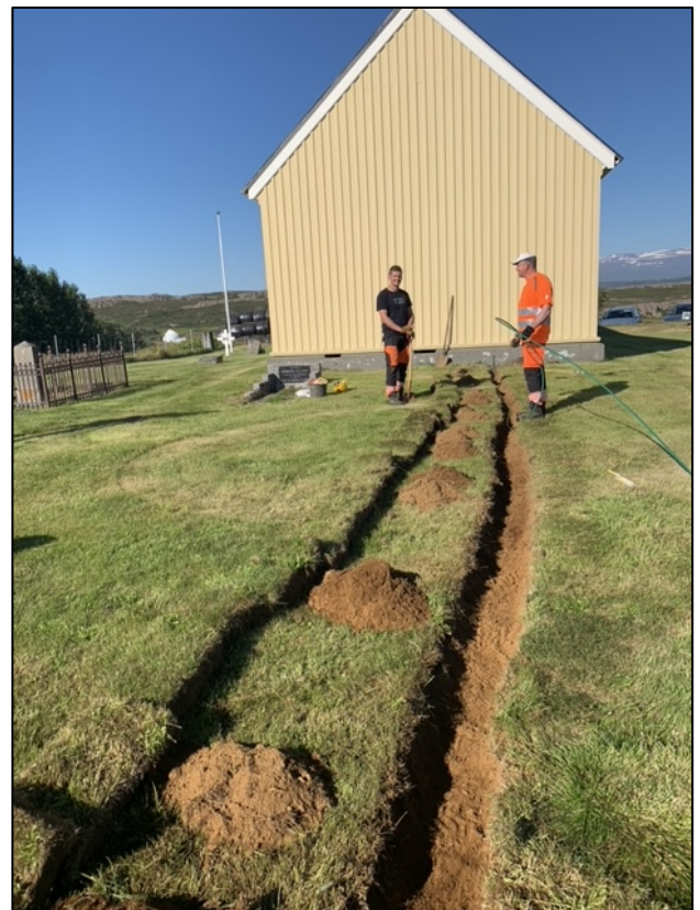
Mynd 3. Horft til vesturs yfir handgröfnu rásina hjá Hjaltastaðakirkju.

Skurðurinn var mældur inn í Isnet og mæligögnum verður skilað til Minjastofnunar Íslands. Það er þó ákvörðun Minjastofnunar Íslands með hvaða hætti varðveislu eða frekari rannsóknum skuli vera háttað.