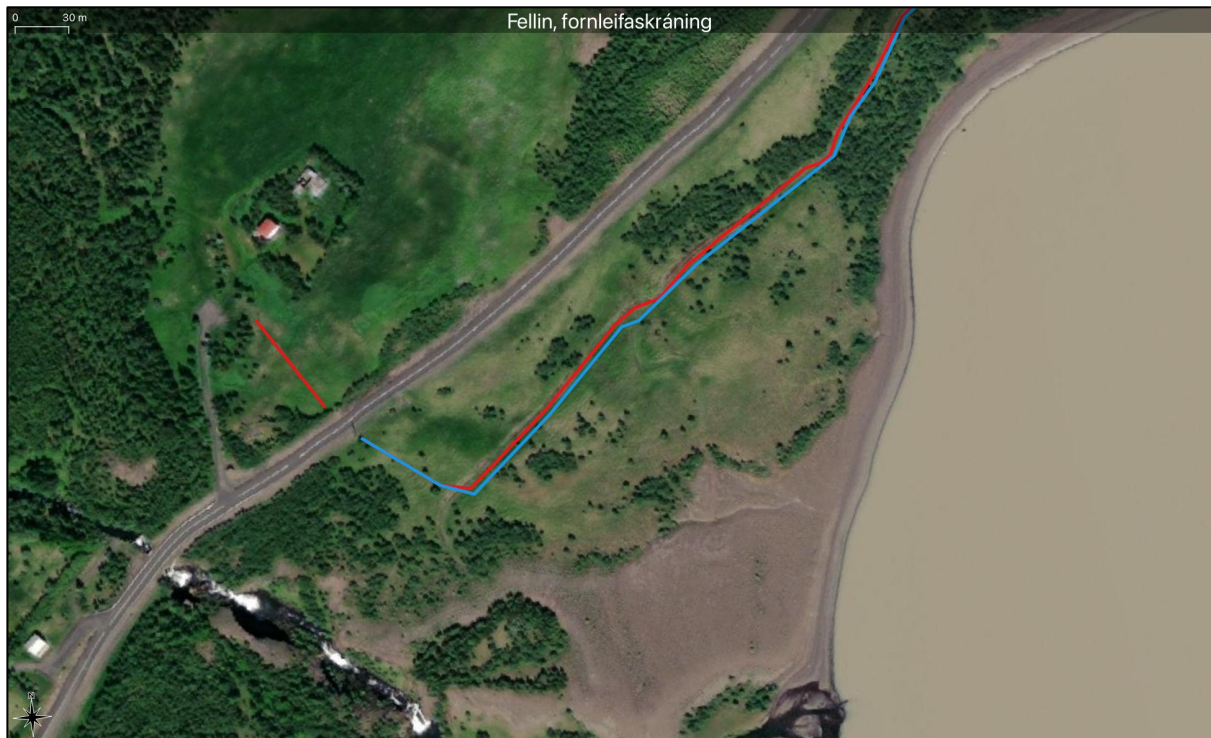
Mynd 2. Breytingar á leið hjá Hrafnsgerði sýndar með rauðu.