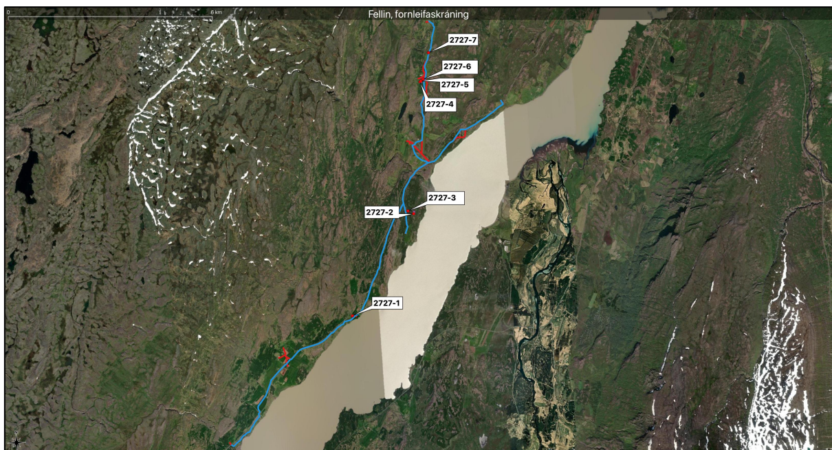
Mynd 1. Yfirlitskort yfir lagnaleið í Fellum, Múlaþingi og þeim minjum sem mældar voru upp nálægt lagnaleiðinni í fornleifaskráningu árið 2022. Fyrri línulögn er sýnd með bláu og breytingar með rauðu. Uppmældar minjar sýndar með númerum 2727-1 til 2727-7.

The Cultural Heritage Agency of Iceland will decide on a sufficient preservation of the archaeological remains, according to the Icelandic Heritage Law Nr. 80/2012.