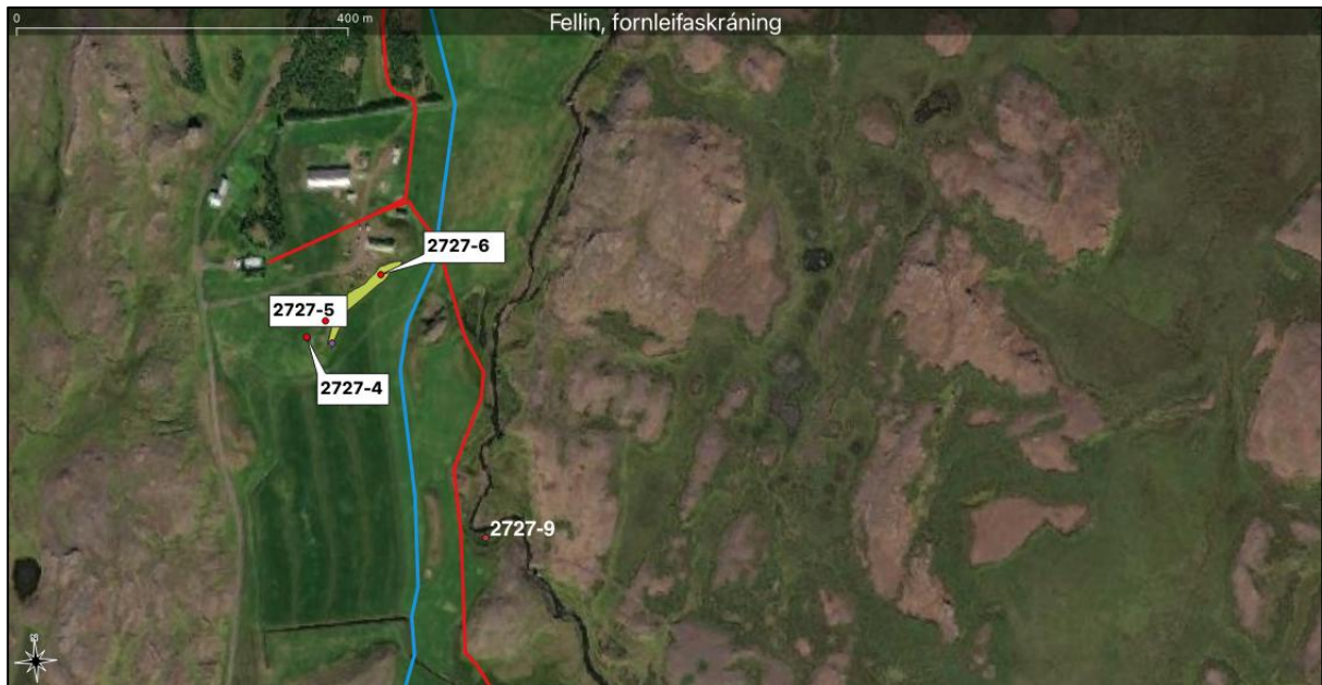
Mynd 6. Fornleifar að Refsmýri sem voru mældar upp í fyrri fornleifaskráningu árið 2022 eru hér sýndar með grænu polygoni og rauðum punktum. Einnig er náttthagi 2727-9 merktur inn á myndina. Eldri tillaga að línulögn er sýnd með bláu og endanleg línulögn sýnd með rauðu.