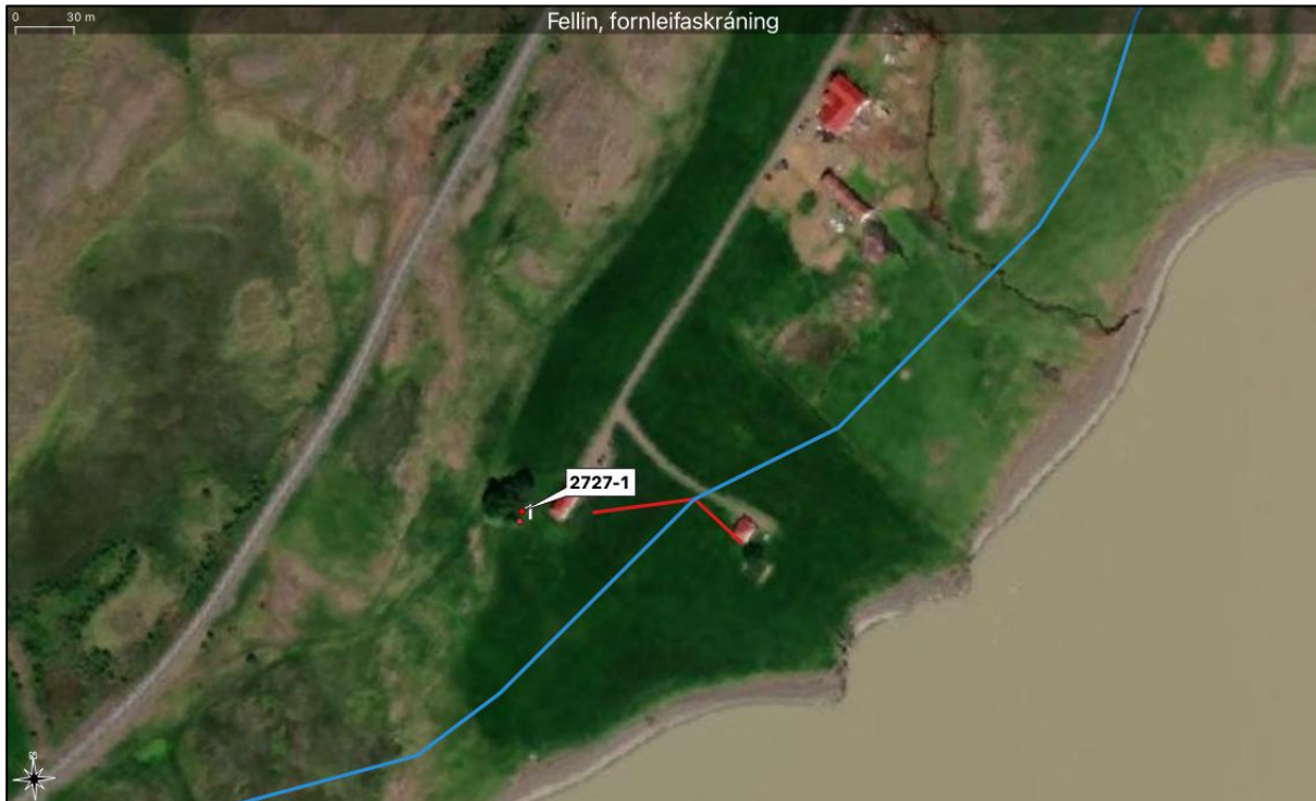
Mynd 4. Breytingarnar á línulögn sýndar með rauðu hjá Hofi og eldri línulögn með bláu.

Ekki er hægt að sjá við skoðun á heimildum, loftmyndum og á vettvangi að minjum verði raskað við lagningu línulagnarinnar.