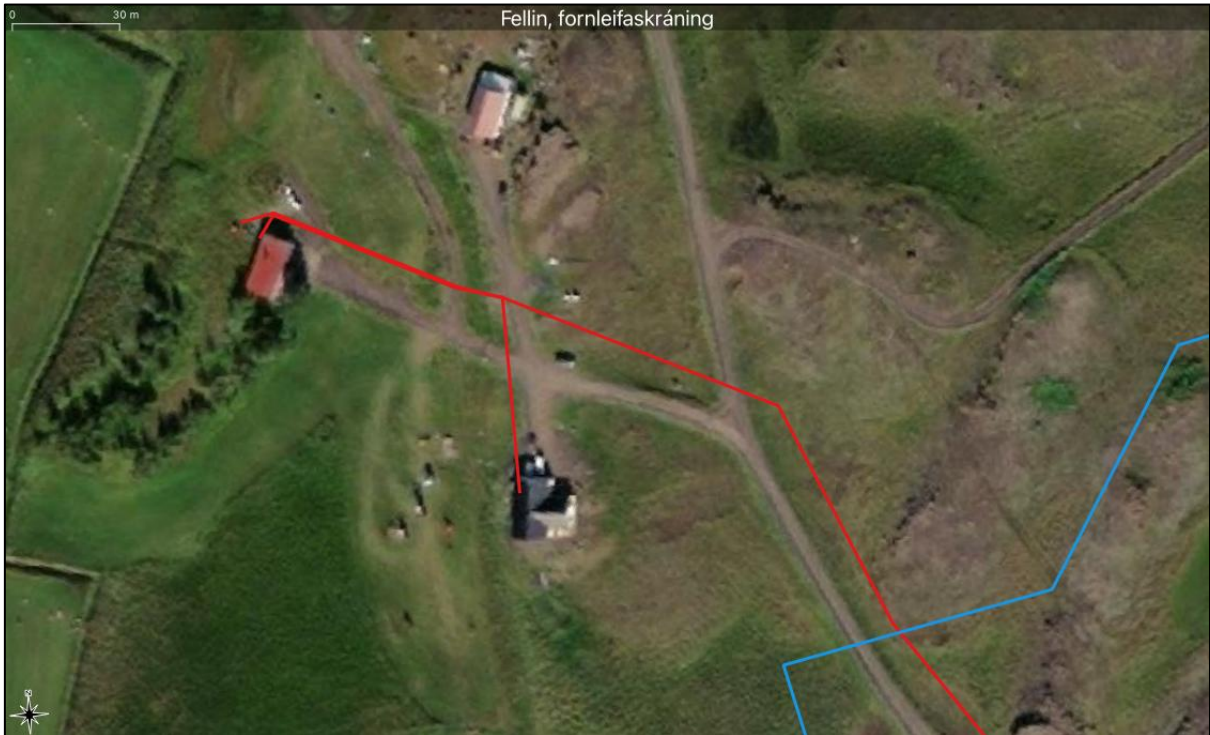
Mynd 5. Breytingarnar á línulögn sýndar með rauðu hjá Ormarsstöðum og eldri línulögn með bláu.