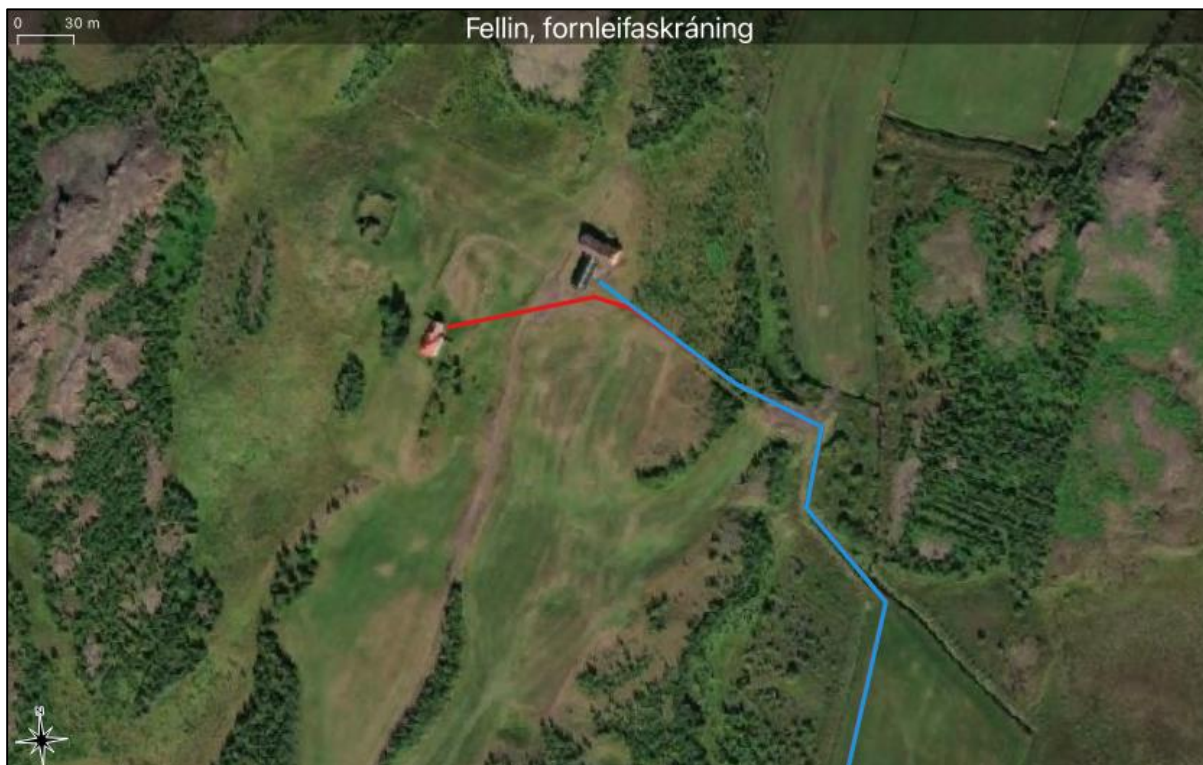
Mynd 8. Breytingar á leið hjá Miðhúsasel sýnd með rauðu og fyrri tillaga að línulögn með bláu.