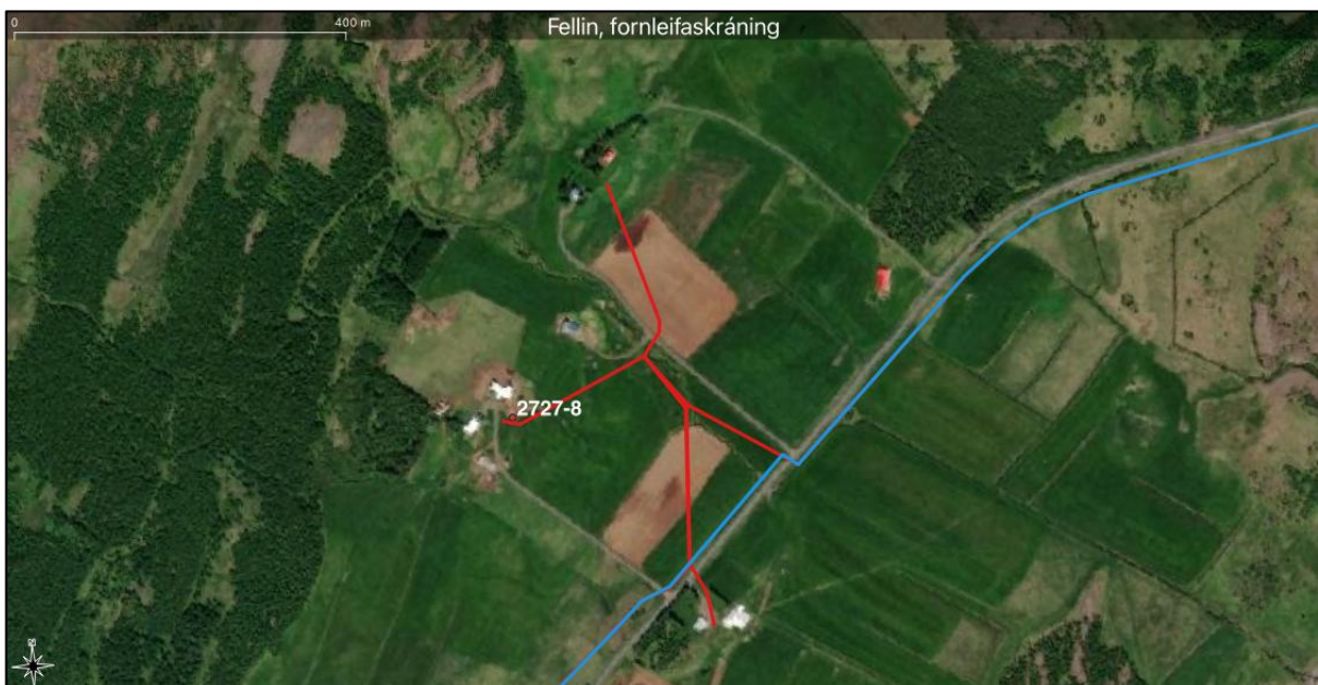
Mynd 3. Breytingarnar á línulögn sýndar með rauðu hjá Sólbrekku (austan við veg), Holti og Skeggjastöðum (vestan við veg). 2727-8 (Pálshús) merkt inn á myndina.

Ekki er hægt að sjá við skoðun á heimildum, loftmyndum og á vettvangi að minjum verði raskað við lagningu línulagnarinnar.