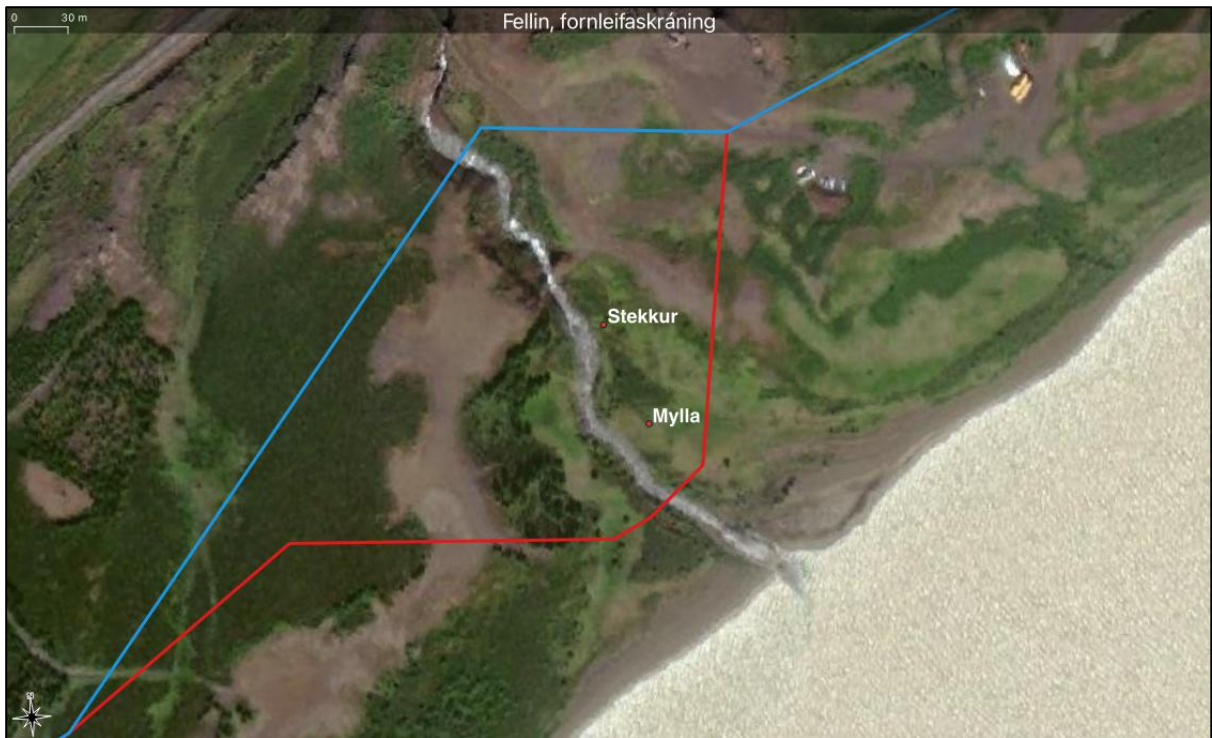
Mynd 9. Breyting á strengleið sýnd með rauðu og eldri tillaga með bláu.