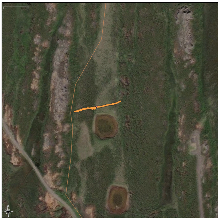
Mynd 2. Uppmældur garður 2416-22 (NM-207:012) og fjarlægð við línulögn ljósleiðara.

Plægingarleið ljósleiðara var færð og er hún nú í um 3,4 m fjarlægð vestan við minjar 2416-22. Lagt er til að minjarnar verði merktar á vettvangi.