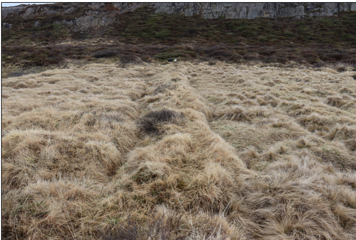
Mynd 3. Garður 2416-22. Horft til vesturs.