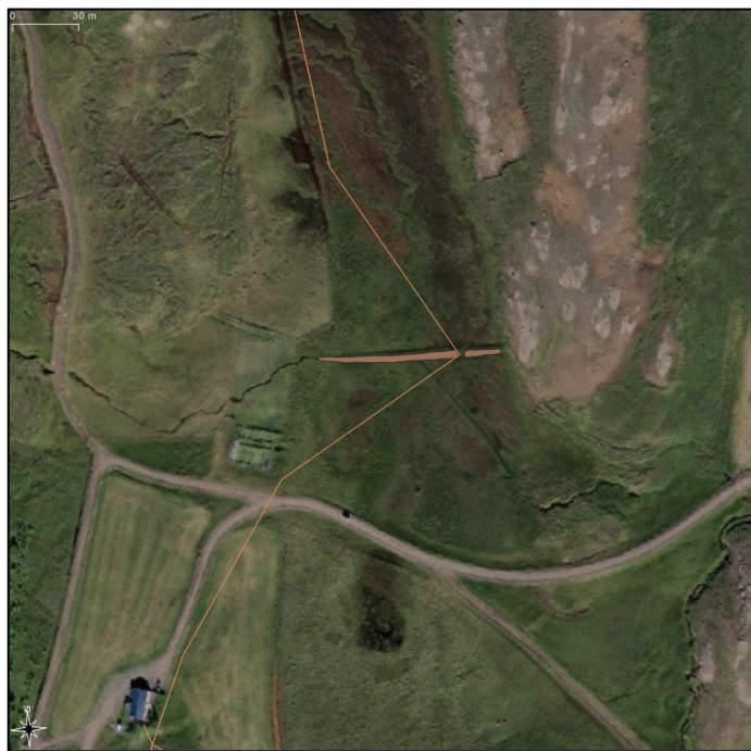
Mynd 4. Garður 2557-24 er rofinn til austurs.

Í töflu 1 er að finna lista yfir niðurstöðu fornleifaskráningarinnar. Vegna breytinga á leið hjá Skóghlíð í Hróarstungu voru einar minjar mældar upp á vettvangi í nálægð við línulögn ljósleiðara. Lagt er til að lína ljósleiðara verði lögð í þegar rofið svæði garðsins. Það telst nægileg mótvægisáðgerð að mæla upp og staðsetja friðuðu minjarnar og