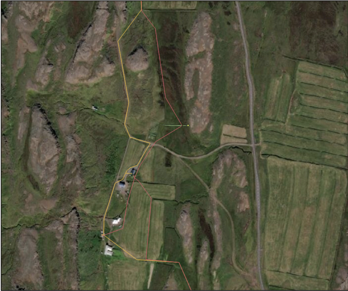
Mynd 3. Fyrri tillögur að lagnaleið hjá Skóghlíð sýndar með gulu, ný lagnaleið með bleiku og garður 2557-24 sést sem græn uppmæling.