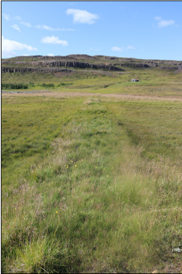
Mynd 2. Horft til austurs yfir vörslugarðinn að Skóghlíð, nr. 2557-24.