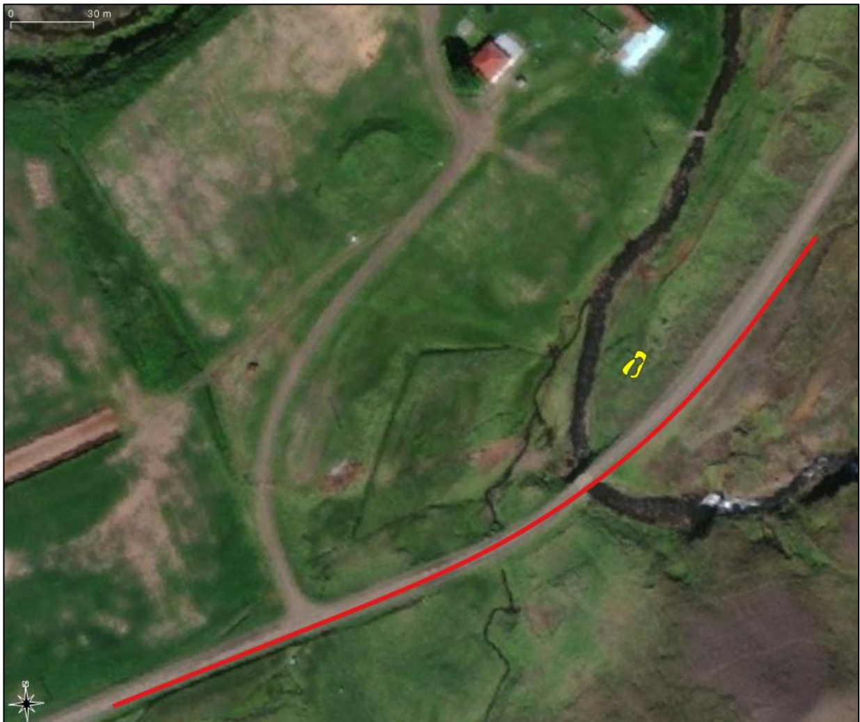
Mynd 2. Uppmældar minjar við Garðsá sýnd með gulu og veglína með rauðu.

Fornleifar 2725-1 eru í um 20 m fjarlægð norðvestur af miðlínu framkvæmdasvæðisins. Minjarnar eru því innan framkvæmdasvæðisins vegna vegagerðarinnar.