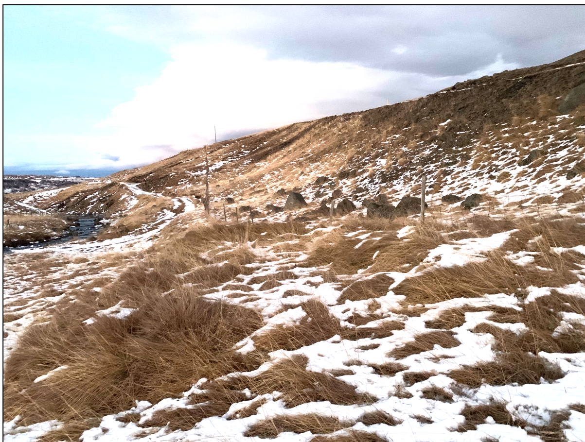
Mynd 2. Uppmældar fornleifar við Garðsá og bæinn Gil.

Í Droplaugarsonar sögu er elsta heimildin um Gil. Þar var Þorgrímur, faðir Droplaugar móður Helga og Gríms sagður hafa búið. Skráðar hafa verið 34 minjar að Giljum (NM-123). Hvammssel (NM-123:002) er eyðibýli stutt utan við Hvammsá og eru heimildir um að þar hafi verið tóftir af litlum bæjarþorpi. Þar út og upp af, í Kinn, fannst spjót (NM:123:003) í moldarbarði og var sent Þjóðminjasafni. Merkar minjar að Giljum er til að mynda 2558-7 (fundarstaðir kumla NM-123:004 og NM-123:005), en undir núverandi íbúðarhúsi fannst beinahrasl og hellur í kring. Í Sveitum og jörðum segir að enn sjáist móta fyrir vörslugörðum (NM-123:007, NM-123:008) á nokkrum stöðum og ummerkjum vatnsveitinga við læki. Einnig er myllutóft sögð við Garðá. 1