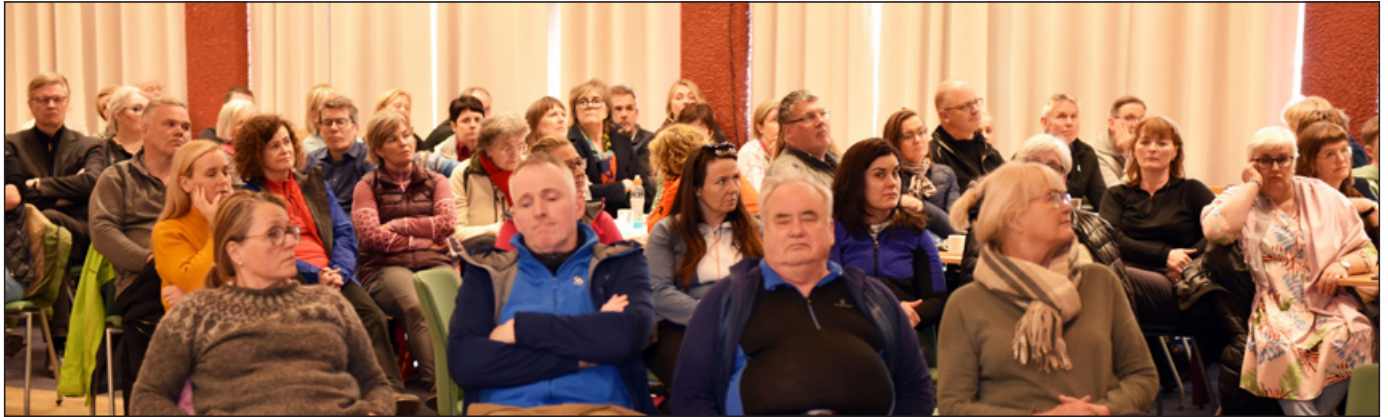
Um 120 manns sóttu fundinn í félagsheimilinu á Patreksfirði en auk þátttakenda í ferðinni bauðst Patreksfirðingum að koma gegn vægu gjaldi.