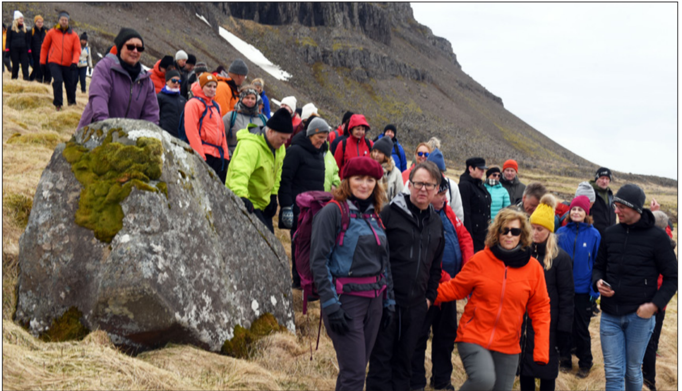
Hluti þátttakenda við steininn þar sem talið er að Guðrún Egilsdóttir hafi verið kæfð af Bjarna og Steinunni.