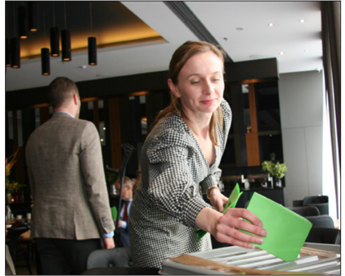
Kosin var milli þriggja frambjóðenda um tvö sæti varamanna í stjórn.