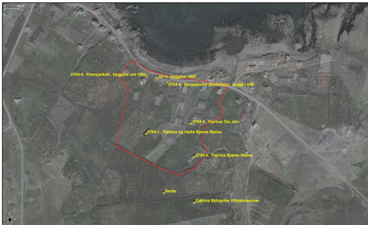
Mynd 9. Yfirlitsmynd yfir minjar sem skoðaðar voru á svæðinu.

Útihús Bjarna Steins nr. 2754-1 (rústir standa enn) og nr. 2754-2 teljast ekki minjar skv. skilningi laga nr. 80/2012 þar sem talið er að þær byggingar hafi verið reistar rétt fyrir 1940. Minjarnar voru mældar upp eða hnitsettar og ljósmyndaðar sem teljast fullnægjandi mótvægisáðgerðir á þessu stigi málsins til að hægt verði að gæta að varðveislu minjanna við áframhaldandi vinnu við deiliskipulag. Niðurstaða fornleifaskráningarinnar er því sú að nægjanleg varðveisla teljist vera að skrá heimildir um húsinn á deiliskipulagssvæðunum sem um getur hér að framan. Það er þó ákvörðun Minjastofnunar Íslands með hvaða hætti varðveislu eða frekari rannsóknum skuli vera háttað.