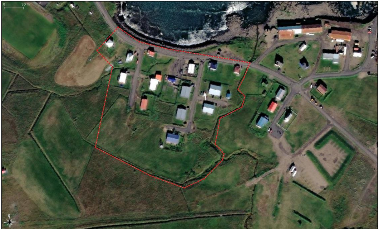
Mynd 1. Deiliskipulagssvæðið að Borgarfirði eystra.

Víkurnes 1 og 2, Dagsbrún 1 og 2 og Breiðvangur 1 og 2. Á skra.is sést að gert er ráð fyrir fimm lóðum á svæðinu, þ.e. Lækjarbrún, Lækjargrund og Smáratúni. 1