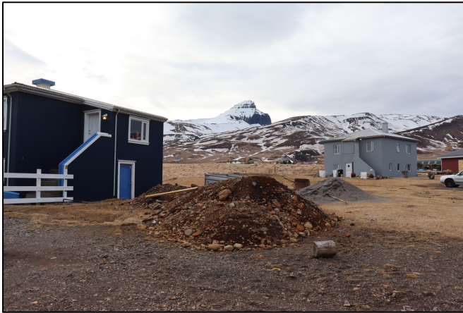
Mynd 6. Horft til NV þar sem 2754-3, Þóreyjarkofi stóð.