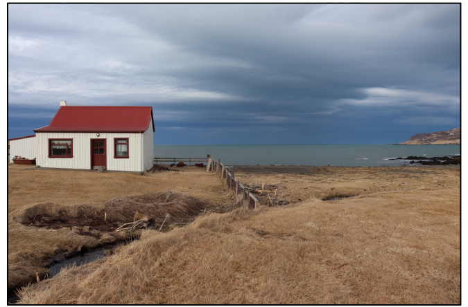
Mynd 7. Horft til NA, til vinstri á mynd má sjá Jörva. Við hlið Jörva, til A, stóð Bergsstaður (Eiríkshús) nr. 2754-4.