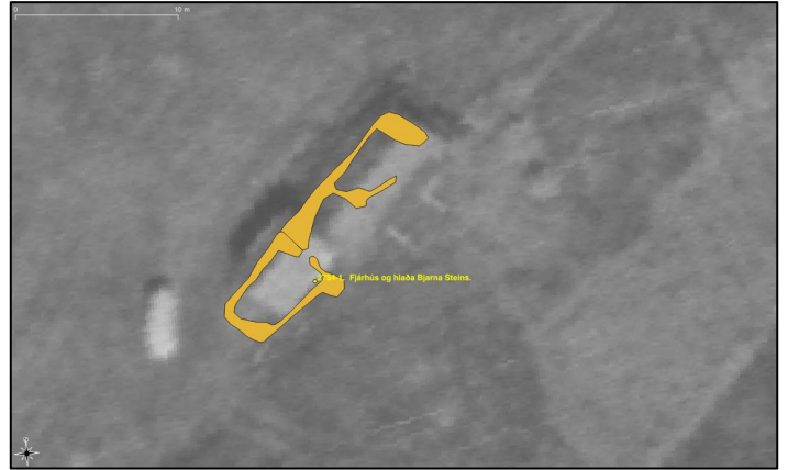
Mynd 5. Rústir tóftar 2754-1 eins og þær voru mældar upp á vettvangi. Undir uppmælingu er loftmynd frá 1955.