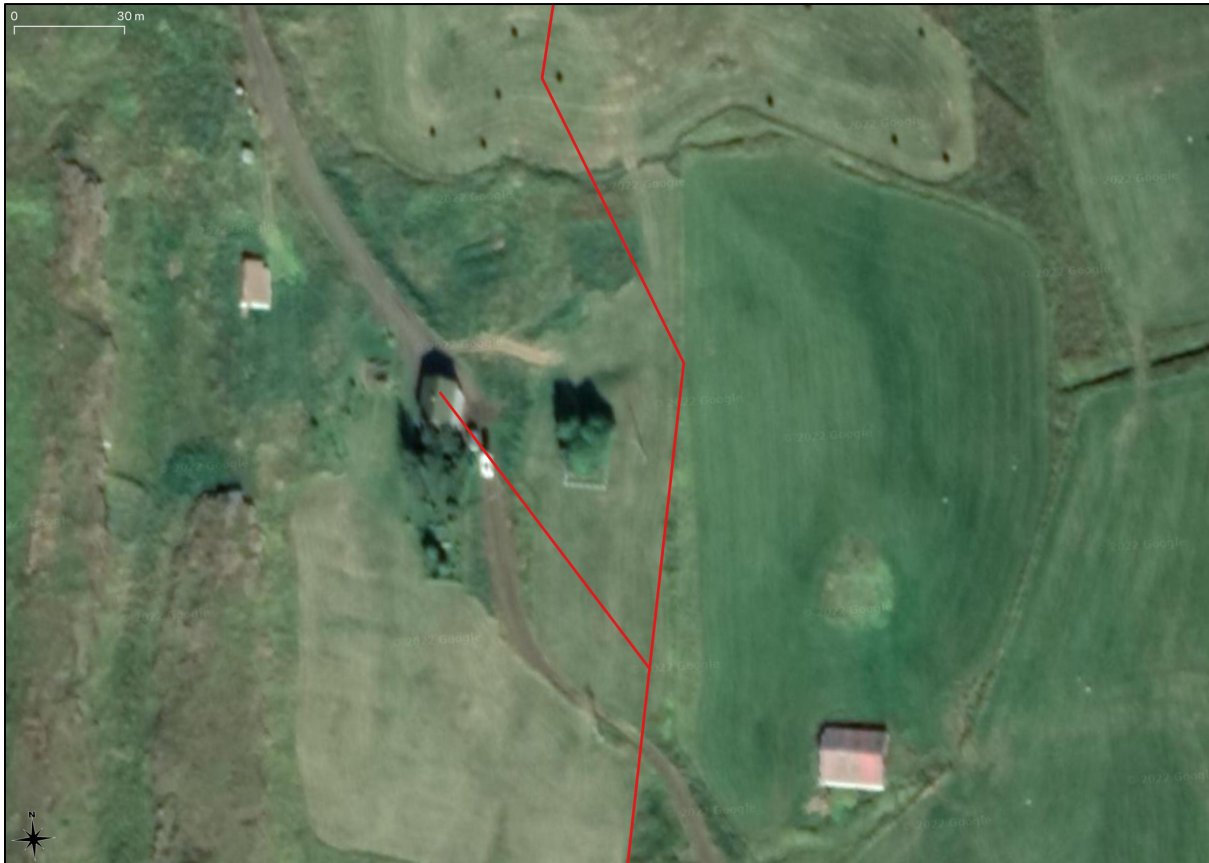
Mynd 1. Á myndinni má sjá merkt inn áætlaða línulögn austan við Rangá í Hróarstungu.