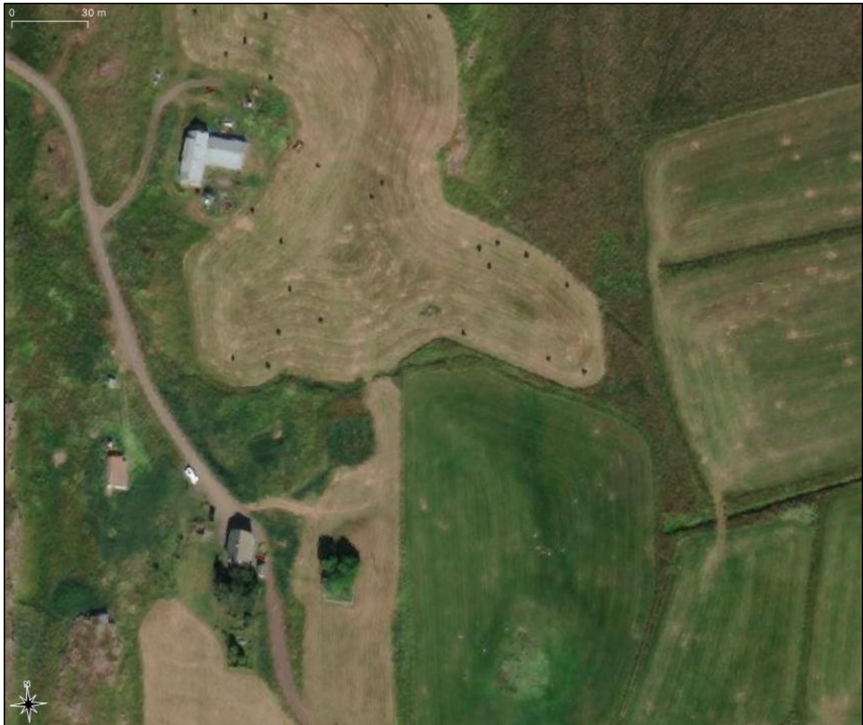
Mynd 5. Loftmynd af Rangá 1. Uppmæld rás er mæld inn með rauðu ef vel er að gáð.