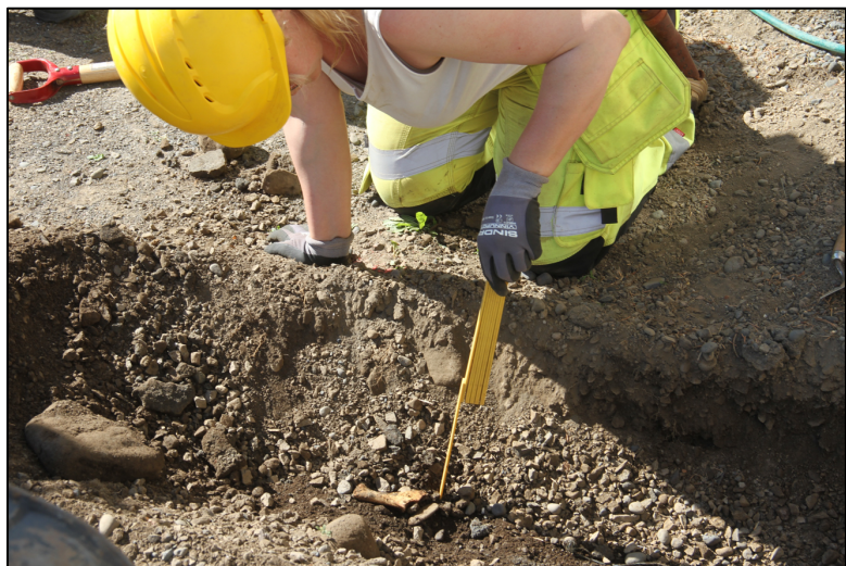
Mynd 3. Skýrsluhöfundur mælir niðurgröft og skoðar stórgripabein úr ruslalagi undir möl. Horft til suðurs og ofan í rás eða lítinn skurð sem var grafinn austan við Rangá 1.

Haft var framkvæmdaefirlit vegna lagningu ljósleiðara austan við Rangá 1 og var farið á vettvang þann 1. júlí 2021 í mjög góðu veðri. Ákveðið var að grafa eins grunnt og unnt væri til að raska ekki grafarró þeirra sem vitað var að hvíldu undir íbúðarhúsinu. Grafirnar sem fundust árið 2006 lágu um það bil 0,6-1 m dýpra en