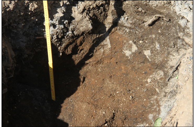
Mynd 4. Ruslaga frá 20. öld undir möl austan við Rangá 1.

ákvörðun Minjastofnunar Íslands með hvaða hætti varðveislu eða frekari rannsóknum skuli vera háttað.