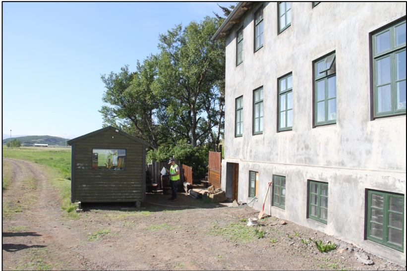
Mynd 2. Horft yfir svæðið áður en framkvæmdir hófust við lagningu ljósleiðara autan við Rangá 1.

Bæjarins er getið í Droplaugarsona sögu og árinna sem bærinn dregur nafn af í Hrafnkels sögu Freysgoða og Fljótsdælu. Talið er að bænhús hafi verið á Rangá fyrr á öldum og jörðin var nefnd í sölubréfi Hafrafellstungu árið 1491. Nústandandi íbúðarhús að