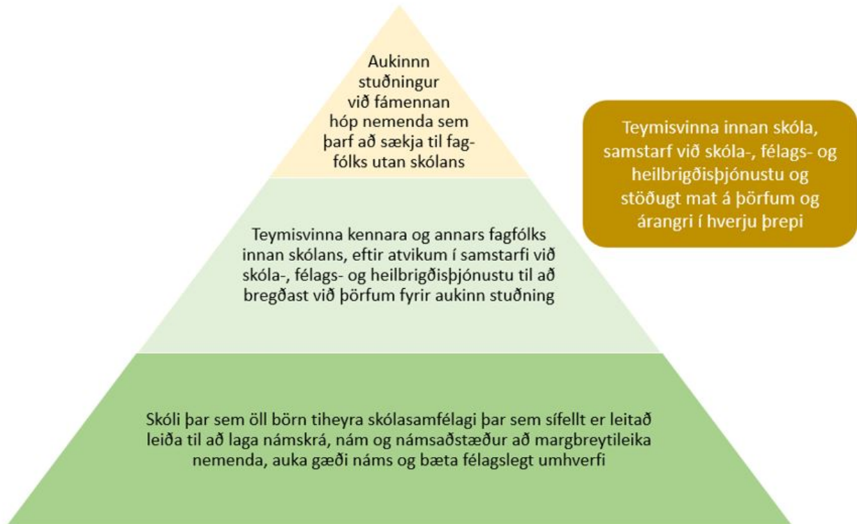
MYND 2. ÞREPSKIPTUR STUÐNINGUR Í SKÓLASTARFI (AÐLAGAÐ FRÁ SIGRÚNU DANÍELSDÓTTUR O.FL., 2019).

hefur þörf fyrir meiri og fjölbættari stuðning sem þarf að sækja til fagfólks utan skólans. Við þessum veruleika þarf að bregðast með þrepskiptingu stuðnings fagfólks innan skóla og eftir atvikum með aðstoð sérfræðinga utan hans eins og lýst er á mynd 2.