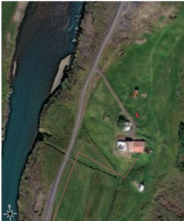
Mynd 3. Línulögn hjá Blöndugerði. Gamli bæjarhólinn og steinhleðsla tengd gamla burstabænum er í um 80 m fjarlægð norðan við línulögn og telst því ekki í hættu.

Heimildir eru um myllutóft við Myllufoss í Blöndu og ævagamall vallargarður var sýnilegur í túni fram yfir 1940.