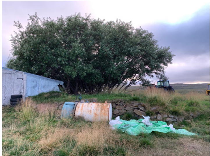
Mynd 2. Horft til vesturs yfir steinhleðslu sem stendur norðan við nústandandi íbúðarhús að Blöndubakka.

Fimm mannabeinafundir (kuml?) hafa fundist í landi Blöndugerðis á síðustu öld. Í urð rétt austan við