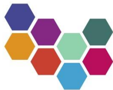
SÓKNARÁÆTLUN NORÐURLANDS VESTRA