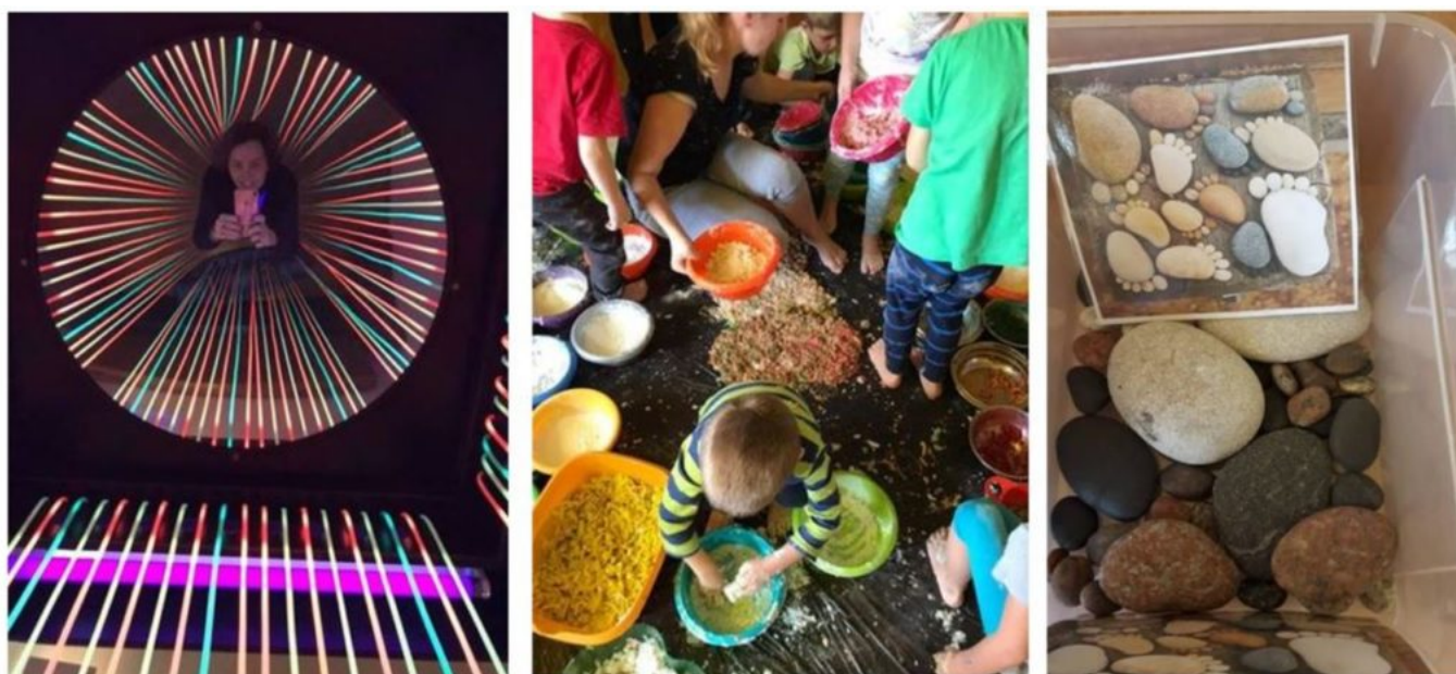
MYNDIR ÚR NÁMSFERÐ OKKAR TIL PÓLLANDS.

Haustið 2019 fóru fjórir kennarar leikskólans til Póllands á námskeið í skynreiðu þar sem kennarar Przedzkole nr. 48 í Zabrze tóku á móti okkur. Þar sáum við margt áhugavert og komum til baka með hafsþjó af fróðleik og hugmyndum sem hafa nýst okkur vel í leikskólastarfinu.