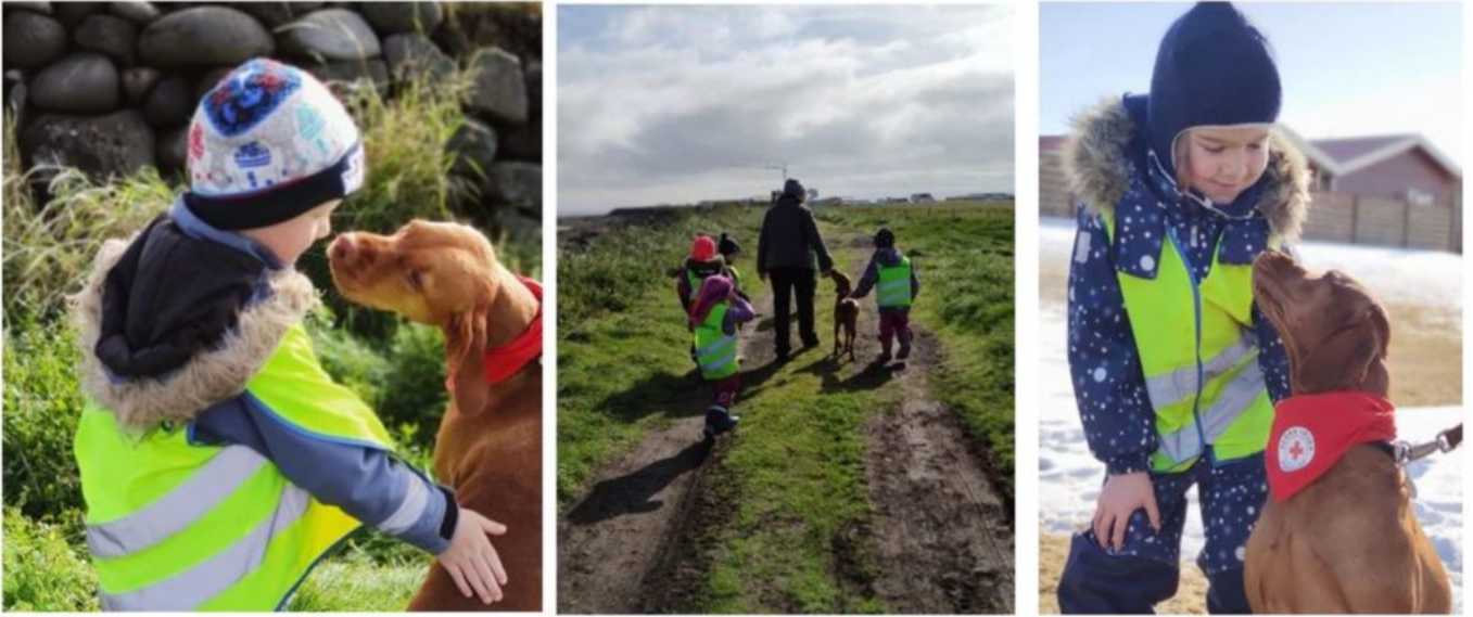
BÖRNIN NJÓTA SAMVISTAR MEÐ VECU.