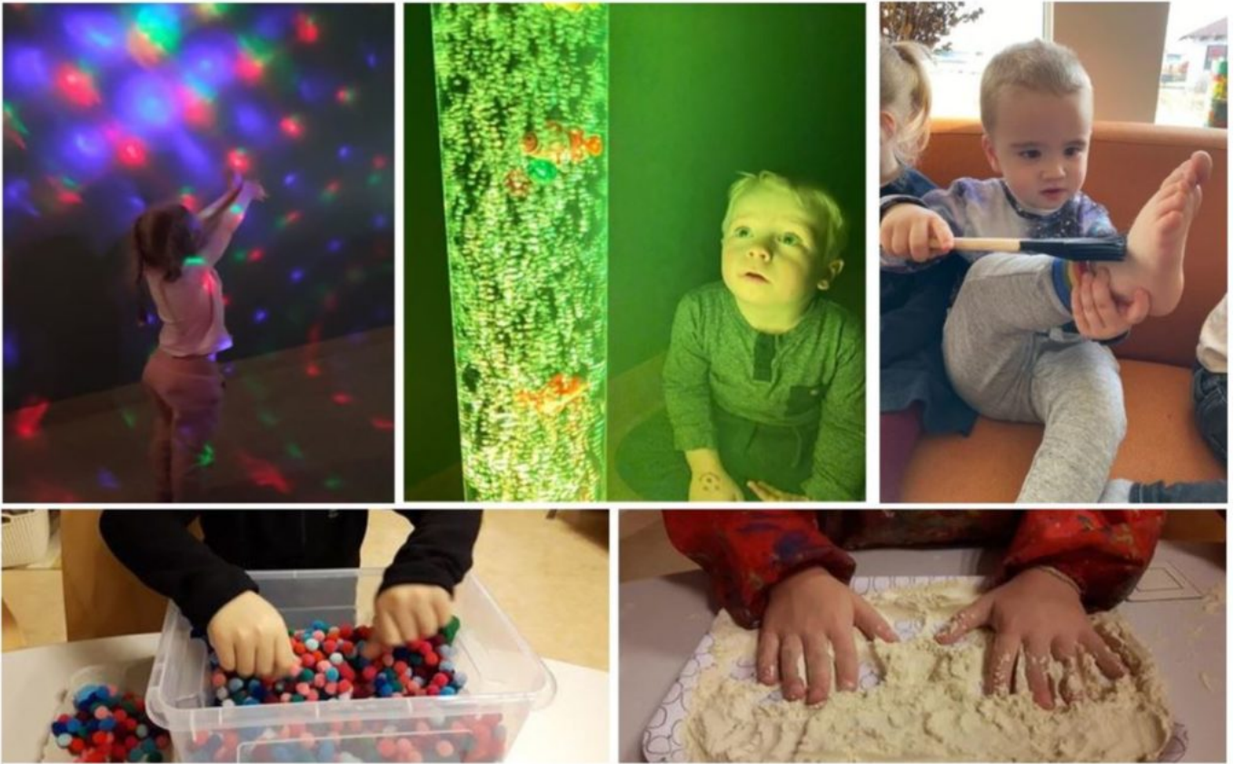
BÖRNIN NJÓTA SÍN Í SKYNNUNARRÝMI LEIKSKÓLANS.

Í tengslum við ferðina til Póllands kom upp hugmynd að fá dýr til liðs við okkur til að örva skynjun barna. Fyrir valinu varð hundurinn Veca, Ungversk vizsla, sem er í eigu kennara skólans. Veca fór í gegnum viðurkennt mat hjá Rauða krossi Íslands og heimsækir nú reglulega börnin í Gefnarborg og fer með þeim í vettvangsferðir. Það er margt sem börnin læra og njóta góðs af í heimsóknum Vecu þar sem hundar örva flest skynfæri. Börnin fá að snerta Vecu og velta fyrir sér ýmsum spurningum. Hvernig er að koma við feldinn? Er hann mjúkur eða harður, kaldur eða heitur? Er öðruvísi að koma við feldinn eða eyrun? Hvernig líður Vecu? Er hún glöð eða leið? Hvernig er lyktin af Vecu? Heyrist hljóð í henni? Hvernig er hún á litinn o.s.frv. Börnin fá að njóta nærveru við hund. Þau sem eru hrædd við hunda fá tækifæri til að komast yfir hræðsluna. Þau læra að bera virðingu fyrir dýrum og hvernig eigi að haga sér á öruggan og viðeigandi hátt í kringum hunda.