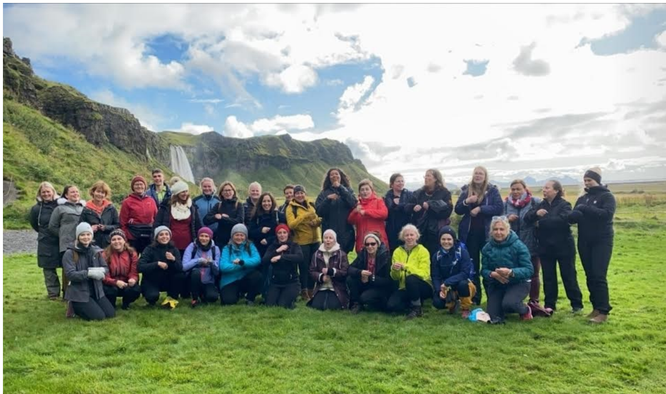
ÞÁTTTAKENDUR Í ERASMUS+ VERKEFNINU Í HEIMSÓKN Á ÍSLANDI.

Kennurum og börnum gefst einnig tækifæri til að vinna saman í eTwinning verkefnum. eTwinning er rafrænn samstarfsvettvangur kennara í Evrópu. Í eTwinning skiptast börnin á upplýsingum, fá tækifæri til að eiga í rafrænum samskiptum og vinna að sameiginlegum verkefnum. Í heimsóknum milli aðildarlanda ákveða kennarar viðfangsefni næstu eTwinning verkefna út frá því sem þeir hafa séð og upplifað í ferðinni sjálfri. Þannig fá kennarar tækifæri til að koma í verk og láta reyna á hugmyndir sem voru til umræðu.