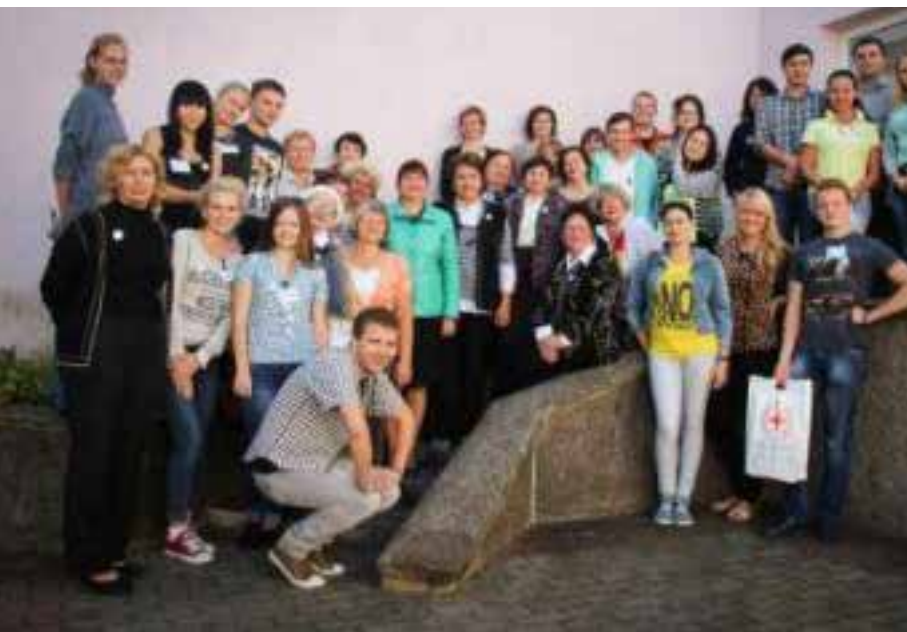
Þátttakendur í sumarbúðum í Vitebsk komu víða að og skiptust á reynslu og þekkingu um mannsalsverkefni.

Ýmislegt bendir þó til að mun fleiri karlar hafi verið hnepptir í þrældóm en opinberar tölur gefa til kynna. Ástæðan er sú að oft er erfiðara að ná til karla, sem eru fórnarlömb mansals, en kvenna. Karlar eru oft taldir vera ólöglegir innflytjendur og mál þeirra ekki rannsökuð