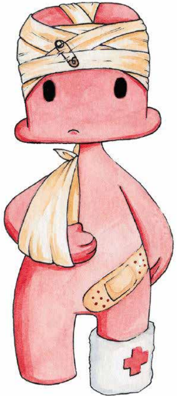
Klaufi, andlit skyndihjálparátaks 90 ára afmælisárs Rauða krossins.

á að hvetja almenning til að hlaða niður skyndihjálparappinu. Í tengslum við daginn var útbúið myndband um mikilvægi skyndihjálpar. Myndbandið var aðgengilegt á facebook og youtubesíðu félagsins.