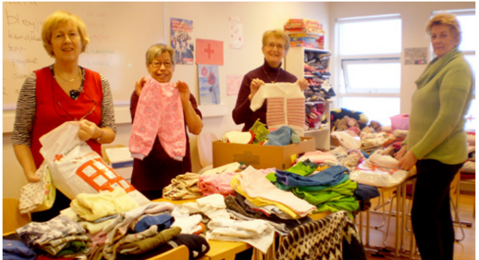
Sjálfbóðaliðar Rauða krossins þrjóna og sauma ungbarnaföt, klæði og teppi í verkefninu Föt sem framlag .

Í fataverkefninu munar miklu um fyrirtækja-samstarf Rauða krossins við SORPU, sem tekur á móti fatnaði á Endurvinnslustöðvum sínum, og Eimskip/Flytjanda, sem annast flutninga innanlands án endurgjalds og utan á afar hagstæðum kjörum.