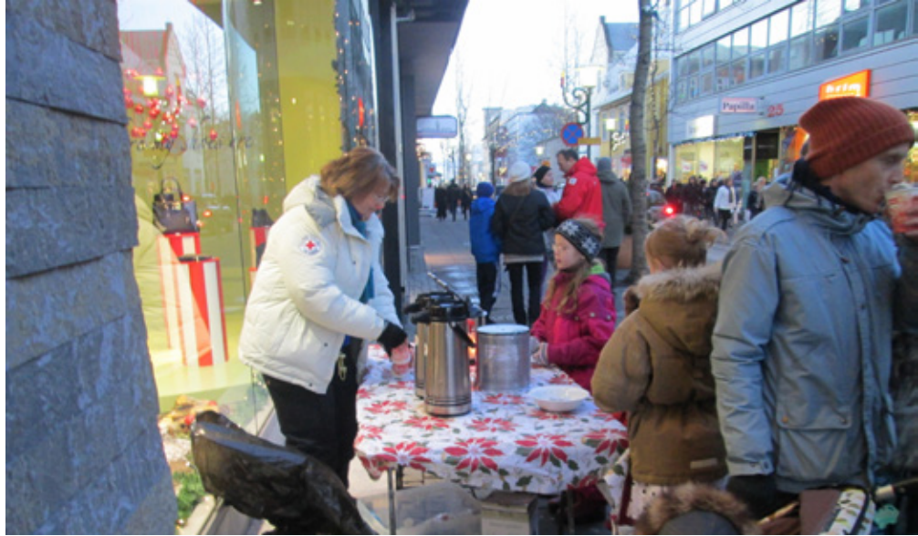
Rauði krossinn í Reykjavík stóð fyrir árlegri kakósölu í fjáröflunarskyni fyrir jólin.