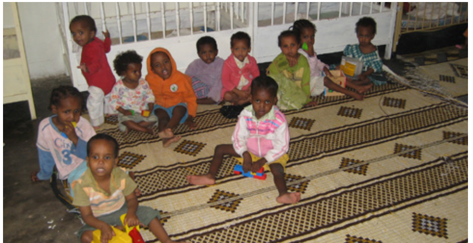
Mannvinir Rauða krossins styðja heimili fyrir 500 munaðarlaus börn í Sómalíu.

Fjárframlög einstaklinga eru mikilvægur tekjugrunnur fyrir Rauða krossinn, og skipar æ stærri sess með árunum. Fjöldi fólks hefur veitt Rauða krossinum reglulega styrki um árabíl en fyrirkomulag greiðslu hefur verið með ýmsum hætti. Árið 2010 var ákveðið að sameina þessa styrktaraðila undir heitinu Mannvinir Rauða krossins.