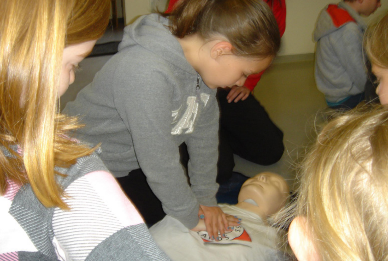
Ungmenni sem tóku þátt í sumarnámskeiði Rauða krossins í Mosfellsbæ fengu skyndihjálparkennslu.