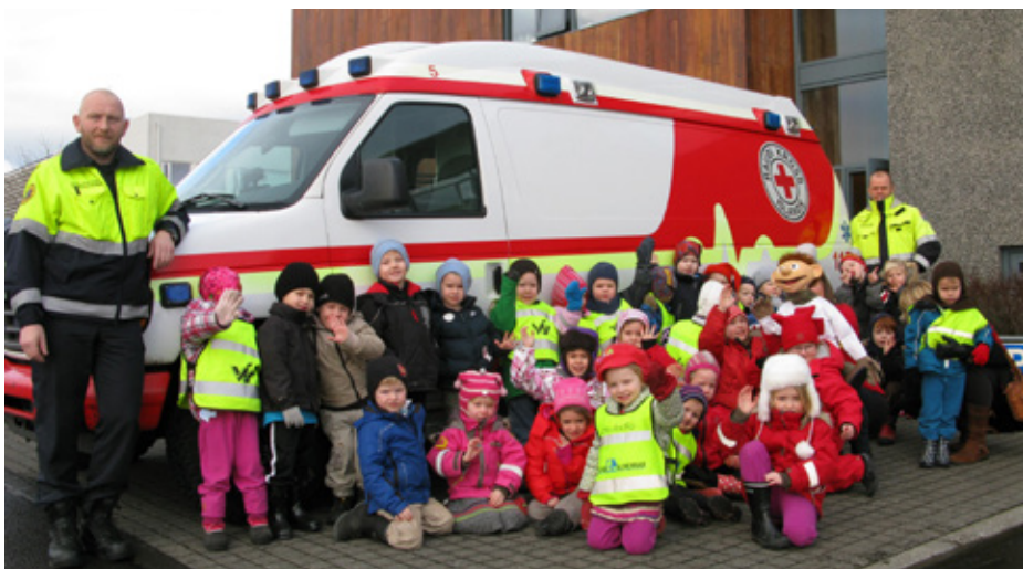
Leikskólabörn af Brákarborg heimsóttu Rauða krossinn og fengu að skoða sjúkrabíl.

Í lok árs 2012 var loks gerður nýr samningur við ríkið um rekstur sjúkrabílfreiða eftir tveggja ára bið, en fyrri samningur rann úr