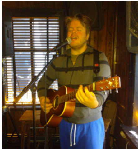
Skúli mennski tróð upp í tónlistarmaræðni til styrktar Rauða krossinum þann 12.12.12.

Þá tóku fjölmargir rekstraraðilar í miðbænum, tónlistarmenn og hönnuðir höndum saman og söfnuðu fyrir jólaúthlutun Rauða krossins þann 12.12.12. Í 12 tíma tónlistarmaræðni og fatauppboði þar sem seld var íslensk hönnun