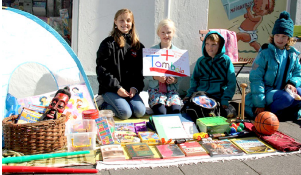
Yfir 500 börn safna peningum fyrir Rauða krossinn á hverju ári.

Yngstu sjálfbóðaliðar Rauða krossins, tombólubörnin, söfnuðu alls um 1,2 milljónum króna á árinu 2012, og fer sú upphæð vaxandi með hverju ári. Um 500 börn styrktu Rauða krossinn með alls kyns fjársöfnunum og eru hugmyndaauðgi þeirra í fjáröflun engin takmörk sett. Tombólubörnin skipa mikilvægan sess í starfi félagsins og sýna að ekkert aldurslágmark er á þörfinni fyrir að gefa af sér til þeirra sem búa við krappari kjör.