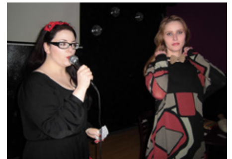
Hönnuðir í miðbænum gáfu vöru sína á uppboði til styrktar jólaúthlutun Rauða krossins.