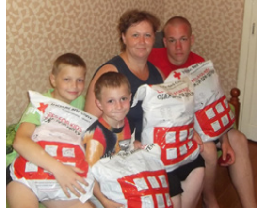
Fjölskylda í Hvíta-Rússlandi með fatapakka frá sjálfboðaliðum Rauða krossins á Íslandi.

Þennan myndarlega stuðning eigum helst að þakka miklum fjölda sjálfboðaliða hér á landi sem hittist reglulega, þrjónar og saumar saman, þvær, straujar og pakkar. Það er ósvikin vinnugleði sem ríkir iðulega meðal sjálfboðaliðanna innan deildanna 29 sem bjóða upp á verkefnið við gerð barnapakka. Vörurnar eru ótrúlega fallega unnar,