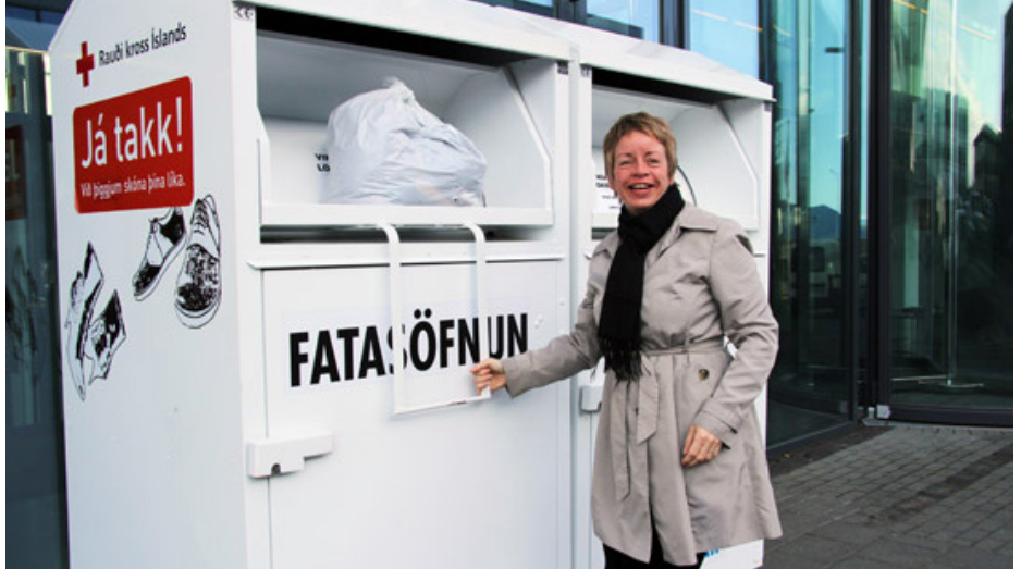
Fatasöfnunargámar Rauða krossins eru um allt land.

Fatasöfnun Rauða krossins er eitt mikilvægasta fjáröflunarverkefni félagsins. Hagnaður ársins 2012 var um 88 milljónir króna, eða um 3 milljónum meiri en árið 2011.