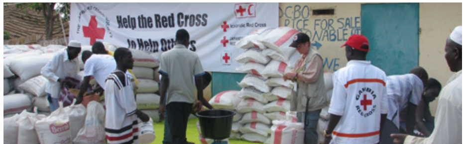
Matvæladreifing í Gambíu þar sem Rauði krossinn á Íslandi studdi neyðaraðgerðir vegna mikils uppskerubrests.

Umfangsmestu neyðaraðgerðir Rauða krossins á Íslandi á Sahel-svæðinu voru stuðningur við hjálparstarfið í Gambíu. Rauði krossinn á Íslandi styrkti starfið um hátt í 45 milljónir og leiddi starf Alþjóða Rauða krossins í landinu. Tveir íslenskir sendifulltrúar komu að hjálpar-