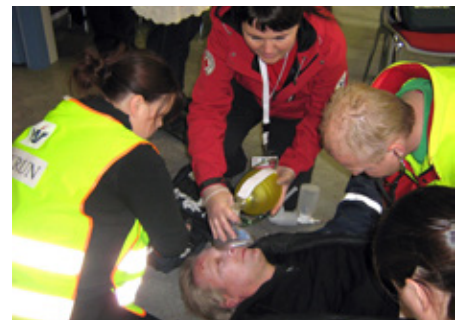
Skyndihjálpar er mikilvægur þáttur í þjálfun sjálfboðaliða.

Flest námskeiðin, eða um 260, voru fjögurra klukkustunda löng, um 95 voru 12 klukkustunda löng, önnur námskeið voru átta eða tveggja klukkustunda löng. Alls héldu 27 deildir félagsins um 220 námskeið. Akranesdeild Rauða krossins hélt flest námskeið