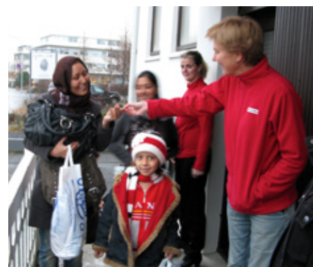
Rauði krossinn sér um stuðningsverkefni fyrir afganska flóttamenn sem komu hingað til lands í október í boði stjórnvalda.

Um 50 sjálfboðaliðar starfa í verkefnum tengdum aðstoð við hælisleitendur og flóttamenn sem leita hingað til lands. Alls sóttu 116 einstaklingar um hæli hér á landi árið 2012. Í lok október komu svo hingað níu