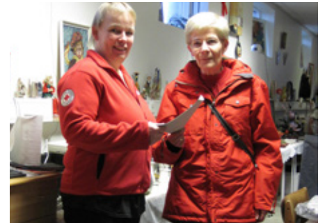
Deildir í Fjarðabyggð fengu jólastyrk frá nytjamarkaðinum Steinum í Neskaupstað.

Að venju voru einnig jólahefti Rauða krossins send til allra heimila landsins. Jólaheftið hefur verið óbreytt í 16 ár og inniheldur merkimiða á pakka, jólamerki á umslög og jólakort. Á hverju ári eru fengnir til samstarfs ungir listamenn. Gíróséðill fylgir heftinu og er landsmönnum boðið að styrkja innanlandsverkefni félagsins með því að kaupa heftið. Að þessu sinni söfnuðust tæpar 11 milljónir króna, en framleiðslukostnaður hefur aukist mikið undanfarin ár og hefur hagnaður því dregist saman milli ára. ■