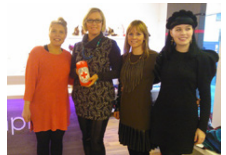
Verslunin Simply á Laugavegi gaf 12% af sölu dagsins þann 12.12.12 til Rauða krossins.