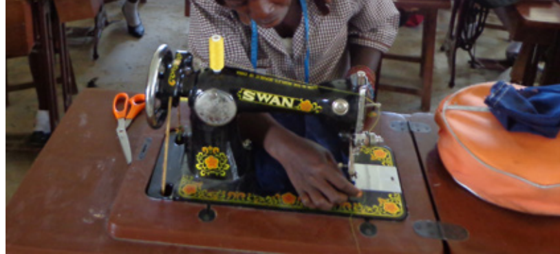
Rauði krossinn á Íslandi styður við athvarf fyrir ungmenni í Moyamba-héraði í Síerra Leóne. Þar lærir unga fólkið handverk og iðn og fær tækifæri til að koma undir sig fótum í lífinu.