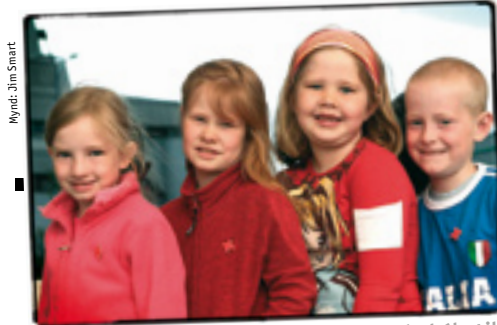
Mynd: Jim Smarr

Rauði krossinn sendi tombólubörnunum viðurkenningarskjal sem þakklætisvott fyrir aðstoðina. Jafnframt bauð Laugarásbíó tombólubörnunum á höfuðborgarsvæðinu í bíó eins og síðastliðin ár og að þessu sinni fengu þau að sjá myndina Kafteinn Skögultönn.