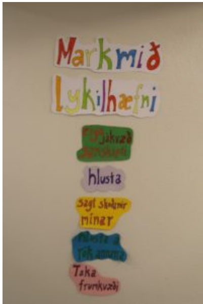
MYND 2- HLUTI AF MARKMIÐUM LYKILHÆFNI. Í HAUST LÖGÐUM VIÐ MIKLA ÁHERSLU Á TJÁNINGU, SAMVINNU OG FRUMKVÆÐI.