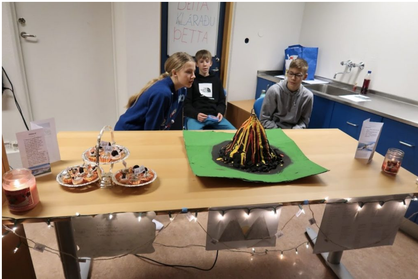
MYND 8 - STOLTIR NEMENDUR KYNNA LANDIÐ SITT. ÞAR VAR MEÐAL ANNARS ELDFJALL SEM NEMENDUR LÉTU GJÓSA Á KYNNINGUNNI.

Fyrir utan markmið lykilhæfni voru markmið okkar í kennarateyminu að búa til skapandi og glaðlegt námsumhverfi og stuðla að góðum og jákvæðum samskiptum. Við vildum einnig efla jákvæða leiðtoga og námsgleði skipti okkur miklu máli. Varðandi samstarf okkar þá höfum við unnið lengi saman og vildum í raun meiri samvinnu. Við festum tíma í hverri viku þar sem við undirbyggjum næstu tíma - eða unnum í námsmati og ræddum síðasta tíma. Við vildum hrista upp í eigin starfsháttum og ögra sjálfum okkur með nýjum nálgunum.