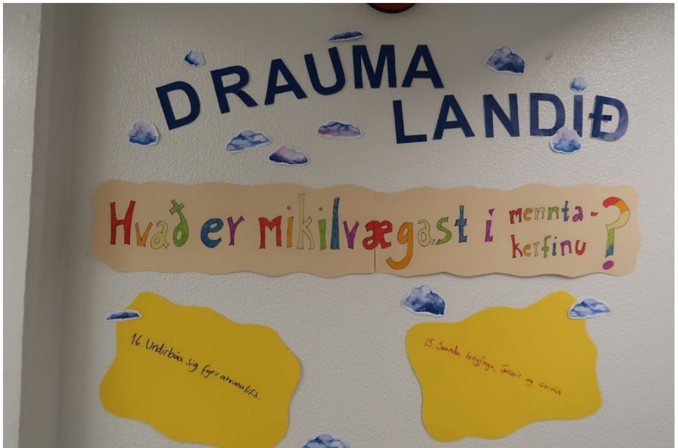
MYND 6 - NIÐURSTÖÐUR ÚR NEMENDASTÝRÐUM UMRÆÐUM UM HVAD SÉ MIKILVÆGAST Í MENNTAKERFINU. HJÁ HLUTA NEMENDA VAR SÚ SKOÐUN RÍKJANDI AÐ TILGANGUR MENNTAKERFIS VÆRI AÐ UNDIRBÚA NEMENDUR UNDIR ATVINNULÍFIÐ EN AÐRIR TÖLDU AÐ MARKMIÐIÐ HLYTI AÐ VERA AÐ NEMENDUR YRÐU HAMINGJUSAMIR.

Áhugavert var að skoða markmið lykilhæfni með hliðsjón af þessum verkefnum. Það var svo margt sem hver hópur þurfti að taka afstöðu til og sammælast um - og margir lentu í talsverðum átökum. En það er nú þannig að enginn fæðist fullnuma í samskiptum og mistök eru ómetanleg tækifæri til þess að læra, það vitum við fullorðna fólkið. Við ræddum opinskátt um samskiptavanda og málamiðlanir og reyndum að leiða hópa sem lentu í vandræðum áfram að lausn en leystum ekki málin fyrir nemendur.