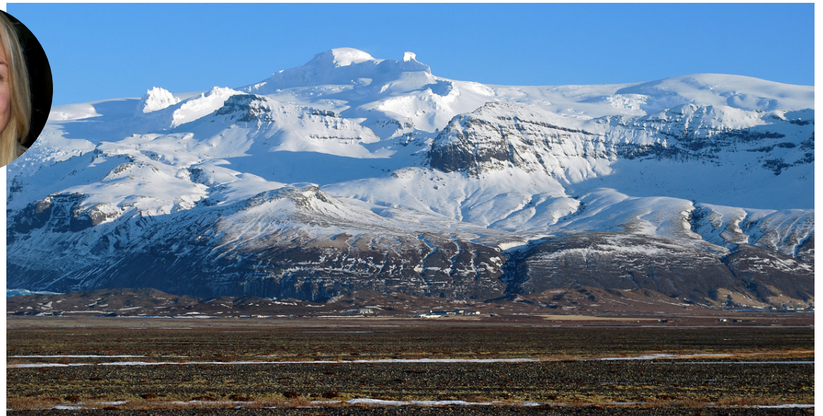
Hvannadalshnúkur í Örfæfaveit lokkar og laðar vegna ósnortinnar náttúru.

fjölbreytt og skemmtileg,“ segir Sigríður Bylgja.