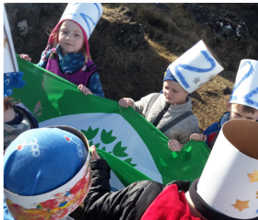
Áhersla er lögð á þátttöku nemenda.

Verkefnið hefur vaxið jafnt og þétt frá því að það hóf göngu sína hér á landi árið 2000, en tæpur helmingur leik-, grunn- og framhaldsskóla um allt land er nú þátttakandi.