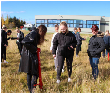
Nemar við MH komu að I SEE verkefninu sem er styrkt af Erasmus+.