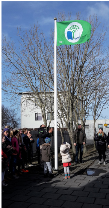
Mikilvægt er að virkja skólasamfélagið og ýta undir sjálfbærni.