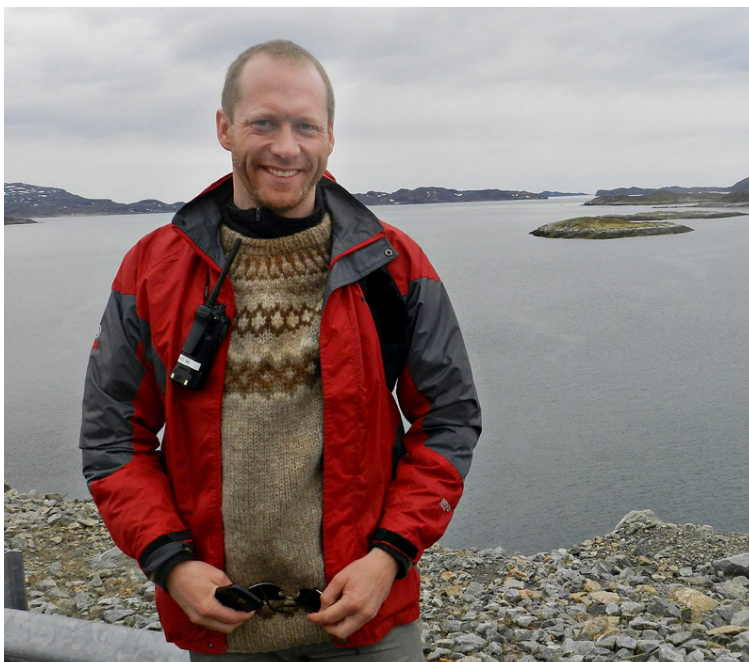
Guðmundur Ingi Guðbrandsson í Nuuk á Grænlandi en ráðherra kann alltaf best við sig í lopapeysunni úti í náttúrunni, hérlendis sem erlendis.

Aðrir merkir samningar hafa einnig verið gerðir sem miklu máli hafa skipt fyrir umhverfis- og náttúruvernd. Þar má nefna samning SP um eyðimerkurmyndun og vernd líffræðilegrar fjölbreytni, Montreal-bókunina um verndun ósonlagsins og Árósasamninginn um rétt almennings til þátttöku þegar kemur að ákvarðanatöku um umhverfismál. Þá hafa einnig komið fram mikilvægar meginreglur í alþjóðlegum umhverfisrétti: Varúðarreglan og mengunar-bótareglan. Allir þessir samningar hafa haft mikil áhrif á umhverfis- og náttúruverndarlöggjöf hérlendis, á viðhorf fólks og umgengni við náttúruna.