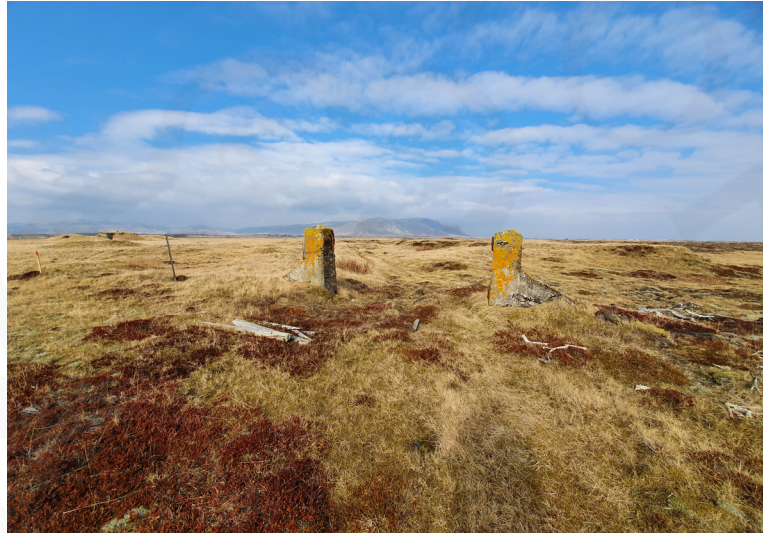
Sendið uppblásturssvæði er ríkjandi innan deiliskráningarreitsins. Á síðustu áratugum hefur gróður víða náð sér á strik. Mosi, lyng og gras eru ríkjandi á þeim svæðum.

Saga jarðarinnar er mjög löng og gæði hennar, stærð og saga benda til þess að hún sé ein af elstu landnámsjörðum svæðisins. Kaldaðarness er víða getið í fornum heimildum. Hennar er fyrst getið í Kirknaskrá Páls sem skrifuð er um 1200 og er getið Flóamanna sögu [líklega rituð um 1300]. Jörðin kemur einnig nokkrum sinnum fyrir í Sturlungu. Jarðarinnar er víða getið í íslensku fornbréfasafni, aðallega í máldögum kirkjunnar, ferjunnar sem og í tengslum við krossinn helga sem var staðsettur á bökkum Ölfusár. Með hjáleigum sínum var Kaldaðarnes langstærsta jörðin í hreppnum, yfir 1700 ha að stærð og 60 hdr að dýrleika, og mun vera ein elsta jörð í Sandvíkurhreppi sem kallaðist áður Kaldnesingahreppur.