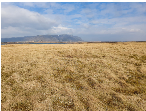
Tóft ÁR-219:014, horft til ANA.

Tóftin er á óblásnu og óróskuðu svæði innan sandgræðslugirðingarinnar. Sunnar og austar er blásið svæði sem gróið hefur upp á síðustu áratugum. Rof í gróðurþekjunni er skammt austan við tóftina.