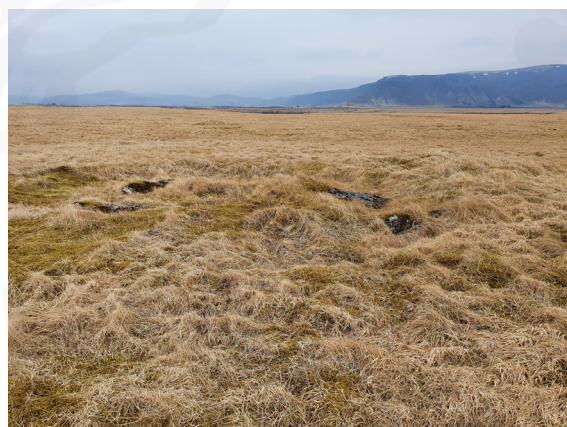
Varðskúr ÁR-219:013, horft til norðurs.