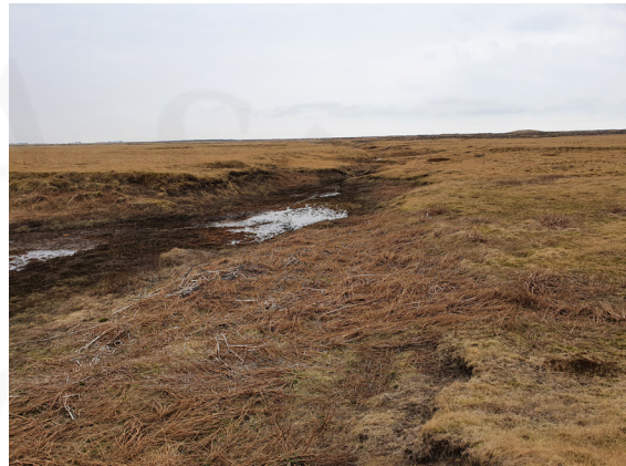
Veituskörð ÁR-219:017, horft til suðurs.