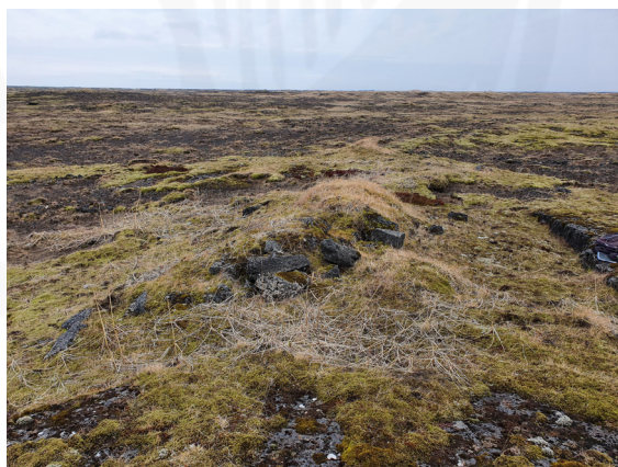
Grjótdreif ÁR-219:015_1 er syðst á holtinu sem varðan var á.