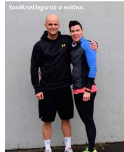
Sauðkrækingarnir á mótinu.