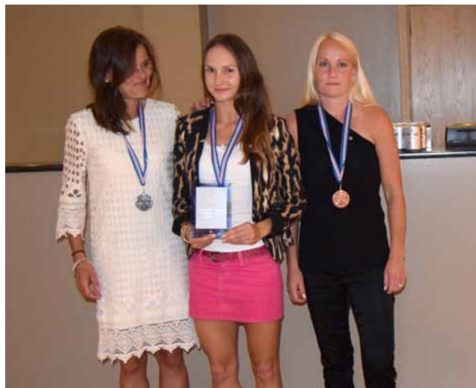
Sigurvegarar í kvennaflokki á NPM í Maraðoni.

Að lokum vil ég þakka þeim stjórnarmönnum ÍSL sem lögðu nótt við dag við vinnu í kringum skipulagningu og framkvæmd NPM 2014, að auki vil ég sérstaklega þakka