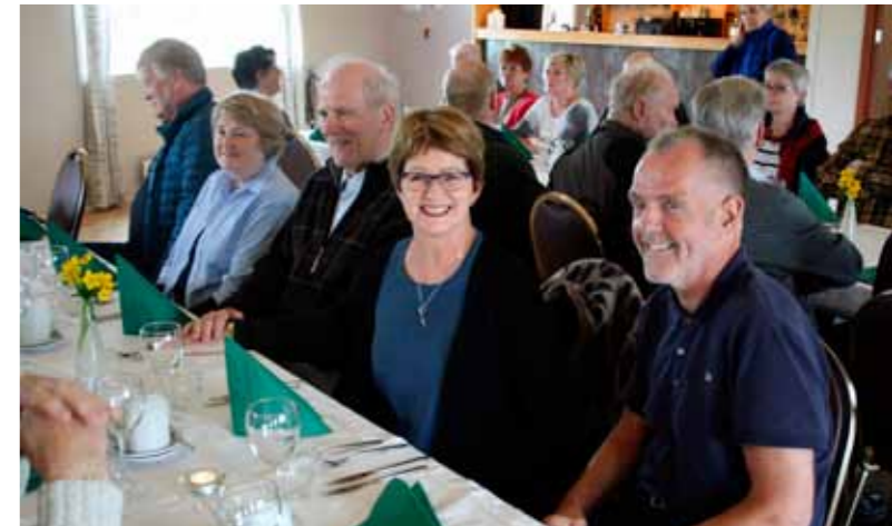
Kvöldverður að Hótel Fljótshlíð.