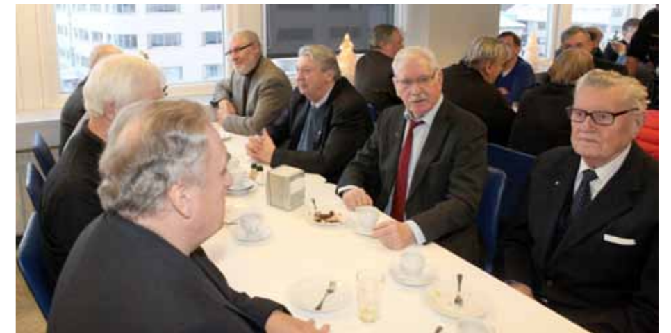
Þórir í kaffisamsæti heldri lögreglumanna.

„Þær voru ef til vill ekki neitt sérstakar miðað