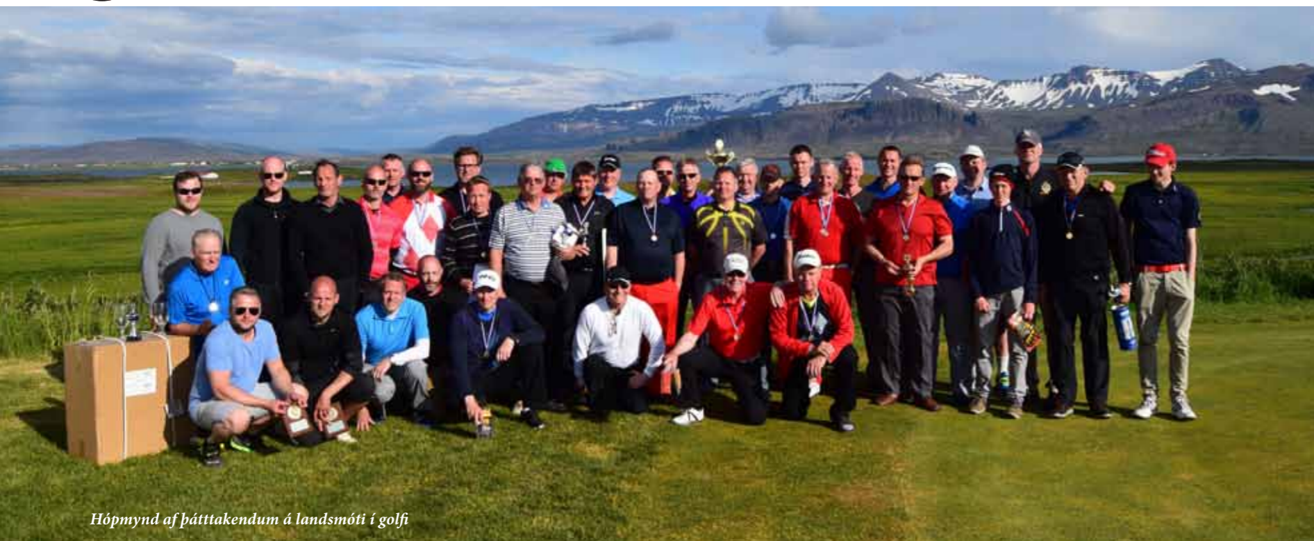
Hópmynd af þátttakendum á landsmóti í golfi