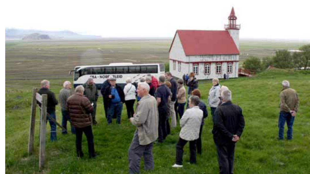
Útsýnið að Hlíðarenda.