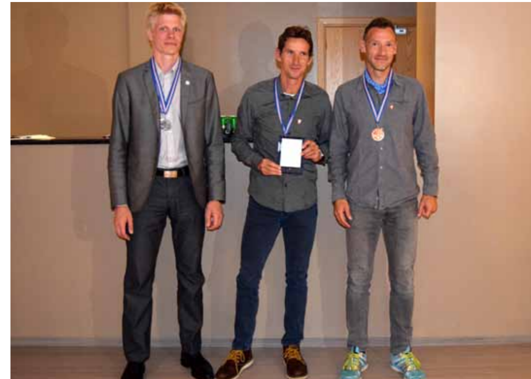
Sigurvegarar í karlaflokki á NPM í Maraðoni.