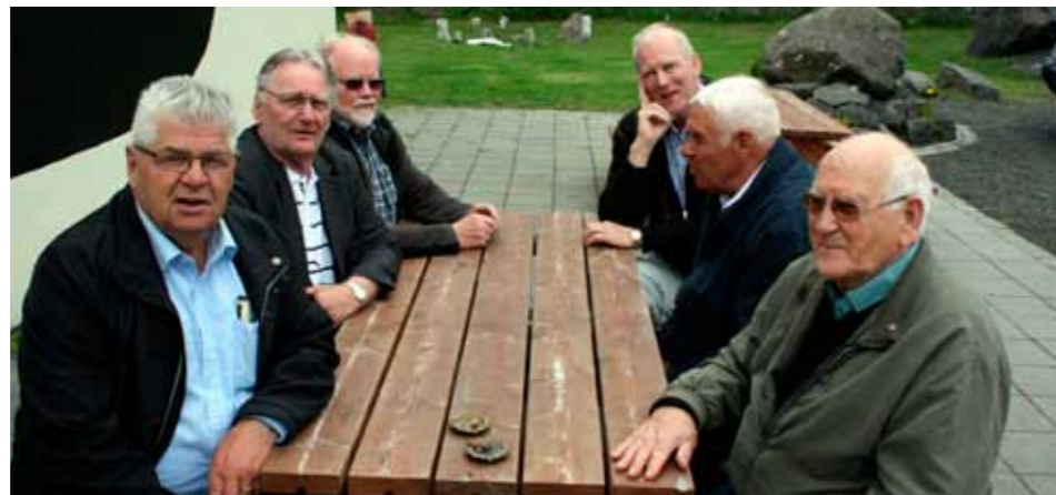
Spekingar spjalla (og pósa).

Fundur lífeyrisþega LL vor 2016 í Brautarholti 30 kl. 10.00. 5. janúar, 2. febrúar, aðalfundur, 1. mars og 5. apríl