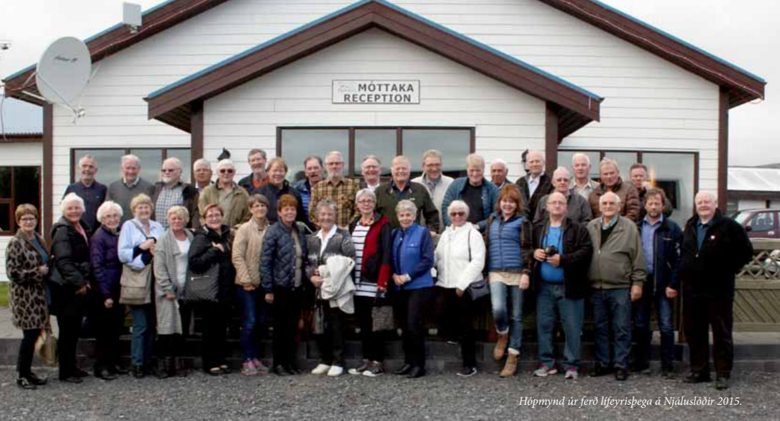
Hópmýnd úr ferð lífeyrisþega á Njáluslóðir 2015.