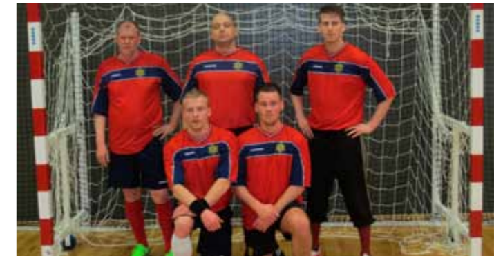
Lið LRH 1.