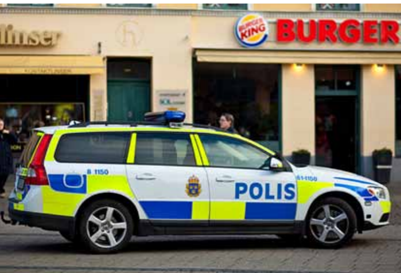
Dansk Politi nr. 8 – 2013