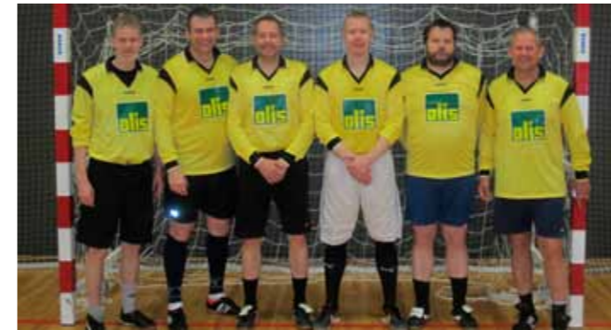
Lið LRH UMF.