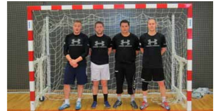
Lið LRH Hafnarfjörður.