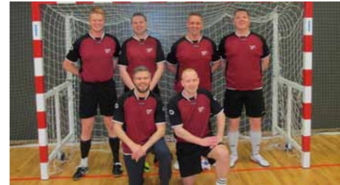
Lið LRH ÁFD.