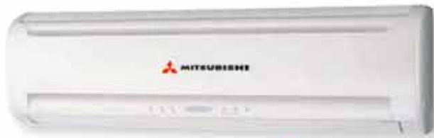
Kælitæki á vegg

Rafstjórn tekur út og þjónustar öll kæli- og loftræstikerfi.