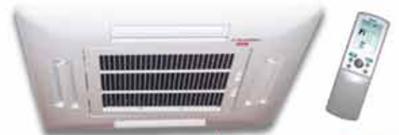
Kælitæki í loft